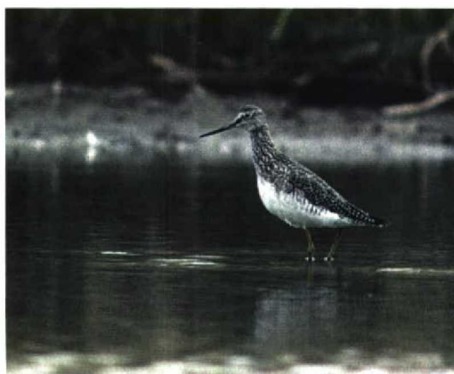
178 Grote Geelpootruiter / Greater Yellowlegs Tringa melanoleuca , Grijskerke, Zeeland, 15 januari 1995 179 Grote Geelpootruiter / Greater Yellowlegs Tringa melanoleuca , Dudzele-Zeebrugge, West-Vlaanderen, België, november 1994 180 Grote Geelpootruiter / Greater Yellowlegs Tringa melanoleuca , Braakman, Terneuzen, Zeeland, 21 april 1995 181 Grote Geelpootruiter / Greater Yellowlegs Tringa melanoleuca , Braakman, Terneuzen, Zeeland, mei 1995

streping; streping richting kin en keel minder dicht, maar daardoor wel meer opvallend. Kruij donkerder dan rest van kop. Teugel donkerbruin. Wenkbrauwstreek voor oog wit, even breed als oog, achter oog met haarfijne schachtstreepjes. Witte oogring. Kin grijsig.