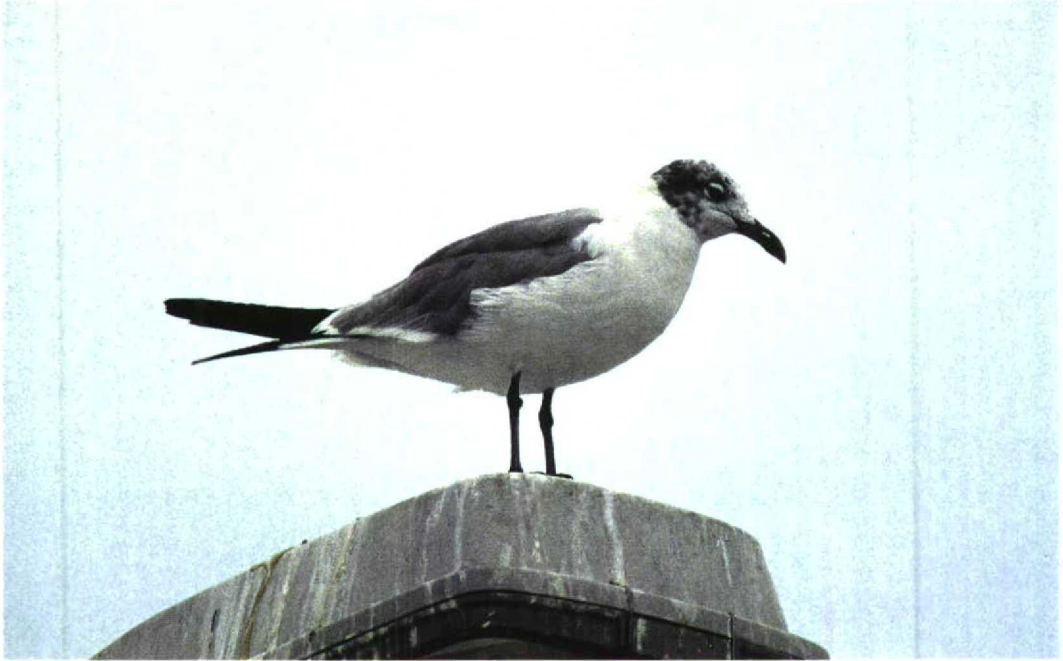
208 Laughing Gull / Lachmeeuw Larus atricilla , Groningen, Groningen, Netherlands, 27 August 1997