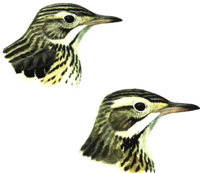
FIGURE 1 Typical head pattern of Blyth's Pipit / Mongoolse Pieper Anthus godlewskii (left) and Richard's Pipit / Grote Pieper A richardi (Brian Small). Note short pointed bill and weak supercilium in front and behind eye in Blyth's; and stronger bill and broad supercilium, sometimes streaked lightly at rear, in Richard's

During recent research on the species, in preparation for some illustrations, I found one