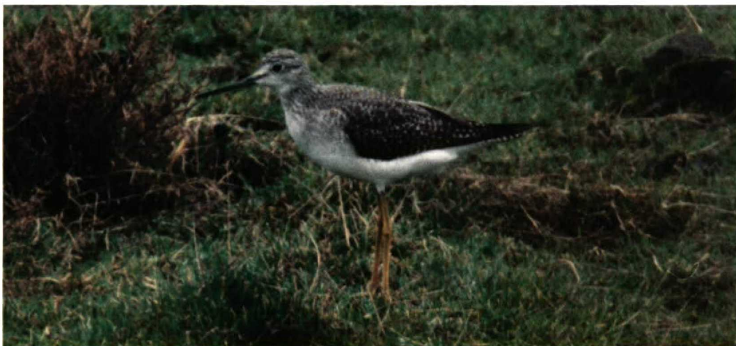
182 Grote Geelpootruiter / Greater Yellowlegs Tringa melanoleuca , Dudzele-Zeebrugge, West-Vlaanderen, België, november 1994 (Bernhard De Langhe)

Dit waren het eerste en tweede geval van Grote Geelpootruiter voor Nederland. De waarneming van een eerste-winter van 27 november tot 2 december 1994 bij Dudzele-Zeebrugge,