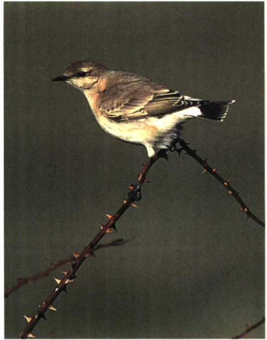
190 Izabeltapuit / Isabelline Wheatear Oenanthe isabellina , Maasvlakte, Zuid-Holland, 23 oktober 1996 191 Izabeltapuit / Isabelline Wheatear Oenanthe isabellina , Maasvlakte, Zuid-Holland, 23 oktober 1996 192 Izabeltapuit / Isabelline Wheatear Oenanthe isabellina , Maasvlakte, Zuid-Holland, 22 oktober 1996