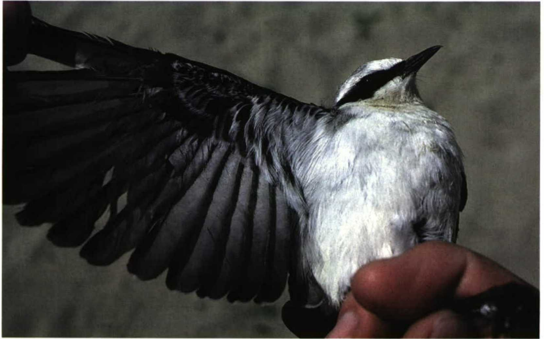
166 Northern Wheatear / Tapuit Oenanthe oenanthe , Omer Gölü, Turkey, 23 April 1987 Note dark underwing

noticeably darker than the underparts, with a sharper contrast between them. Northern always appears very contrasting and at distance the body looks bicoloured, not homogeneous as Isabelline. There have been rare reports of some very pale Northern, chiefly first-winter birds, in which such contrast is similar to that in most Isabelline, though the whole body never appears as homogeneous as in the latter species. Beware also of leucistic or aberrant, oddly coloured Northern. These