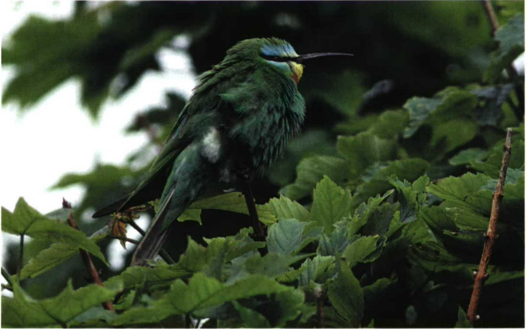
210 Blue-cheeked Bee-eater / Groene Bijeneter Merops persicus , Asta, Shetland, Scotland, 26 June 1997 (Bert van Dillen)