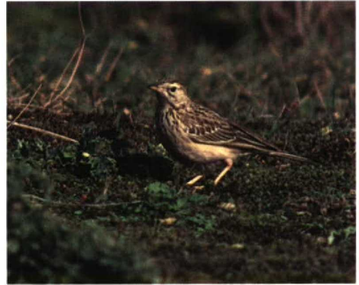
186 Mongoolse Pieper / Blyth's Pipit Anthus godlewskii , Maasvlakte, Zuid-Holland, 26 oktober 1996 (Diederik Kok) 187-189 Mongoolse Pieper / Blyth's Pipit Anthus godlewskii , Maasvlakte, Zuid-Holland, 26 oktober 1996 (Hans Gebuis)

keel licht crèmekleurig. Oog vrij groot en opvallend, met name door lichte omranding.