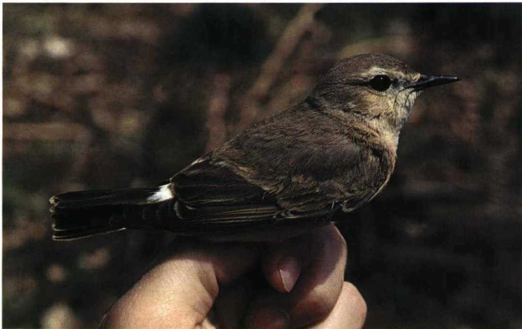
160 Isabelline Wheatear / Izabeltapuit Oenanthe isabellina , Comino, Malta, 28 April 1996. Note short, broad, triangular primary projection, large bulky head, dark alula still contrasting with very worn wing-coverts and small amount of white on rump and uppertail-coverts 161 Northern Wheatear / Tapuit Oenanthe oenanthe , Bloemendaal, Noord-Holland, Netherlands, 30 August 1991. Note tail pattern and compare with Isabelline Wheatear O isabellina in plate 160