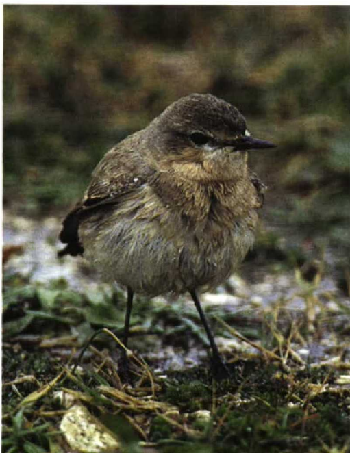
173 Isabelline Wheatear / Izabeltapuit Oenanthe isabellina , southern Sicily, Italy, March 1996. Same bird as in plate 158

UNDERWING (SLIGHTLY VARIABLE (4.4%); MOST RELIABLE OF ALL IDENTIFICATION CHARACTERS) In Isabelline , the underwing is very pale and clean with white or buffish-white underwing-coverts and axillaries and very pale