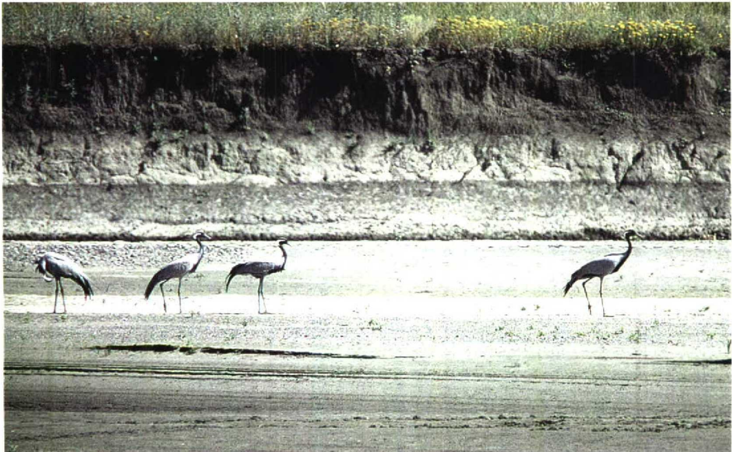
209 Demoiselle Cranes / Jufferkraanvogels Anthropoides virgo , Yoncali, Turkey, 11 July 1997