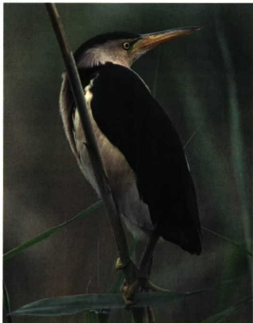
201 Little Bittern / Woudaap Ixobrychus minutus , adult, Waddinxveen, Zuid-Holland, Netherlands, July 1997 (Jan van Holten)