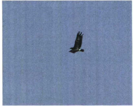
222 Bastaardarend / Spotted Eagle Aquila clanga , Lauwersmeer, Groningen, 29 augustus 1997 (Eric Koops)

over, daarbij gelijk op film vastgelegd door een team van de regionale omroep TV-Noord. Enige tijd later werd hij teruggevonden op een grasveld ten noorden van de Europaweg en vloog vervolgens naar het dak van een bedrijf, onzichtbaar vanaf de grond. Gelukkig stond er een hoge mast en deze bracht voor velen uitkomst; na flink wat meters klimmen kon de vogel bewonderd worden op het dak! Even later kon bovendien de portier van het tegenovergelegen Philips-kantoor worden overgehaald mensen in groepjes van zes toe te laten tot een hoge verdieping van het gebouw, vanwaar de vogel redelijk kon worden bekeken. Met brood en inderhaast bij de nabijgelegen McDonald's aangeschafte hamburgers werden de aanwezige Kokmeeuwen L. ridibundus en soms ook de Lachmeeuw van het dak gelokt om tot in de schemering een hapje te halen. De volgende dagen was de vogel 's ochtends meestal heel vroeg even te zien, om zich pas mooi te laten bekijken in de namiddag en het begin van de avond, wanneer de meeuwen zich verzamelden op de grote parkeerplaats bij IKEA en McDonald's.