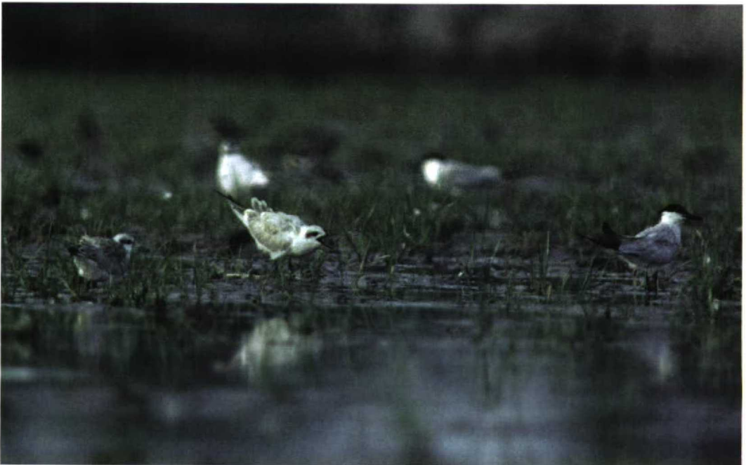
207 Gull-billed Terns / Lachsterns Gelochelidon nilotica , 't Zand, Noord-Holland, Netherlands, 9 August 1997

Larvik, Vestfold, Norway, on 20-21 August. There was much discussion whether a presumed Greater Sand Plover C leschenaultii on 14-16 August at Pagham, Kent, England, could have been Britain's first Lesser Sand Plover C mongolus . On 26 July, an adult Dotterel C morinellus with one young was seen on the Puigmal, Pyrénées Orientales, France, at the French-Spanish border. If accepted, an adult American Golden Plover Pluvialis dominicus roosting at Lesjø, Kørsøer, on 26 July will be the second for Denmark. The ninth for the Netherlands was an adult at Wevers Inlaag, Middel-schouwen, Zeeland, from 30 July to 9 August. This species' first breeding for Europe occurred at Ny Ålesund, Svalbard, Norway, where a pair raised four young in August. The first breeding pair of European Golden Plover P apricaria for Belgium since 1981 was found at Hautes Fagnes, Liège, in July. The fifth Sociable Lapwing Vanellus gregarius for Austria was seen on 13 April at Rabensburg. The second White-tailed Lapwing V leucurus for Sweden stayed at Turkiesjön, Västerås, Västmanland, on 22-24 June, at Östen, Västergötland, at least on 26 June (and probably earlier), and at Rynningeviken, Örebrö, Närke, from 27 June to 6 July. Another stayed at Getterön, Varberg, Halland, on 10-14 July. The first for Denmark was present at Tissoe, Kalundborg, Vest Sjælland, on 13-14 July and at Borreby Mose, Skælskør, Syd Sjælland, from 15 July to at least 3 August. On 16 July, two adult Semipalmated