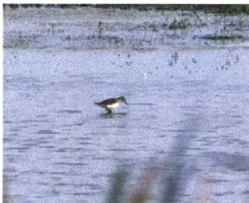
195 Grijze Strandloper / Semipalmated Sandpiper Calidris pusilla , adult, Oostvaardersdijk, Lepelaarsplassen, Flevoland, 19 juli 1996 (Arnoud B van den Berg)

This was the second record of Semipalmated Sandpiper for the Netherlands. The first was also present along Oostvaardersdijk, 13 km to the north, on 12-13 June 1989 (van der Veen 1991). The latter bird could not be photographed due to the distance of 75-200 m;