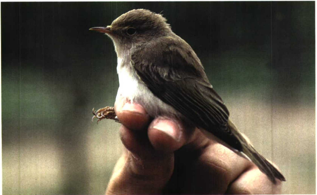
248 Western Bonelli's Warbler / Bergfluitter Phylloscopus bonelli , Illa de Gràcia, Ebro delta, Tarragona, Spain, 4 April 1985 (Ricard Gutiérrez)