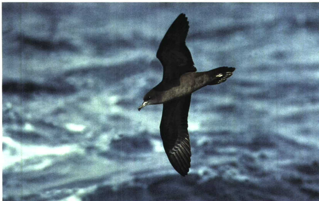
243 Wedge-tailed Shearwater / Wigstaartpijlstormvogel Puffinus pacificus , off Wollongong, New South Wales, Australia, 23 October 1994