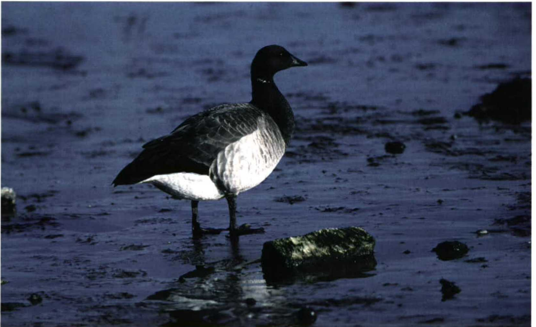
239 Pale-bellied Brent Goose / Witbuikrotgans Branta hrota , Stone Harbour, Cape May, New Jersey, USA, 6 May 1995 (Arnaud B van den Berg)