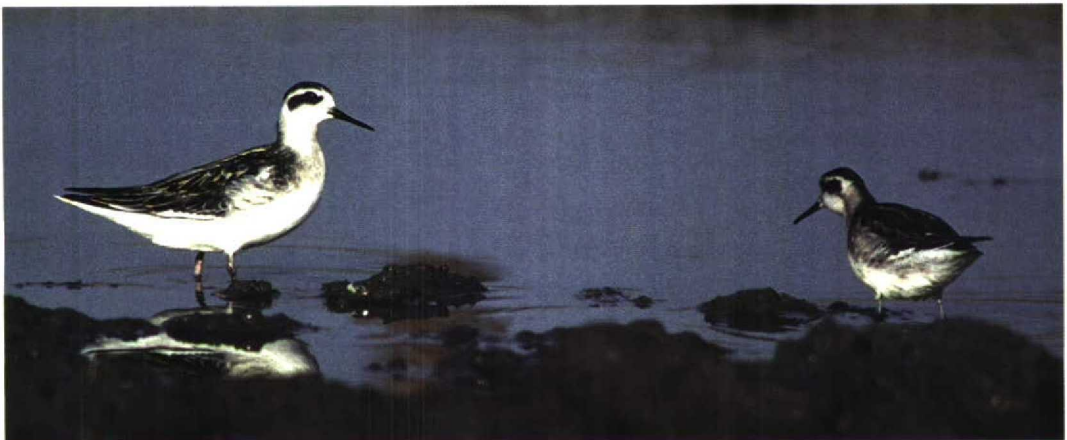
276 Grauwe Franjepoten / Red-necked Phalaropes Phalaropus lobatus , Lopikerkapel, Utrecht, 12 augustus 1997 (Arjan Boele)