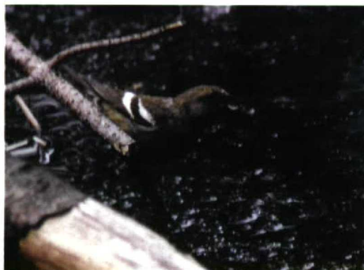
277 Witbandkruisbek / Two-barred Crossbill Loxia leucoptera , Vlieland, Friesland, 12 augustus 1997

De kans lijkt groot dat er gedurende de komende winter nog wel enkele Witbandkruisbekken op zullen duiken, zodat het de grootste invasie voor deze eeuw kan worden. De grootste 20e-eeuwse invasie tot nu toe vond plaats in najaar en winter 1990/91, toen er zeven gevallen waren van in totaal 15 exemplaren (cf Dutch Birding 15: 206-214, 1993; 16, 145, 1994). Opvallend is dat er dit jaar nog nauwelijks meldingen uit Groot-Brittannië zijn gekomen. ENNO B EBELS