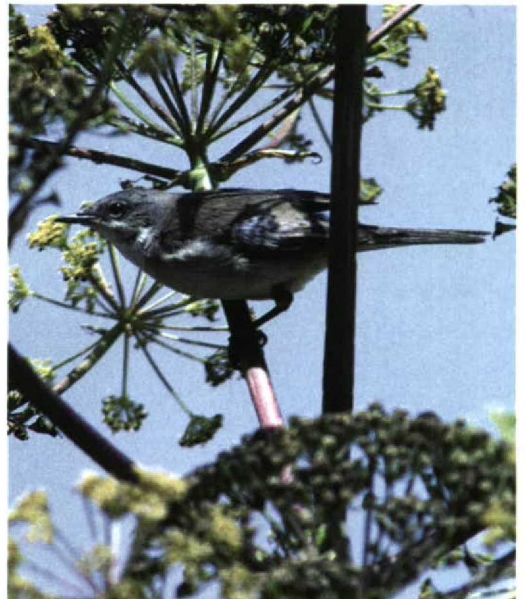
252 Orphean Warbler / Orpheusgrasmus Sylvia hortensis , first-summer female, Lesbos, Greece, May 1995 (Peter de Knijff)