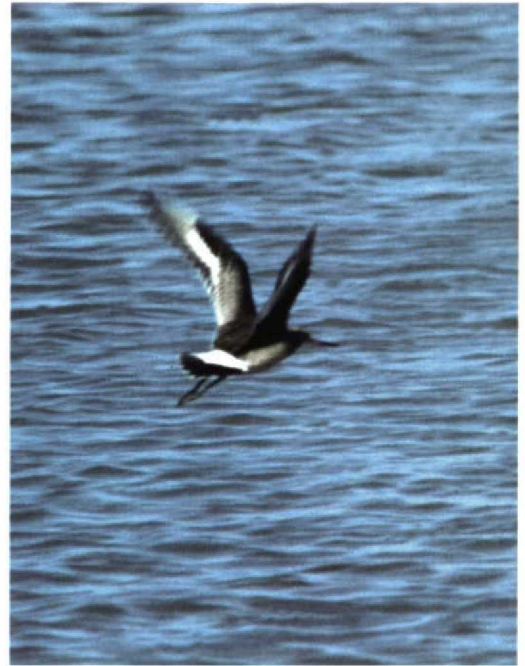
250 Hudsonian Godwit / Rode Grutto Limosa haemastica , juvenile/first-winter, Mary's Point, New Brunswick, Canada, October 1996 (Ronald de Lange)