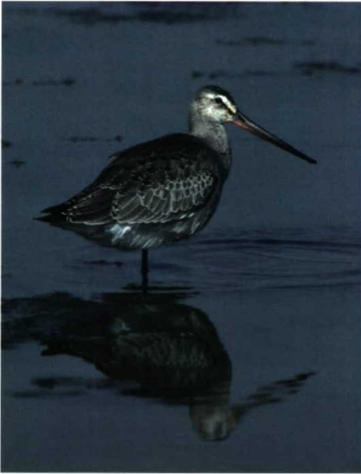
249 Hudsonian Godwit / Rode Grutto Limosa haemastica , juvenile, Cape May Meadows, New Jersey, USA