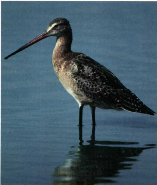
251 Black-tailed Godwit / Grutto Limosa limosa , juvenile, Flevoland, Netherlands, 4 August 1994 (Arie de Knijff)