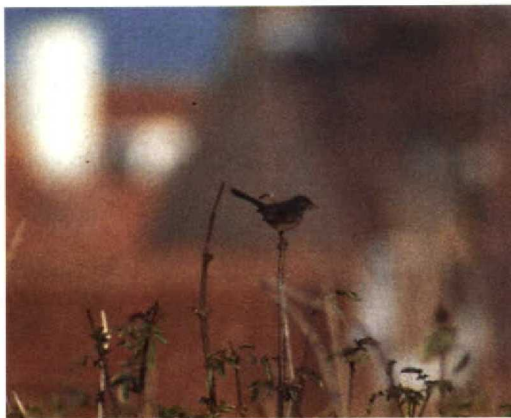
226 Provençaalse Grasmus / Dartford Warbler Sylvia undata , Westkapelle, Zeeland, 1 december 1995

Geen (opvallende) teugel, oogstreep of wenkbrauwstreep. Oogring rood.