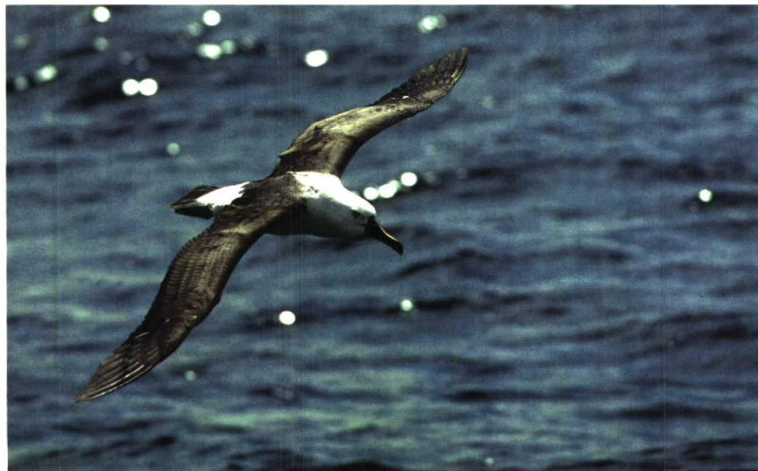
244 Indian Yellow-nosed Albatross / Indische Geelneusalbatros Diomedea chlororhynchos bassi , off Wollongong, New South Wales, Australia, 23 October 1994 (Henk de Groot)