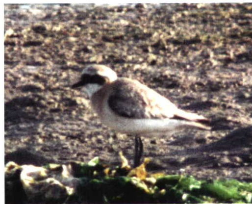
259 American Herring Gull / Amerikaanse Zilvermeeuw Larus argentatus smithonianus , 100 miles west of Lewis, Western Isles, Scotland, 11 September 1997 (Richard White) 260 Purple Swamp-hen / Purperkoet Porphyrio porphyrio , Sandscale Haws, Cumbria, England, October 1997 (Steve Young/Birdwatch) 261 Least Sandpiper / Kleinste Strandloper Calidris minutilla , Lajes de Pico, Pico, Azores, 3 October 1997 (Willem Steenge) 262 Surf Scoter / Brillzee-eend Melanitta perspicillata , first-winter, Faja dos Cubres, São Jorge, Azores, 9 October 1997 (Willem Steenge) 263-264 Lesser Sand Plover / Mongoolse Plevier Charadrius mongolus , Pagham, Kent, England, August 1997 (Jain H Leach)