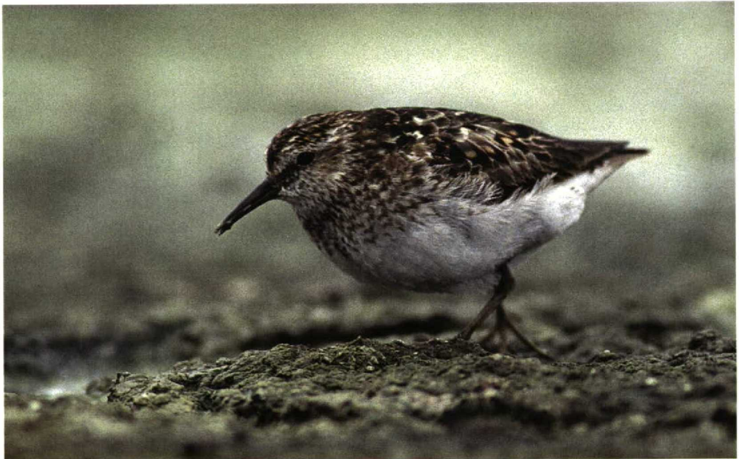
223 Kleinste Strandloper / Least Sandpiper Calidris minutilla , adult, Gent-Mendonk/Rodenhuize, Oost-Vlaanderen, België, 13 augustus 1996

GEDRAG Sterk lijkend op dat van Temmincks Strand-