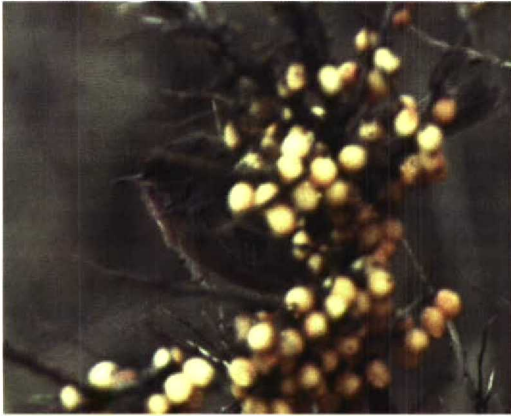
227 Provençaalse Grasmus / Dartford Warbler Sylvia undata , Brielsegatdam, Zuid-Holland, 6 januari 1997