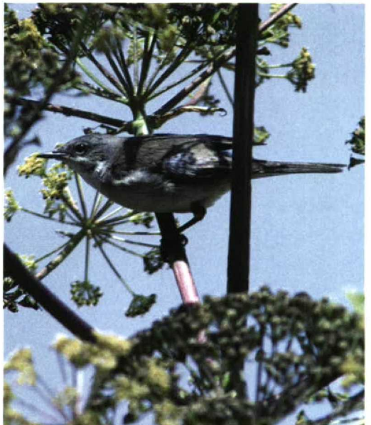
252 Orphean Warbler / Orpheusgrasmus Sylvia hortensis , first-summer female, Lesbos, Greece, May 1995 (Peter de Knijff)