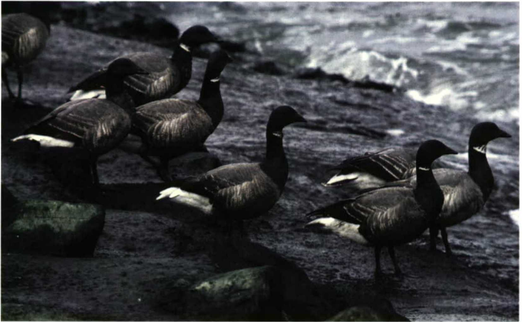
238 Dark-bellied Brent Geese / Rotganzen Branta bernicla , Zuidpier, IJmuiden, Noord-Holland, Netherlands, 26 April 1986 (Arnaud B van den Berg)