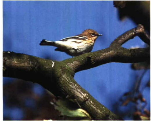
231-232 Mirtezanger / Myrtle Warbler Dendroica coronata , mannetje, Vlieland, Friesland, 13 oktober 1996 (Arnoud B van den Berg) 233 Mirtezanger / Myrtle Warbler Dendroica coronata , mannetje, Vlieland, Friesland, 13 oktober 1996 (Eric Koops) 234 Mirtezanger / Myrtle Warbler Dendroica coronata , mannetje, Vlieland, Friesland, 14 oktober 1996 (Raymond van Splunder)

wit, borst aan beide zijden met 5-6 rijen zwartbruine V-vormige vlekken; centrum van borst wit. Flank met zwavelgele zweem bij vleugelboeg, helder zwavelgeel onder vleugel; vage zwartbruine vlekken flankstrepen vormend.