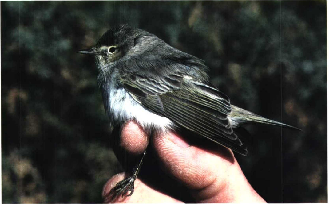
247 Eastern Bonelli's Warbler / Balkanbergflüiter Phylloscopus orientalis , Eilat, Israel, 11 March 1993