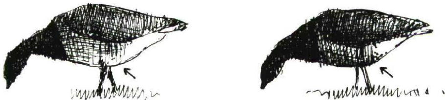
FIGURE 1 Pale-bellied Brent Goose / Witbuikrotgans Branta hrota (left) and Dark-bellied Brent Goose / Rotgans B. bernicla (Enno B Ebels). Note difference in pattern of rearmost belly (indicated by arrow)

I thank Anthony McGeehan for his useful comments and additions.