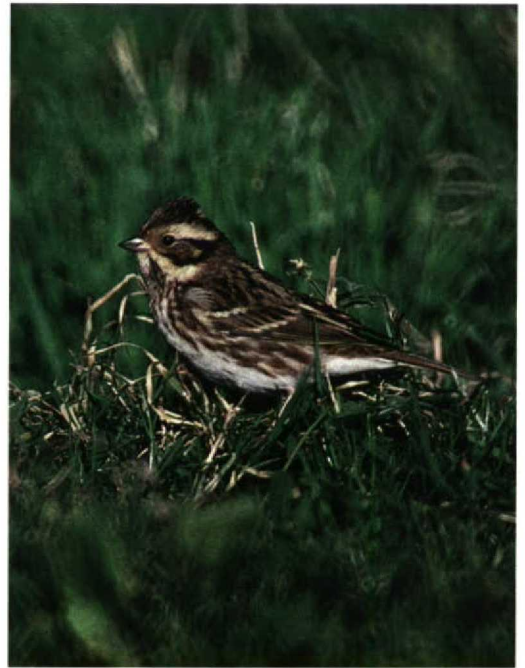
265 American Great White Egret / Amerikaanse Grote Zilverreiger Casmerodius albus egretus , Derry, Northern Ireland, October 1997 (Anthony McGeehan) 266 Rustic Bunting / Bosgors Emberiza rustica , Rathlin Island, Antrim, Northern Ireland, October 1997 (Anthony McGeehan) 267 Lesser Yellowlegs / Kleine Geelpootruiter Tringa flavipes , Sete Cidades, São Miguel, Azores, 25 September 1997 (Theo Bakker/Cursorius)