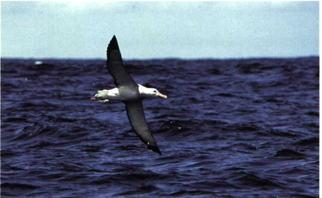
246 Wandering Albatross / Grote Albatros Diomedea exulans , off Wollongong, New South Wales, Australia, 23 October 1994 (Henk de Groot)