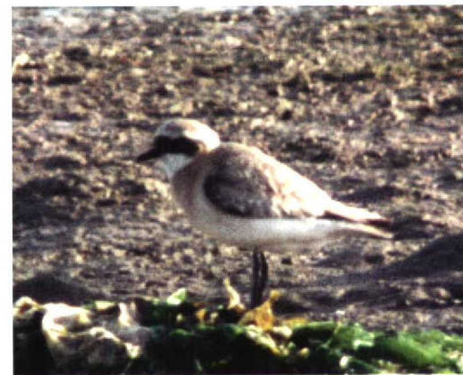
259 American Herring Gull / Amerikaanse Zilvermeeuw Larus argentatus smithonianus , 100 miles west of Lewis, Western Isles, Scotland, 11 September 1997 (Richard White) 260 Purple Swamp-hen / Purperkoet Porphyrio porphyrio , Sandscale Haws, Cumbria, England, October 1997 (Steve Young/Birdwatch) 261 Least Sandpiper / Kleinste Strandloper Calidris minutilla , Lajes de Pico, Pico, Azores, 3 October 1997 (Willem Steenge) 262 Surf Scoter / Brillzee-eend Melanitta perspicillata , first-winter, Faja dos Cubres, São Jorge, Azores, 9 October 1997 (Willem Steenge) 263-264 Lesser Sand Plover / Mongoolse Plevier Charadrius mongolus , Pagham, Kent, England, August 1997 (Jain H Leach)