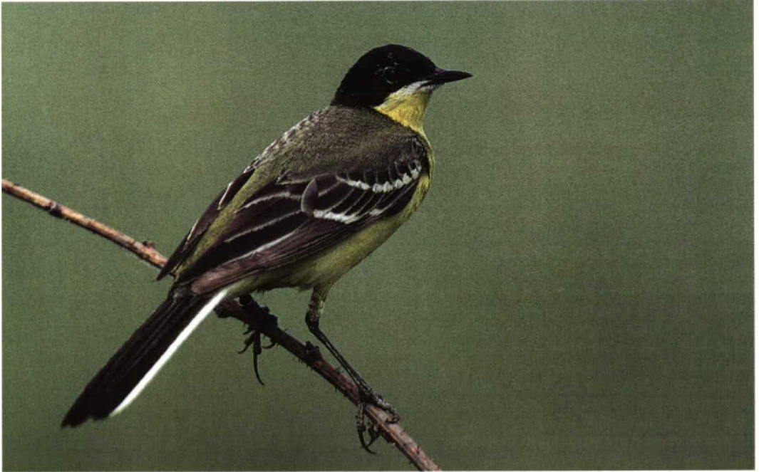
297 Black-headed Wagtail / Balkankwikstaart Motacilla flava feldegg , male, summer plumage, Paimionlahti, Paimio, Finland, June 1997 (Henry Lehto)