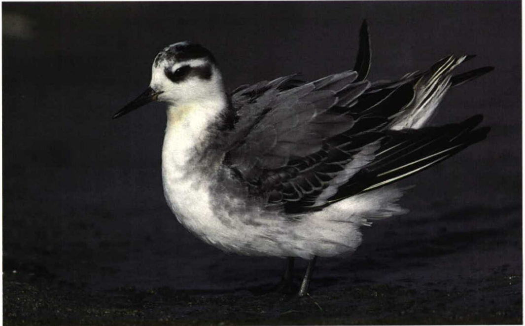
313 Rosse Franjepoot / Grey Phalarope Phalaropus fulicaria , Kennemermeer, IJmuiden, Noord-Holland, 6 oktober 1997 (Arnoud B van den Berg)