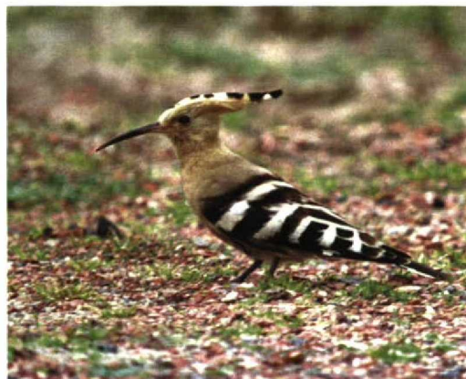
314 Witbandkruisbek / Two-barred Crossbill Loxia leucoptera , mannetje, Oranje-Nassau's Oord, Wageningen, Gelderland, 8 november 1997 315 Pallas' Boszanger / Pallas's Leaf Warbler Phylloscopus proregulus , Texel, Noord-Holland, oktober 1997 316 Lachmeeuw / Laughing Gull Larus atricilla , Groningen, Groningen, 4 oktober 1997 317 Roodkeelpieper / Red-throated Pipit Anthus cervinus , Hoorn, Terschelling, Friesland, 4 november 1997 318 Groenlandse Kolgans / Greenland White-fronted Goose Anser albifrons flavirostris , Workum, Friesland, 9 november 1997 319 Hop / Hoopoe Upupa epops , Texel, Noord-Holland, oktober 1997