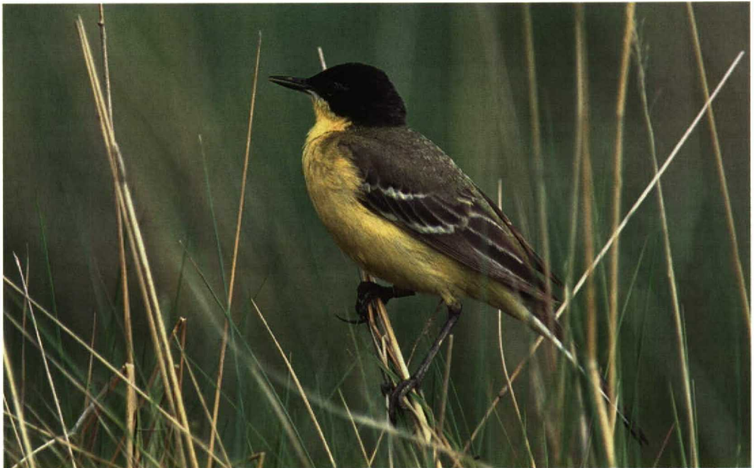
298 Black-headed Wagtail / Balkankwikstaart Motacilla flava feldegg , male, summer plumage, Paimionlahti, Paimio, Finland, June 1997