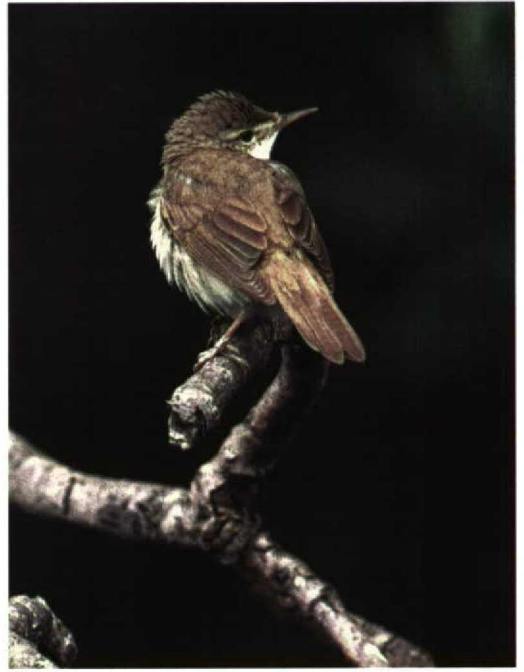
282 Struikrietzanger / Blyth's Reed Warbler Acrocephalus dumetorum , Walem, Limburg, 23 juni 1996 (Arnoud B van den Berg)