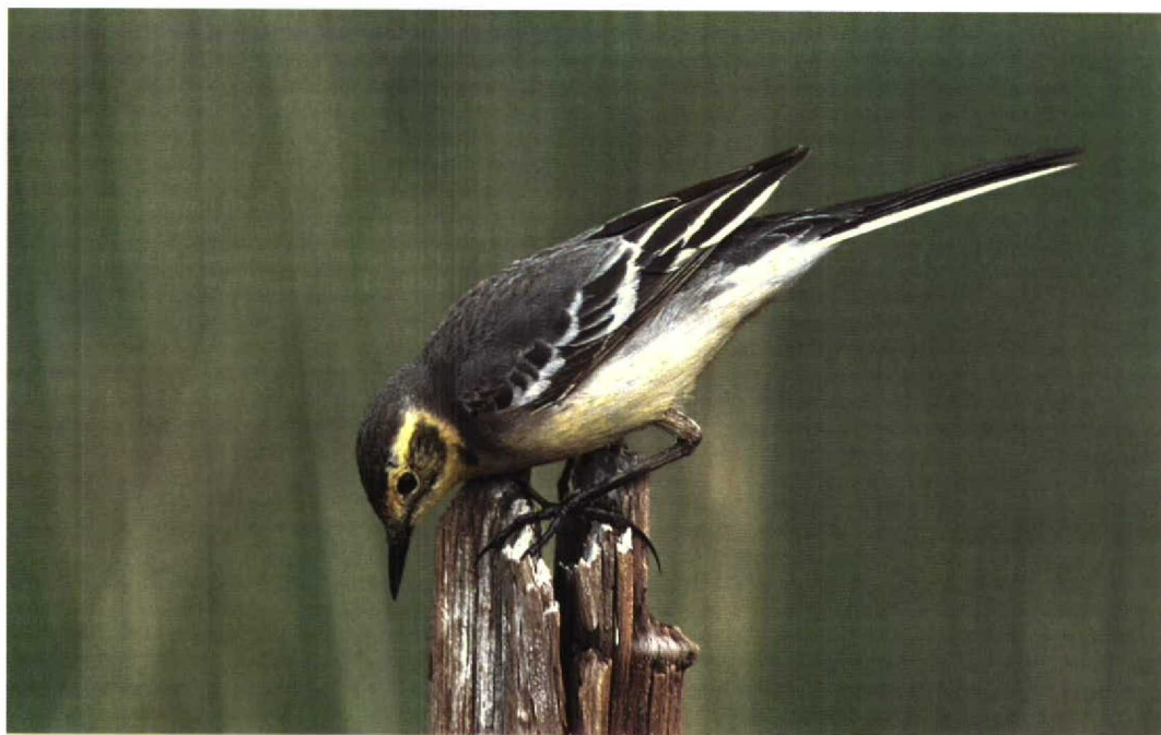
299 Citrine Wagtail / Citroenkwikstaart Motacilla citreola , female, summer plumage, Paimionlahti, Paimio, Finland, June 1997