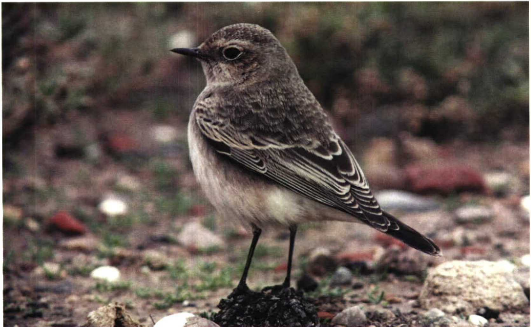
304 Pied Wheatear / Bonte Tapuit Oenanthe pleschanka , Spurn, Yorkshire, England, October 1997