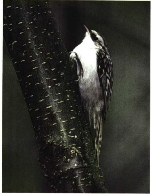
320 Roodsterblauwborst / Red-spotted Bluethroat Luscinia svecica svecica , mannetje, Westkapelle, Zeeland, oktober 1997 (Jan van Holten) 321 Taigaboomkruiper / Eurasian Treecreeper Certhia familiaris , Formerummerbos, Terschelling, Friesland, 30 oktober 1997 (Arie Ouwerkerk) 322 Roze Spreeuw / Rosy Starling Sturnus roseus , juveniel, Anjum, Friesland, 22 november 1997 (Eric Koops)