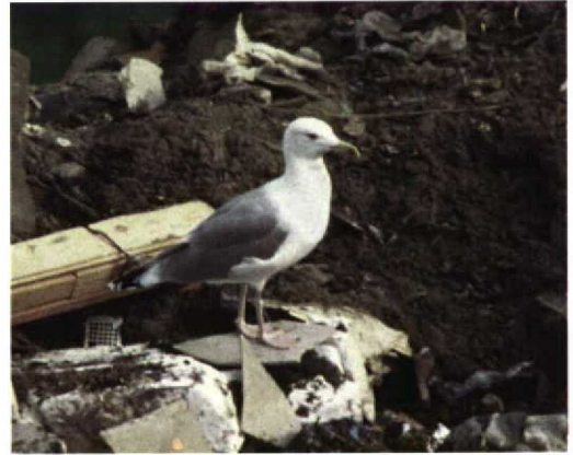
291 Pontische Geelpootmeeuw / Pontic Yellow-legged Gull Larus cachinnans cachinnans (rechts) en Zilvermeeuw / Herring Gull L. argentatus , Zutphen, Gelderland, 4 oktober 1988 (Geert Groot Koerkamp) 292-293 Pontische Geelpootmeeuw / Pontic Yellow-legged Gull Larus cachinnans cachinnans , Zutphen, Gelderland, 4 oktober 1988 (Geert Groot Koerkamp)

Harris et al 1996, Garner 1997, Garner & Quinn 1997, Garner et al 1997, Klein & Buchheim 1997, Klein & Gruber 1997, Liebers & Dierschke 1997). Most important characters were the almost unstreaked all-white head (indicating Pontic or Mediterranean Yellow-legged Gull L. c. michahellis ); grey upperparts colour as in Herring Gull L. argentatus (darker in Mediterranean); wing tips with more white and less black than in Mediterranean; long, slender and parallel-sided bill (heavier with stronger gonydeal angle in Mediterranean); pale yellowish bill with red gonydeal spot and black subterminal marking, mostly on lower mandible (deeper yellow and normally without black in Mediterranean); dark iris (variable in Pontic but often dark, normally pale in Mediterranean); pale yellowish-flesh legs with pinkish-flesh feet (deeper yellow in Mediterranean); and general proportions with sloping forehead, flat belly and very long wings, giving the bird