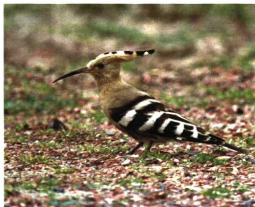
314 Witbandkruisbek / Two-barred Crossbill Loxia leucoptera , mannetje, Oranje-Nassau's Oord, Wageningen, Gelderland, 8 november 1997 315 Pallas' Boszanger / Pallas's Leaf Warbler Phylloscopus proregulus , Texel, Noord-Holland, oktober 1997 316 Lachmeeuw / Laughing Gull Larus atricilla , Groningen, Groningen, 4 oktober 1997 317 Roodkeelpieper / Red-throated Pipit Anthus cervinus , Hoorn, Terschelling, Friesland, 4 november 1997 318 Groenlandse Kolgans / Greenland White-fronted Goose Anser albifrons flavirostris , Workum, Friesland, 9 november 1997 319 Hop / Hoopoe Upupa epops , Texel, Noord-Holland, oktober 1997