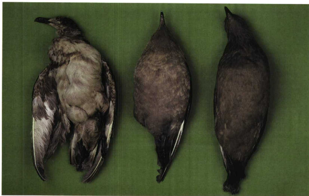
295-296 Gebleekte eerstejaars Grote Jager / bleached first-year Great Skua, Catharacta skua , Hompelvoet, Grevelingen, Zuid-Holland, 24 mei 1990 (ZMA 37386) (links), Zuidpooljager / South Polar Skua C. maccormicki , adult (ZMA 37000) (midden) en Grote Jager / Great Skua, juveniel (ZMA 2556) (rechts) (Louis van der Laan)