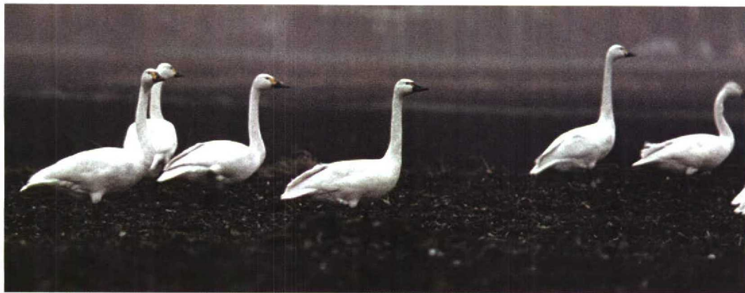
324 Fluitzwaan / Whistling Swan Cygnus columbianus met Kleine Zwanen / Bewick's Swans C. bewickii , Kropswolde, Groningen, 8 december 1997

Fluitzwaan is een zeer zeldzame dwaalgast uit Noord-Amerika. Bovengenoemde vogel betreft het vijfde geval voor Nederland. Het is echter niet uitgesloten dat de twee vorige gevallen in Groningen, in november 1986 (Dutch Birding 11: 118-119, 1989) en december 1992, op hetzelfde exemplaar betrekking hadden. Elders in Europa zijn er aanvaarde gevallen in Engeland (1 of 2), Ierland (6) en Zweden (1). Daarnaast zijn er enkele meldingen uit Duitsland.