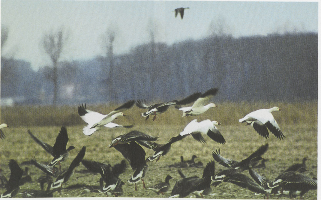
39 Sneeuwganzen / Snow Geese Anser caerulescens , Urk, Noordoostpolder, Flevoland, 4 januari 1997 (Piet Munsterman)