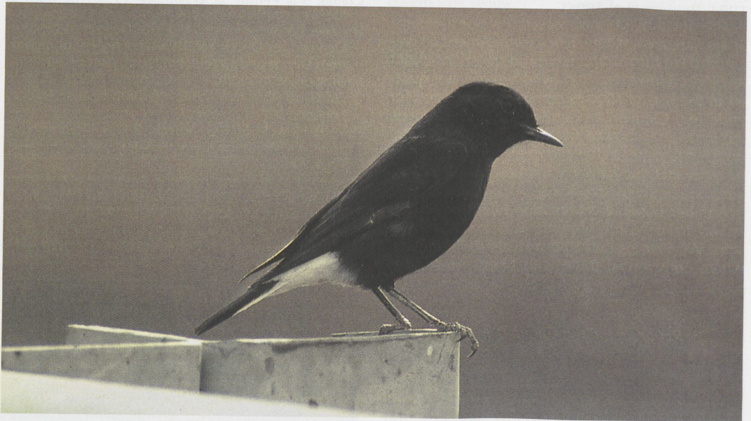
19 'Basalt Wheatear' (black morph of Middle Eastern subspecies of Mourning Wheatear) / 'Basalttapuit' (zwarte vorm van Midden-Oostenondersoort van Rouwtapuit) Oenanthe lugens lugens , As Safawi, Jordan, 7 April 1996 (Ronald de Lange)

A few birds of the typical morph of Mourning Wheatear have been seen within the breeding range of Basalt Wheatear, although they are very scarce in the basalt desert (Andrews 1994). The typical morph normally prefers chalk cliffs and shrubland (Wallace 1983b). Cramp (1988) men-