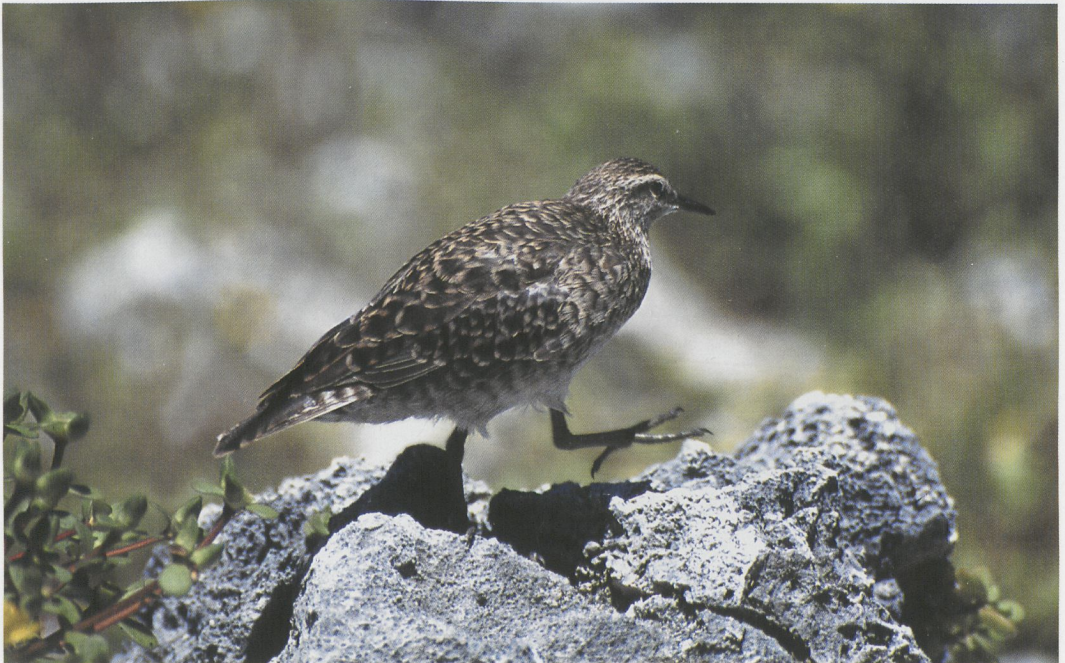
72 Tuamotu Sandpiper / Tuamotustrandloper Prosobonia cancellata , Toreatai, Tahanea, Tuamotu Islands, March 1997 ( Tini & Jacob Wijkema )