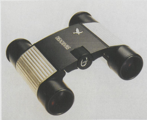
Swarovski 8x20B Century binoculars