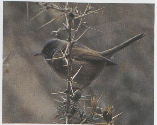
80 Isabelline Shrike / Izabelklauwier Lanius isabellinus , Siracusa, Sicily, Italy, February 1997 (Walter Silvestrini) 81 Lesser Kestrel / Kleine Torenvalk Falco naumanni , Beuvrequen, Pas-de-Calais, France, 30 March 1997 (Marc Ameels) 82 Hume's Warbler / Humes Bladkoning Phylloscopus humei , Isola della Cona, Staranzano, Gorizia, Italy, March 1997 (Maurizio Azzolin) 83 Sociable Lapwing / Steppiekievit Vanellus gregarius , Stenay, Meuse, France, 1 April 1997 (Marc Ameels) 84 Desert Sparrow / Woestijnmus Passer simplex , at nest, Erg Chebbi, Merzouga, Tafilalt, Morocco, 9 April 1997 (Arnoud B van den Berg) 85 Tristram's Warbler / Atlasgrasmus Sylvia deserticola , Gorges du Todra, Tinerhir, Morocco, 10 April 1997 (Arnoud B van den Berg)