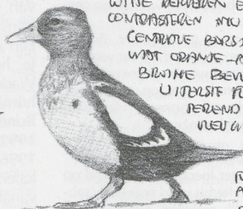
SNEL SWOPEND OVER HET WOOD

MANTEL EN SCHOUWERBLADEN BIJNA VOLLEDIG BIJWIJZIG, MET UITZONDERING VAN RESTANT VAN DE MANTEL VAN DE BRUKE MANTEL-V. (ZIE ONDER).