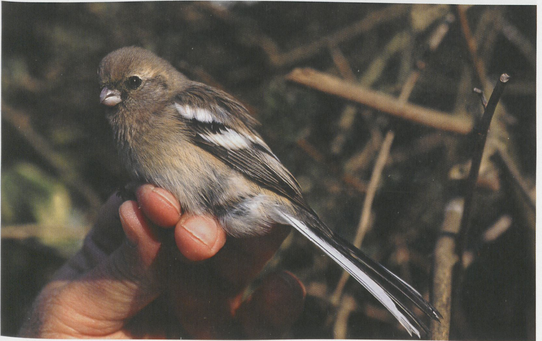
88 Langstaartroodmus / Long-tailed Rosefinch Uragus sibiricus , Bloemendaal, Noord-Holland, 10 maart 1997