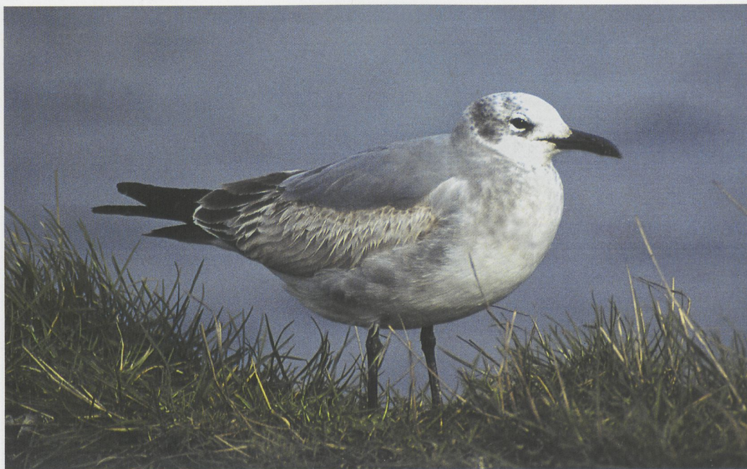
78 Laughing Gull / Lachmeeuw Larus atricilla , Newry, Down, Northern Ireland, March 1997