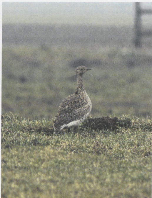
92 Kleine Trap / Little Bustard Tetrax tetrax , Etersheim, Noord-Holland, 8 maart 1997 (H H van Dillen)

gemaakt. Diezelfde dag en vele dagen daarna liet de vogel zich door een groot aantal belangstellenden prachtig bekijken. Op zaterdag 8 en zondag 9 maart zag een aantal vogelaars hoe de vogel een soort van baltsgedrag vertoonde. Op 24 maart werd de Kleine Trap voor het laatst gemeld.