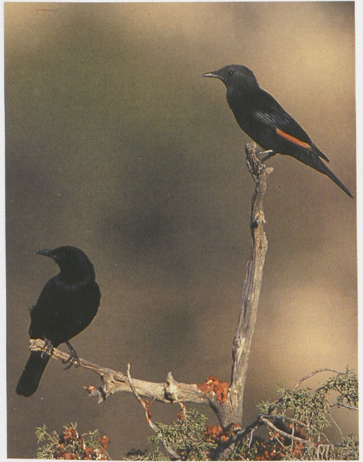
57 Syrian Serin / Syrische Kanarie Serinus syriacus , Wadi Dana, Jordan, 3 April 1996 (Ronald de Lange) 58 Tristram's Starlings / Tristrams Spreeuwen Onychognathus tristramii , adult male and female, Wadi Dana, Jordan, October 1994 (Tim Loseby) 59 White-spectacled Bulbuls / Arabische Buulbuuls Pycnonotus xanthopygos , Wadi Dana, Jordan, October 1994 (Tim Loseby)