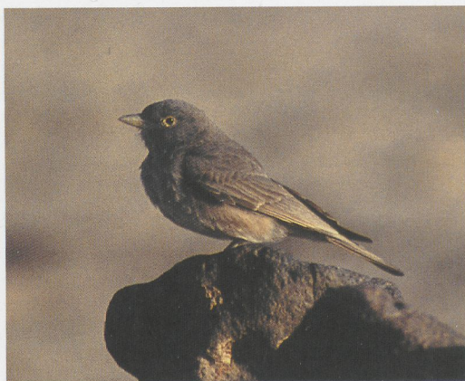
61 Dark Desert Lark / Donkere Woestijnleeuwerik Ammomanes deserti annae , As Safawi, Jordan, 9 April 1996 (Paul G Schrijvershof)

Hotel. In spring, migrants (herons, waders, skuas, swallows, wagtails etc) can often be seen making landfall here, whilst throughout the year seabirds fly back and forth along the Aqaba shore and around the dock area.