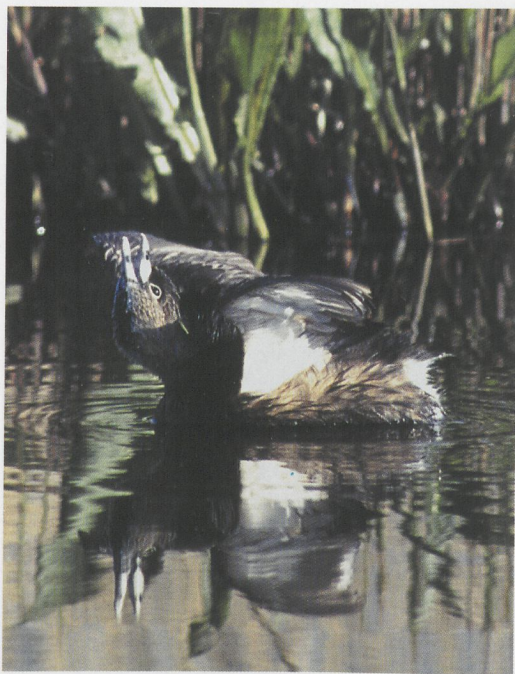
94 Dikbekfuut / Pied-billed Grebe Podilymbus podiceps , Akersloot, Noord-Holland, 21 april 1997 (René van Rossum)

kwestie werd direct teruggevonden en liet zich nog zeer goed bekijken. Van dichtbij (10-15 m) kon een gedetailleerde beschrijving gemaakt worden, waarbij onder andere de witte oogring en de zwarte kin- en keelvlak werden opgemerkt. Rond 21:05 werd de Dikbekfuut door een Meerkoet Fulica atra het riet in gejaagd en kwam daar tijdens de vallende duisternis niet meer uit. Later die avond belde BdH een medewerker van het Noordhollands Landschap om hem in te lichten over de te verwachten invasie van vogelaars op zondag. Even later kwam het bericht op de piepergroepen door (met als onterechte code 'vrij zeker'), met als gevolg dat veel vogelaars besloten de wekker alvast wat vroeger te zetten.