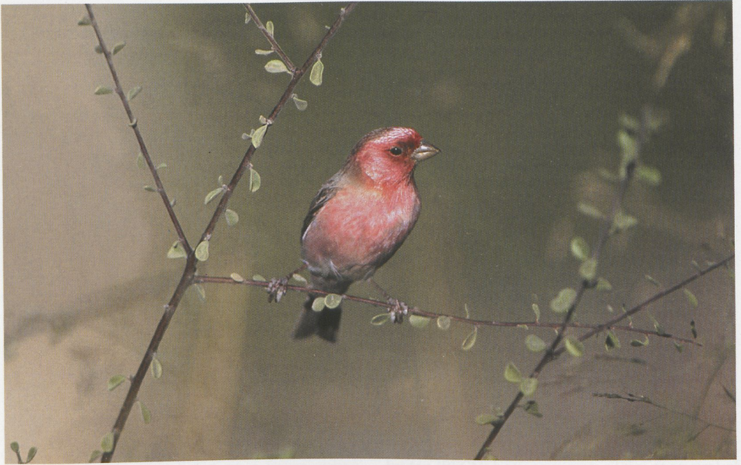
53-54 Sinai Rosefinch / Sinairoodmus Carpodacus synoicus , adult male, Wadi Dana, Jordan, October 1994 (Tim Loseby)