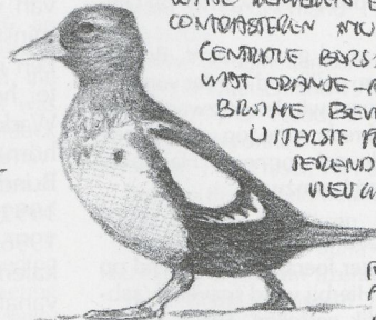
SMEL SWIJDEND OVER HET WOOD

MANTEL EN SCHOUWBLADEN BIJNA VOLLEDIG BIJWIJ, MET UITZONDERING VAN RESTANT VAN DE MANTEL VAN DE BRUKE MANTEL-V. (ZIE ONDER).