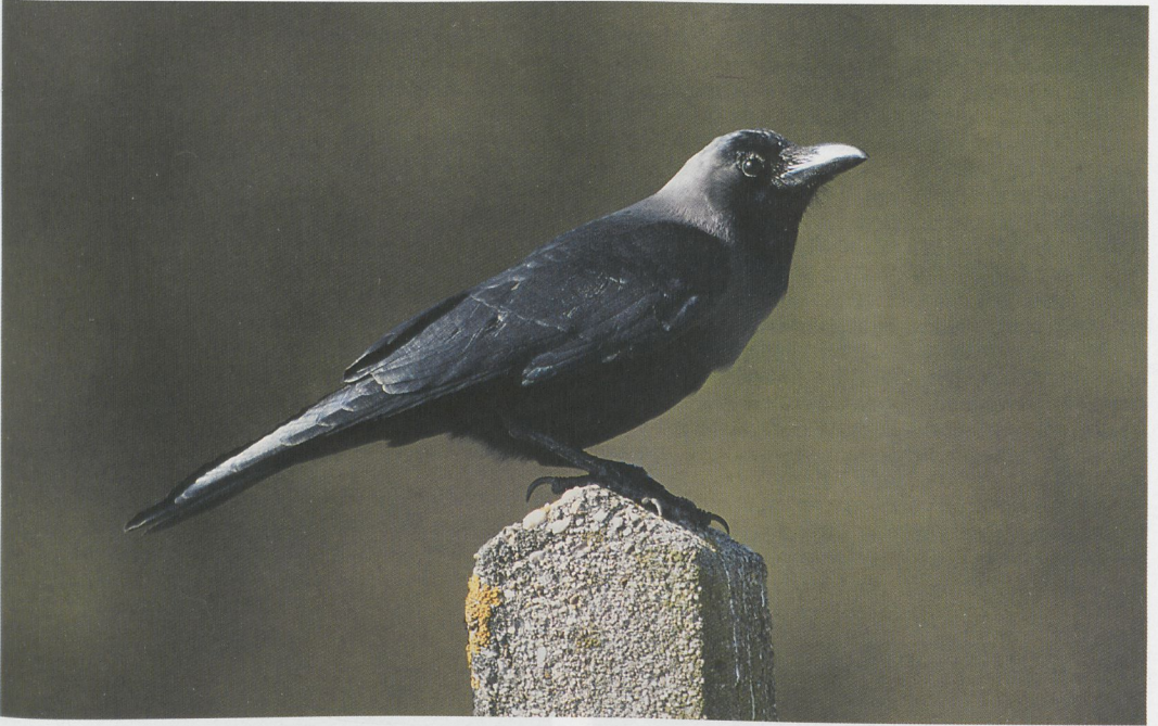
87 Huiskraai / House Crow Corvus splendens , Hoek van Holland, Zuid-Holland, 29 maart 1997 (René van Rossum)