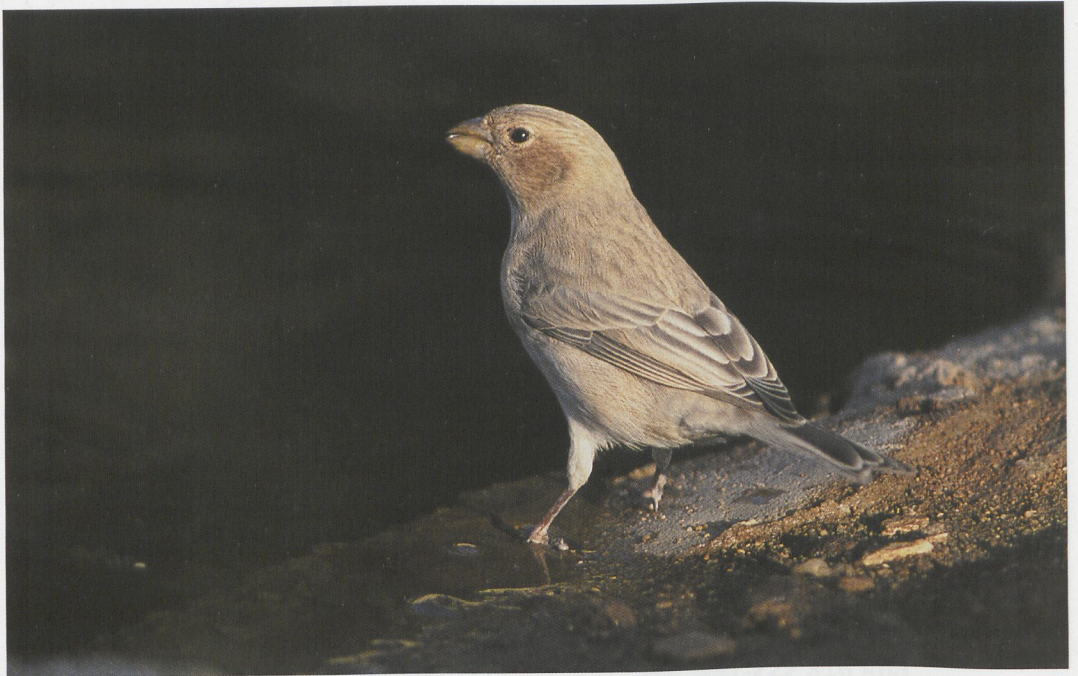
52 Sinai Rosefinch / Sinaiiroodmus Carpodacus synoicus , female, Wadi Dana, Jordan, October 1994