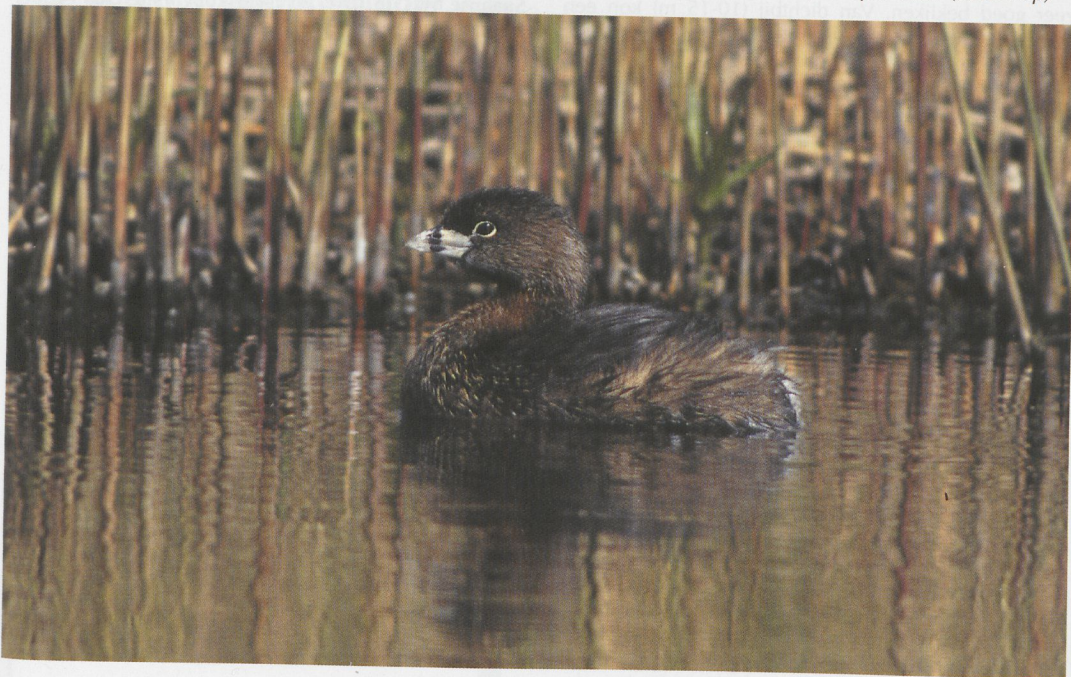
93 Dikbekfuut / Pied-billed Grebe Podilymbus podiceps , Akersloot, Noord-Holland, 21 april 1997

Rond 20:15 belde JW zijn voormalige ZMA-collega C S (Kees) Roselaar in Alkmaar, Noord-Holland, met het nieuws dat hij die middag een Dikbekfuut had gezien en dat hij bij literatuuronderzoek thuis (aan de hand van Vogels nieuw in Nederland (1990) en de laatste zes jaargangen van Dutch Birding) bemerkte had dat dit een nieuwe soort voor Nederland moest zijn. Plannen om die avond terug te gaan om een meer uitvoerige beschrijving te maken konden geen doorgang vinden. Daarom besloot CSR, ondanks de invallende schemering, een vogelaar met een auto te bellen en te bewegen om met hem te gaan zoeken. Nadat hij Klaas Eigenhuis had gebeld om het nieuws te verspreiden vond hij uiteindelijk Bert de Haan bereid om samen met diens zontje Ruben mee te gaan. Om 20:50 waren zij gedrieën ter plekke en hoewel de zon al onder was, was het nog niet erg donker. De vogel in