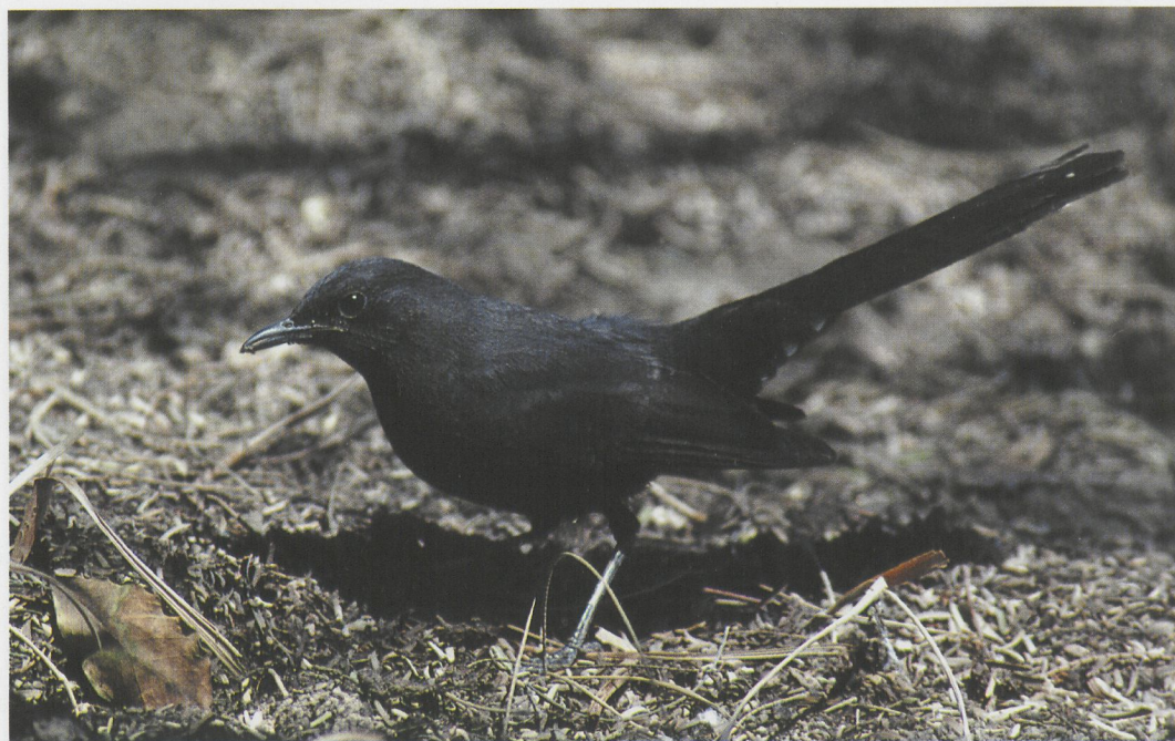
79 Black Scrub-robin / Zwarte Waaiertaart Cercotrichas podobe , Eilat, Israel, 10 April 1997