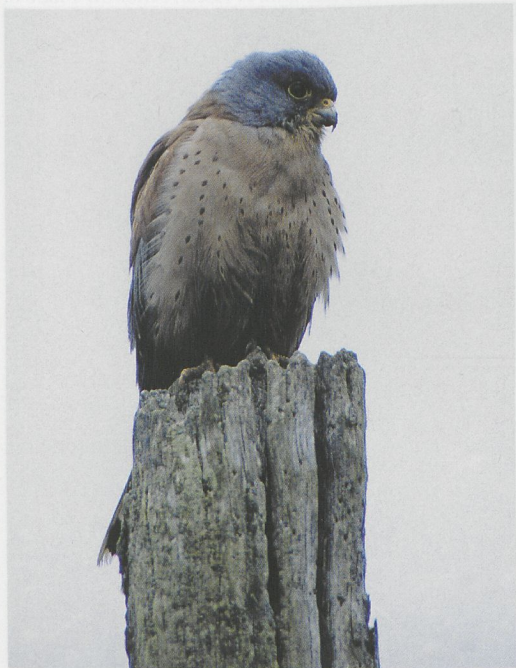
76 Lesser Kestrel / Kleine Torenvalk Falco naumanni , Beuvrequen, Pas-de-Calais, France, 26 March 1997 (Roger Tonnel)