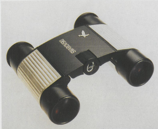
Swarovski 8x20B Century binoculars

Swarovski Benelux have generously agreed to sponsor the event. They have donated a pair of the excellent 8x20B Century binoculars (value NLG 1190). These binoculars of outstanding optical quality have been produced in a small series of only 3000 on the occasion of the 100th anniversary of the Swarovski Group and, undoubtedly, will become a collectors item. These binoculars will be awarded to the overall winner at the end of the competition.