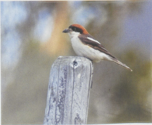
67 Balearische Roodkopklauwier / Balearic Woodchat Shrike Lanius senator badius , Voorhout, Zuid-Holland, 6 juni 1993