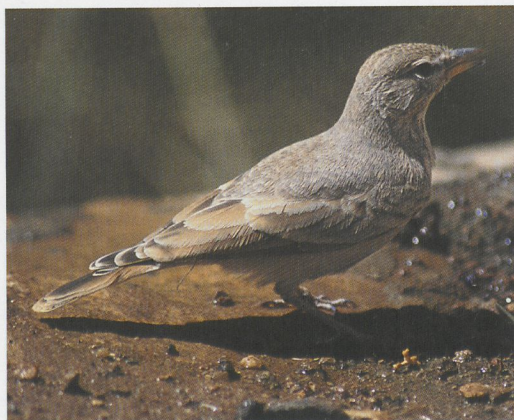
60 Desert Lark / Woestijnleeuwerik Ammomanes deserti , Wadi Dana, Jordan, October 1994