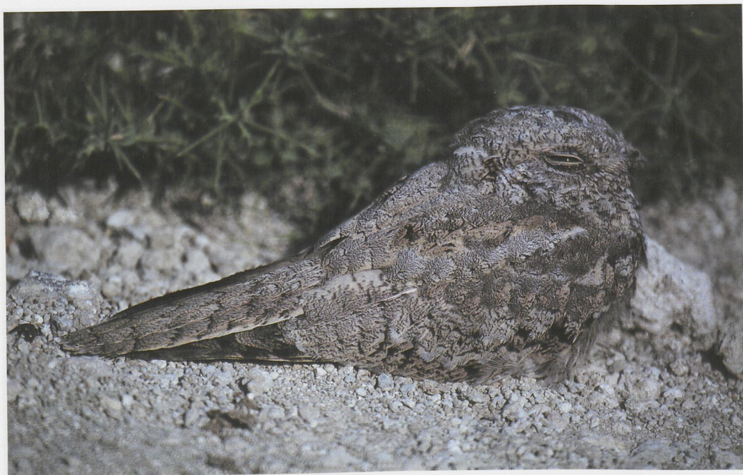
56 Egyptian Nightjar / Egyptische Nachtzwaluw Caprimulgus aegyptius , Azraq, Jordan, 26 July 1991 (Ian J Andrews)