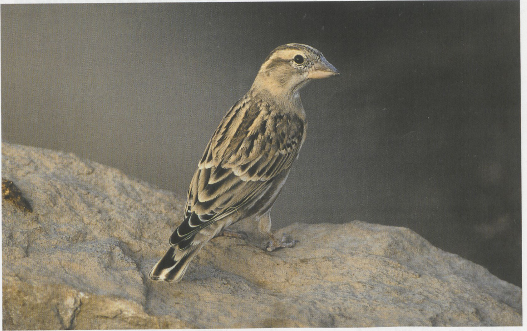
51 Rock Sparrow / Rotsmus Petronia petronia , Wadi Dana, Jordan, October 1994