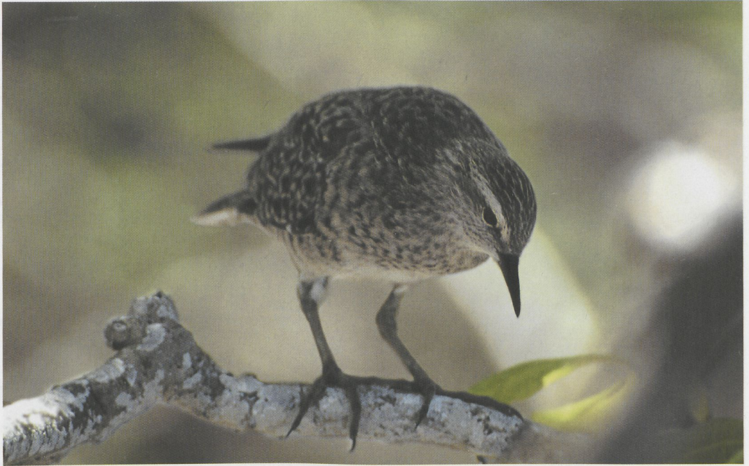
73-74 Tuamotu Sandpiper / Tuamotustrandloper Prosobonia cancellata , Toreatai, Tahanea, Tuamotu Islands, March 1997 (Tini & Jacob Wijpkema)