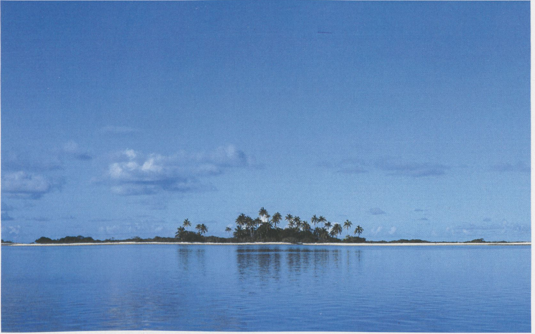
71 Noiokao, Tahanea, Tuamotu Islands, March 1997 (Tini & Jacob Wijkema)