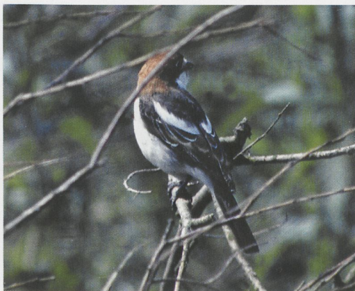
66 Balearische Roodkopklauwier / Balearic Woodchat Shrike Lanius senator badius , Knardijk, Flevoland, 5 juni 1983

BALEARIC WOODCHAT SHRIKE AT KNARDIJK IN JUNE 1983 On 5 June 1983, a female Woodchat Shrike Lanius senator was observed at Knardijk, Flevoland, the Netherlands. In summer 1994, the photographs were checked and it was concluded that the bird was a Balearic Woodchat Shrike L s badius . Identification was based primarily on the absence of a white primary patch and supported by the narrow black band on the forehead and the relatively heavy bill. After resubmis-