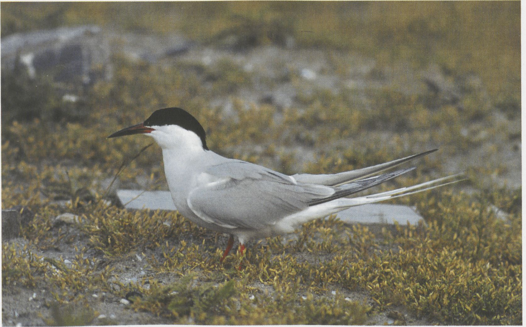
63 Hybride Dougalls Stern x Visdief / hybrid Roseate x Common Tern Sterna dougallii x hirundo , adult, Zeebrugge, West-Vlaanderen, 29 mei 1995 (Filip De Ruwe) 64 Hybride Dougalls Stern x Visdief / hybrid Roseate x Common Tern Sterna dougallii x hirundo , adult, Zeebrugge, West-Vlaanderen, 24 mei 1995 (Filip De Ruwe)