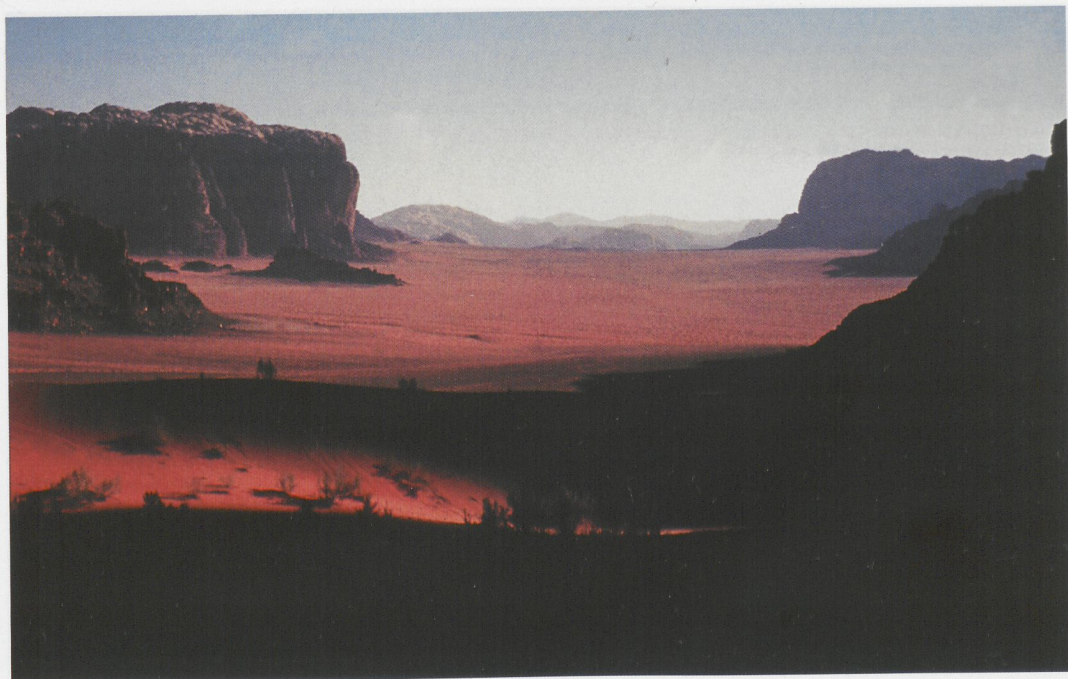
55 Wadi Umm Ishrin, Jordan, at sunset