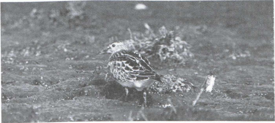
44. Amerikaanse Gestreepte Strandloper/Pectoral Sandpiper Calidris melanotos , Turnhout (Antwerpen), 10 oktober 1979

Op 6 oktober 1979 werd door R. Vermeyen te Turnhout (Antwerpen, België) een Amerikaanse Gestreepte Strandloper Calidris melanotos gedetermineerd. De vogel bleef ter plaatse tot 16 oktober zodat zeer veel veldornithologen, zowel uit België als uit Nederland, in de gelegenheid waren deze dwaalgast te komen observeren. Op 8 oktober werd de vogel geringd.