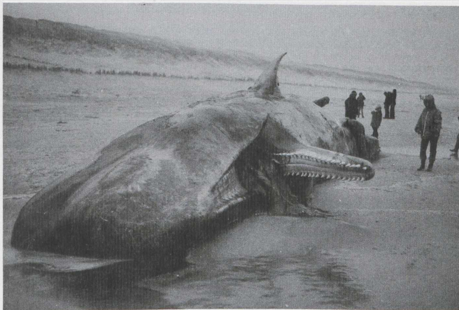
58. Sperm Whale/Potvis Physeter macrocephalus , c. 35 year old male (c. 15 m), between Bakkum and Egmond aan Zee (Noord-Holland), 15 December 1979 (Jan Jaap Brinkman)

Between 15 and 20 December a Common Porpoise/Bruinvis Phocoena phocoena stranded within 10 m from the remains of the Sperm Whale near Bakkum.