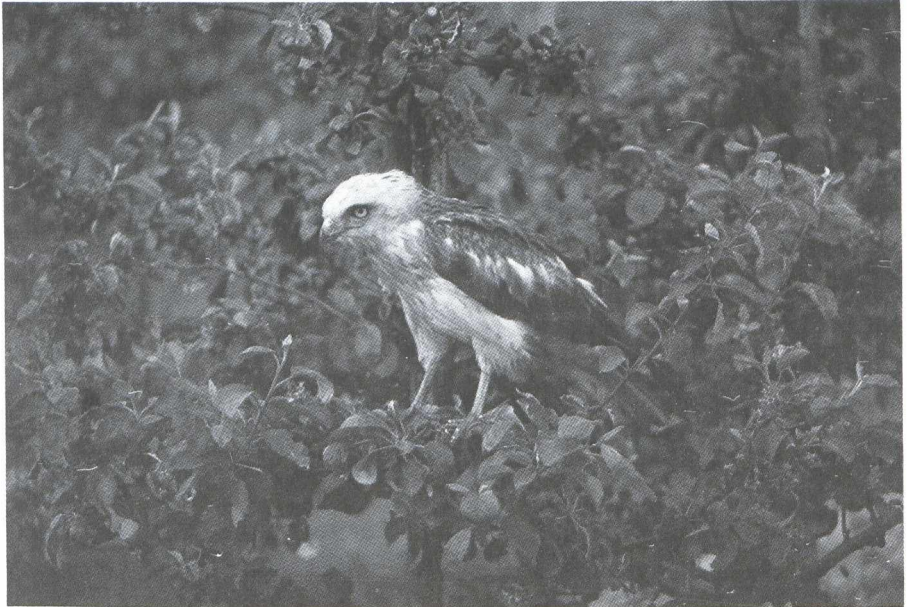
41. Slangenarend/Short-toed Eagle Circaetus gallicus , Wijdenes (NH), 2 juni 1979

Bij onderzoek bleek de vogel broodmager; de darmen waren geheel leeg. Het dier had kennelijk in geen tijden iets gegeten.