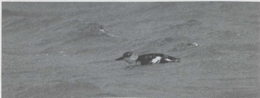
57. Black Guillemot/Zwarte Zeekoet Cepphus grylle , Brouwersdam (Zuid-Holland), 22 December 1979