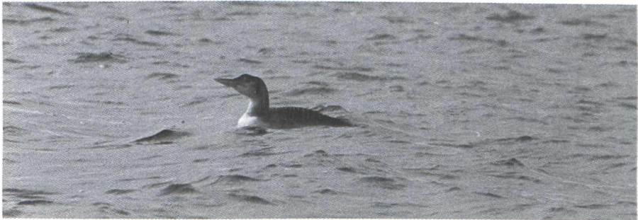
38. Geelsnavelduiker/White-billed Diver Gavia adamsii , tweede kalenderjaar, Kornwerderzand (F), 24-28 februari 1979

Zeker 13 gevallen hebben betrekking op vogels in eerste winterkleed. Dit in tegenstelling tot Groot-Brittannië waar van de tot en met 1973 vastgestelde gevallen (39 in totaal) slechts twee op jonge vogels betrekking hadden (Burn & Mather 1974). Dit zou erop kunnen wijzen dat eerste- en ouderejaars Geelsnavelduikers verschillende overwinteringsgebieden hebben. De meeste Britse