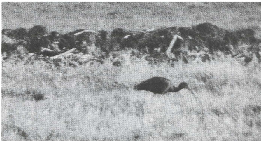
53. Glossy Ibis/Zwarte Ibis Plegadis falcinellus , Ouderkerk aan de Amstel (Noord-Holland), 20 November 1979 (Arnoud van den Berg)