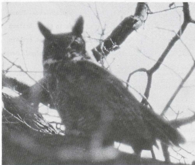
43. Amerikaanse Oehoe/Great Horned Owl Bubo virginianus , Waterland, Velsen (NH), april 1976 (Jan Mulder)

Vanaf 1973 of 1974 bevindt zich een mannetje Amerikaanse Oehoe Bubo virginianus op het landgoed 'Waterland' bij Velsen (NH) (cf. van den Berg 1979). Omdat ik meer over zijn herkomst wilde weten, heb ik bij alle voor het publiek toegankelijke dierentuinen en vogelparken geïnformeerd of het wel eens was voorgekomen dat een Amerikaanse Oehoe uit hun collectie was ontsnapt. De meeste antwoorden dat dit nooit was gebeurd. Een uitzondering vormde het dierenpark te Wassenaar (ZH). In de zomer van 1972 is hier namelijk een Amerikaanse Oehoe ontsnapt. De vogel is nog enige dagen in de bomen van het dierenpark waargenomen; daarna is hij niet meer gezien. Het lijkt mij heel goed mogelijk dat dit de Amerikaanse Oehoe is die zich bij Velsen bevindt. Tot dusver werd algemeen aangenomen dat de betrokken vogel een wild exemplaar was dat met een schip uit Noord-Amerika was meegekomen (cf. van den Berg l.c.).