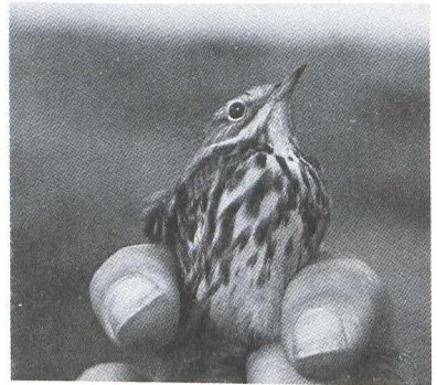
50. Red-throated Pipit Anthus cervinus , Ringstation Castricum, Castricum (Noord-Holland), 28 September 1979

The identification of Red-throated Pipit in non-breeding plumage is far more difficult than generally realised. This is mainly due to the great variability of Meadow Pipit. In the course of 10 years I trapped and handled Meadow Pipits with: heavily streaked upperparts; creamy V-marks on mantle; streaked rump; heavily streaked underparts; streaked under tail-coverts; wing-length corresponding to the largest Tree Pipit Anthus trivialis ; and wing formula well inside that of Red-throated Pipit (there seems to be a tendency for the wing formula to resemble that of Red-throated Pipit more closely as the wing length increases).