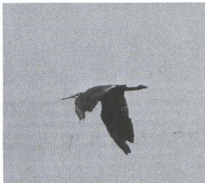
40. Westelijke Rifeiger/Western Reef Heron Egretta gularis , Camargue, Frankrijk, 27 juli 1979 (Karel Mauw)