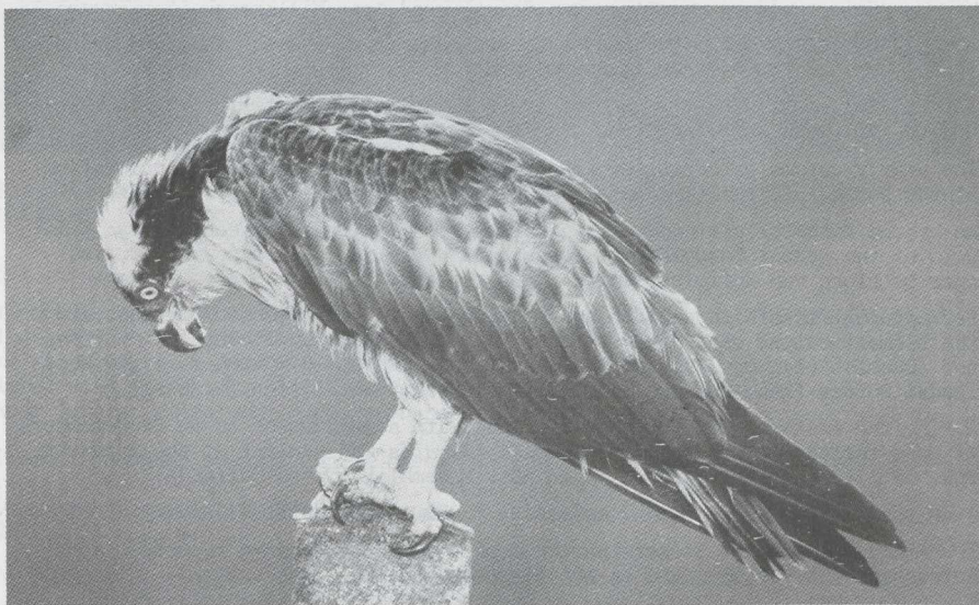
54. Osprey/Visarend Pandion haliaetus , Oostelijk Flevoland (Zuidelijke IJsselmeerpolders), 1 January 1980

There were several records of late Ospreys/Visarenden Pandion haliaetus : on 11 November at Waddenoijen (Gelderland), on 24 November at the Wieringermeer (Noord-Holland), in the beginning of December near De Plaat van Scheelhoek, Goeree (Zuid-Holland) and on 5 January at the Haringvlietdam (Zuid-Holland). Until 5 January one stayed in Oostelijk Flevoland; on that day it was trapped and brought in a bad condition to a bird hospital in Gorsseel (Gelderland).