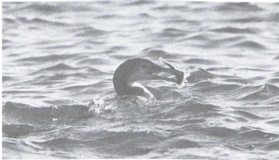
51. Raadselvogel 3/Mystery bird 3. Oplossing in het volgende nummer/Solution in the next issue

Gerald J. Oreel, Postbus 51273, 1007 EG Amsterdam