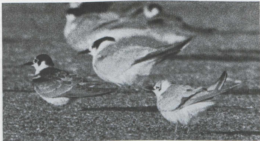
56. Adult White-winged Black Tern/Witvleugelstern Chlidonias leucopterus (right), Common Tern/Visdief Sterna hirundo (middle), juvenile Black Tern/Zwarte Stern Chlidonias niger (left), Zuidelijk Flevoland (Zuidelijke IJsselmeerpolders), 22 September 1979 ( Jan Prins )