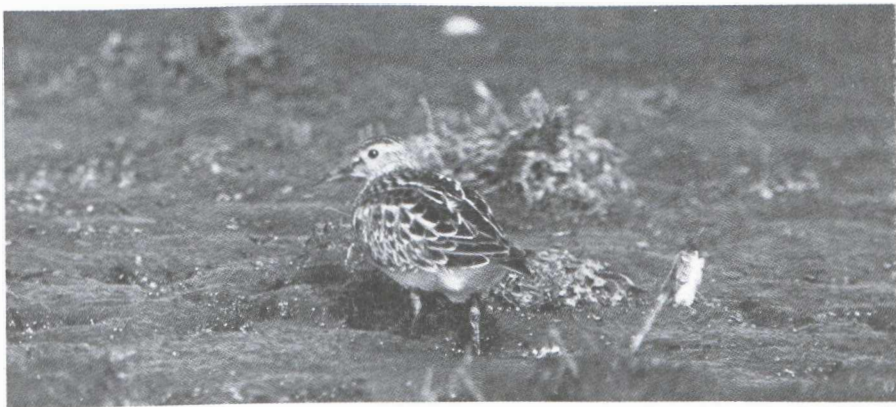
44. Amerikaanse Gestreepte Strandloper/Pectoral Sandpiper Calidris melanotos , Turnhout (Antwerpen), 10 oktober 1979 (Marc Sloomackers BVNF)

Op 6 oktober 1979 werd door R. Vermeyen te Turnhout (Antwerpen, België) een Amerikaanse Gestreepte Strandloper Calidris melanotos gedetermineerd. De vogel bleef ter plaatse tot 16 oktober zodat zeer veel veldornithologen, zowel uit België als uit Nederland, in de gelegenheid waren deze dwaalgast te komen observeren. Op 8 oktober werd de vogel geringd.