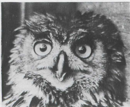
Fig. 28 Oehoe/Eagle Owl Bubo bubo gevangen/captured Donkere Duinen, Den Helder (NH) 24 oktober 1973 (W. Groen)