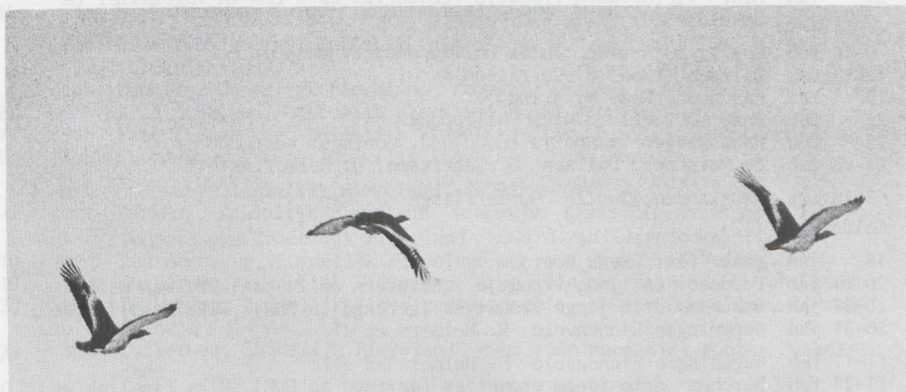
Fig. 24 Grote Trap/Great Bustard Otis tarda De Vaart, Zuidelijk Flevoland (ZIJP) januari 1979 ( Ulco Glimmerveen )

In de winter van 1978/79 bezocht een groot aantal Grote Trappen Otis tarda Nederland. De eerste waarnemingen waren op 6 januari en de laatste waarneming was op 2 april. Er zijn mogelijk 108 verschillende vogels vastgesteld. Dit aantal ligt aanzienlijk boven dat van de laatste grote invasie in de winter van 1969/1970 toen mogelijk 34 verschillende exemplaren werden vastgesteld (cf. Tekke 1971). In België werden slechts drie Grote Trappen waargenomen. Hier was de soort sedert de winter van 1962/63 overigens niet meer vastgesteld (Paul Herroelen pers.med. ).