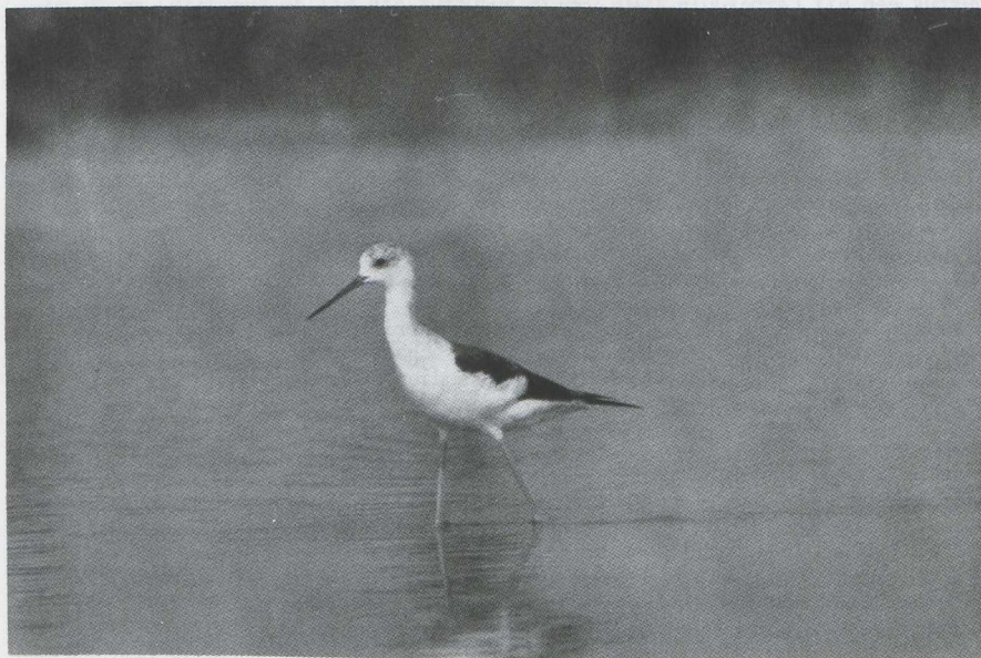
Fig. 36 Steltkluut/Black-winged Stilt Himantopus himantopus Kraanvogelweg, Zuidelijk Flevoland (ZIJP) 28 juli 1979

Van 5 tot en met 8 juli bevond zich een onvolwassen Kraanvogel/Crane Grus grus in de omgeving van Antwerpen (Antwerpen, België).