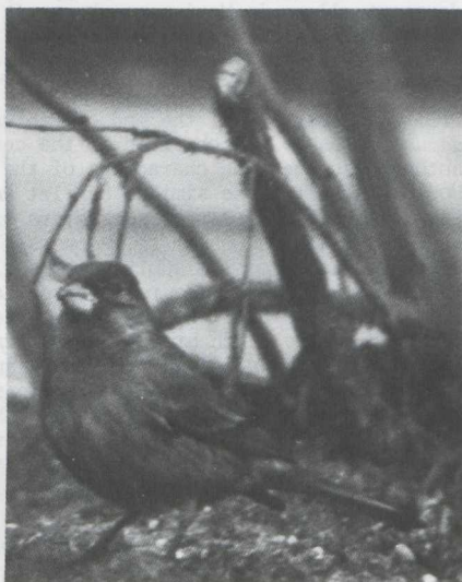
Fig.34 Mexicaanse Roodmus/House Finch Carpodacus mexicanus Lange Nieuwstraat, 35 IJmuiden (NH) 4 februari 1979 (Henk van der Pol)

De Mexicaanse Roodmus broedt in westelijk Noord-Amerika en zijn verspreidingsgebied strekt zich uit van British Columbia (Canada) in het noorden tot Oaxaca (Mexico) in het zuiden. De soort is in 1940 op Long Island (New York) ingevoerd. Sindsdien heeft hij zich van hieruit sterk uitgebreid en is hij in New York en andere staten in het oosten van de USA een algemene vogel geworden (Bock & Lepthien 1976, Bull 1964, Elliott & Arbib 1953). Bull (1964) noemt hem een "attractive addition to our avifauna" en een "melodious, tame and very adaptive species". Er zij op gewezen dat de in het oosten van de USA broedende Mexicaanse Roodmussen tot de ondersoort C. m. frontalis behoren ( American Ornithologists' Union 1957).