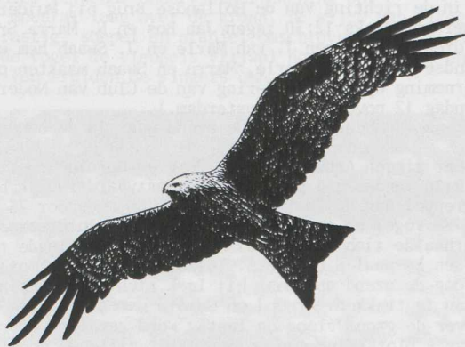
Zwarte Wouw/Black Kite Milvus migrans (Eric van Ommen)

" Dutch Birding zal ongetwijfeld in een behoefte voorzien. Het is jammer dat echter geen samenwerking met de NOU bestaat omdat deze uitgave wellicht Limosa concurrentie aan kan doen. In elk geval zullen de kundige medewerkers voor een goede inhoud van het blad borg kunnen staan. Overigens hopen wij op een goede samenwerking en wensen jullie veel succes."