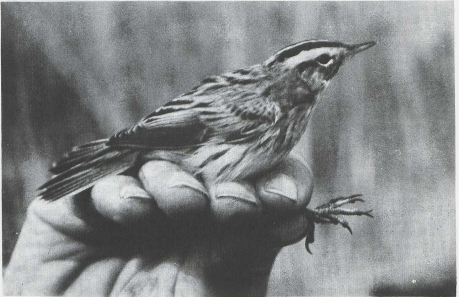
Fig. 32 Raadselvogel 2/Mystery bird 2

Kees (C.) S. Roselaar, Stuartstraat 105, 1815 BR Alkmaar