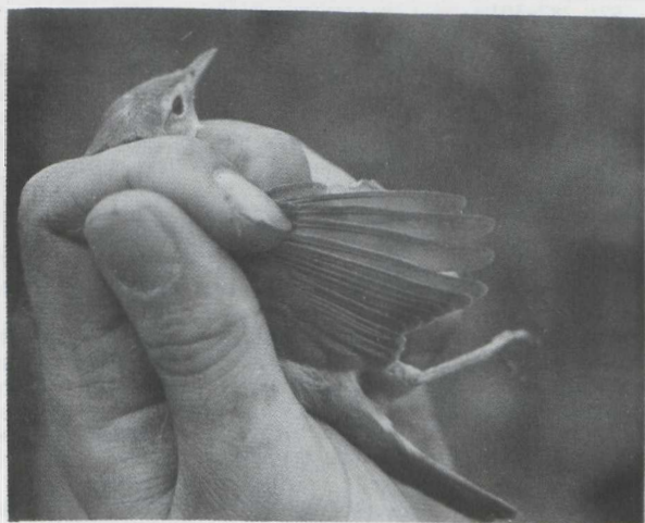
Fig. 33 Orpheusspotvogel/ Melodious Warbler Hippolais polyglotta Oostvaardersdijk, Zuidelijk Flevoland (ZIJP) 2 september 1979

De Orpheusspotvogel heeft dus een kortere en vooral meer afgeronde vleugel dan de Spotvogel. Beide kenmerken zijn ook als veldkenmerk bruikbaar (cf. Wallace 1964). In het leefnet liet de vogel een roep horen die veel leek op de 'tjerr'-roep van de Winterkoning Troglodytes troglodytes . Een dergelijke roep is mij