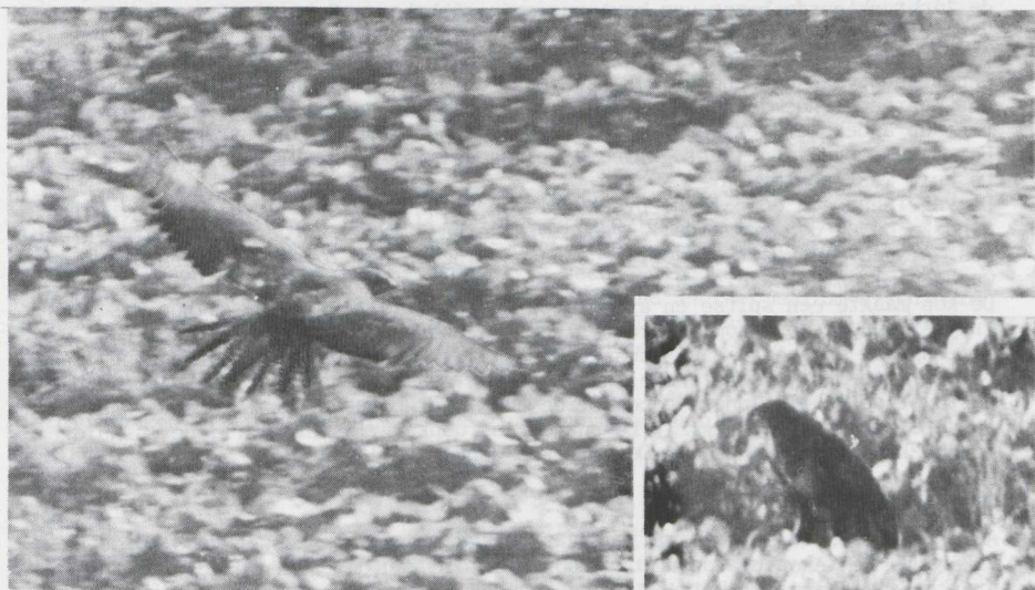
Fig. 23 Havikarend/Bonelli's Eagle Hieraetus fasciatus Oostvaardersdijk, Zuidelijk Flevoland (ZIJP) 7 november 1978

De vogel vloog meestal laag over de grond. De wijze van vliegen werd als krachtig, roeiend, rustig, soepel en stabiel omschreven. Hij zeilde zo nu en dan. Hierbij hield de vogel de vleugels vrijwel horizontaal, af en toe iets omlaag. Tijdens het zeilen krulden de vingers omhoog.