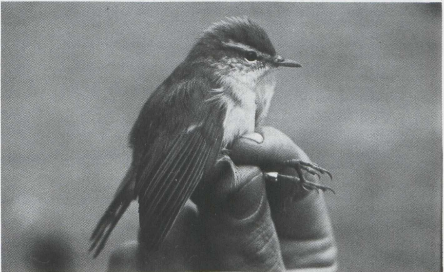
Fig. 37 Grauwe Fitis/Greenish Warbler Phylloscopus trochiloides eerste kalenderjaar vogel/first calendar year bird Castricum (NH) 11 augustus 1979 (Cock Reijnders)

De Cettis Zanger/Cetti's Warbler Cettia cetti ging dit jaar sterk achteruit en werd nog slechts op vijf plaatsen waargenomen: in de Carnisse Grienden bij IJsselmonde (ZH), bij de Steurgatsluis te Werkendam (NB), in de Braakman (Z), in Het Zwin (Z) en bij het grindgat bij Eijsden (L).