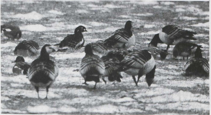
Fig. 22 Roodhalsgans/Red-breasted Goose Branta ruficollis tussen/among Brandganzen/Barnacle Geese Branta leucopsis en/and Smienten/Wigeons Anas penelope Serooskerke (Z) 18 februari 1979