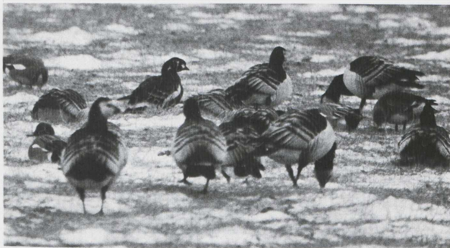
Fig. 22 Roodhalsgans/Red-breasted Goose Branta ruficollis tussen/among Brandganzen/Barnacle Geese Branta leucopsis en/and Smienten/Wigeons Anas penelope Serooskerke (Z) 18 februari 1979