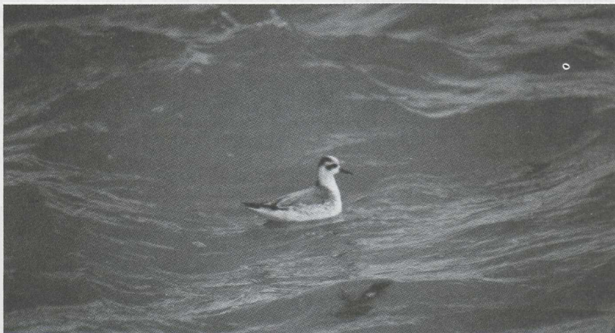
55. Grey Phalarope/Rosse Franjepoot Phalaropus fulicarius , Scheveningen (Zuid-Holland), January 1980

8 Jan Scheveningen (Zuid-Holland) 1 until 10 Jan