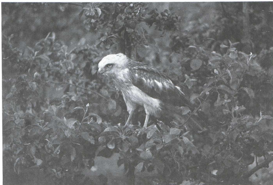
41. Slangenarend/Short-toed Eagle Circaetus gallicus , Wijdenes (NH), 2 juni 1979

Bij onderzoek bleek de vogel broodmager; de darmen waren geheel leeg. Het dier had kennelijk in geen tijden iets gegeten.