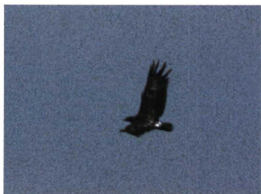
241 Bastaardarend / Spotted Eagle Aquila clanga , Lauwersmeer, Groningen, 29 augustus 1997 (Eric Koops)

van de vogel. Deze 'zwarte' kleur was met name te vinden op de kleine en middelste dekveren op zowel de boven- als de ondervleugel. Deze veerpartijen contrasteerden niet zichtbaar met de slagpennen en waren in geen geval lichter. Dit kenmerk is diagnostisch voor Bastaardarend (Forsman 1991, 1993, 1999, Harris et al 1996, Génsbøl 1997). Bij Schreeuwarend zijn de kleine en middelste dekveren altijd lichter dan de slagpennen, al is dat in het veld niet altijd goed te zien. Deze veren zijn bovendien duidelijk bruin van kleur en niet zwartachtig. Alleen een volwassen zwaar gesleten Bastaardarend heeft eventueel lichtere dekveren dan slagpennen.