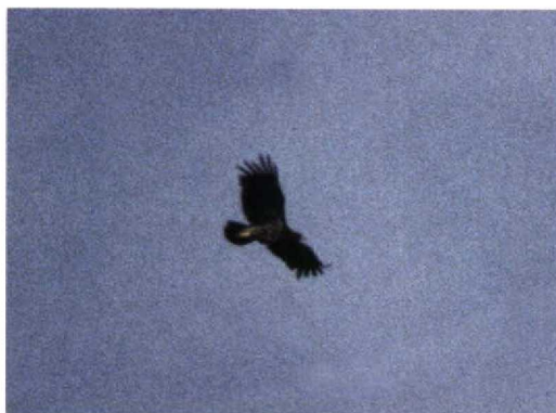
240 Bastaardarend / Spotted Eagle Aquila clanga , Lauwersmeer, Groningen, 29 augustus 1997