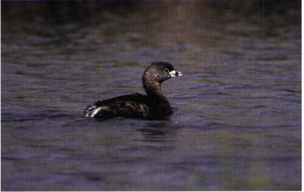
233-234 Dikbekfuut / Pied-billed Grebe Podilymbus podiceps , Akersloot, Noord-Holland, 21 april 1997 (René Pop)