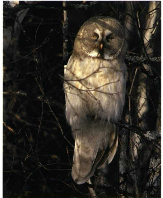
249-250 Leucistic Great Grey Owl / Laplanduil Strix nebulosa , Oulu, Finland, March 1998 (Jari Peltomäki)