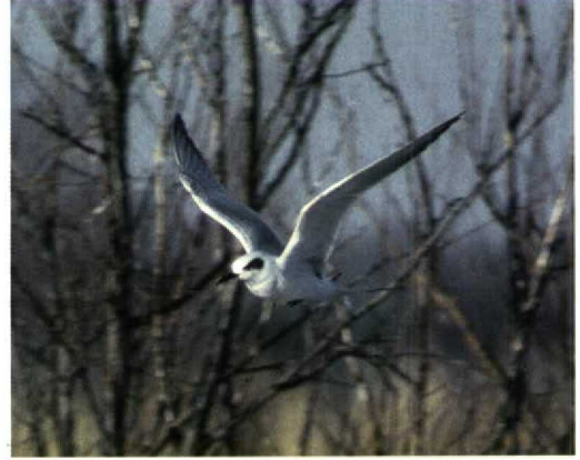
242-243 Forsters Stern / Forster's Tern Sterna forsteri , eerste-winter, Kinderdijk, Zuid-Holland, 5 januari 1995

grijs, lichter dan vleugel. Onderdelen wit. VLEUGEL Dekveren, hand- en armpennen grijs getekend. Tertiaals met donker centrum. STAART Buitenste pennen donker, kleur overige pennen lichtgrijs.