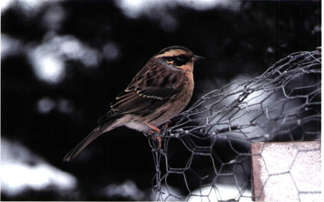
265 Siberian Accentor / Bergheggenmus Prunella montanella , Kerava, Helsinki, Finland, December 1998 (Markku Rantala & Kari Eischer)