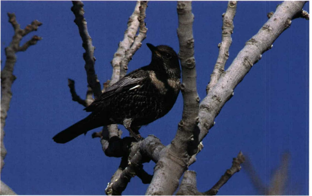
263 Ring Ouzel / Beflijster Turdus torquatus , Dana, Jordan, 6 December 1998 (René Pop)