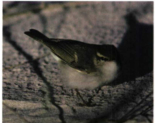
246 Noordse Boszanger / Arctic Warbler Phylloscopus borealis , Terschelling, Friesland, 2 oktober 1996

GEDRAG Veel bewegend op duinzand. Soms omhoog kruipend in helm. Wanneer vliegend, dan slechts over korte afstand, en laag blijvend. Benaderbaar tot op 1 m. Tijdens bewegen vaak omhoog kijkend en soms staart omhoog houdend.