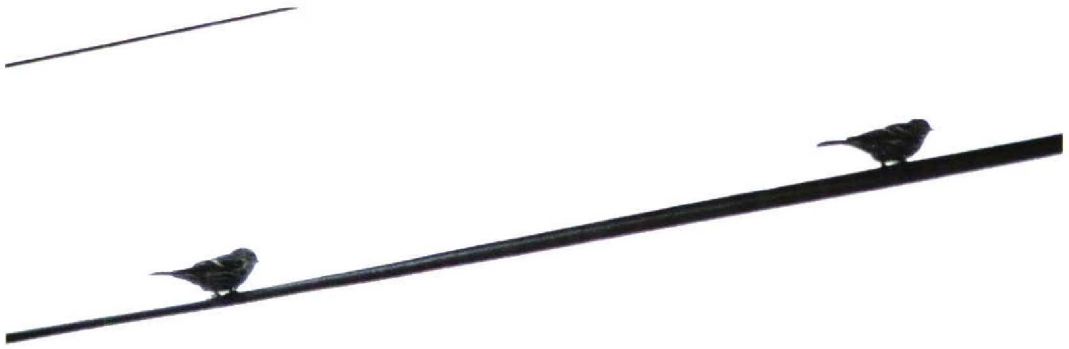
223 NW Redpoll / NW-Barmsijs Carduelis flammea rostrata/islandica and Common Chaffinch / Vink Fringilla coelebs in profile, Donegal, Ireland, September 1997. Both birds at same distance from camera! Shows striking size and bulk of many NW Redpolls

the end of September but in late October there was a smaller secondary arrival. Sightings were again daily between 19 and 28 October, with a peak of at least four on 21 October. During September, almost all redpolls present on Fair Isle were NW Redpolls. There were no sightings of Mealy Redpolls during the month but up to two Lesser Redpolls were seen. The situation was more complex in October when Mealy, Lesser and NW Redpolls were all present on some days. At this time, a few redpolls were not identified to taxon.