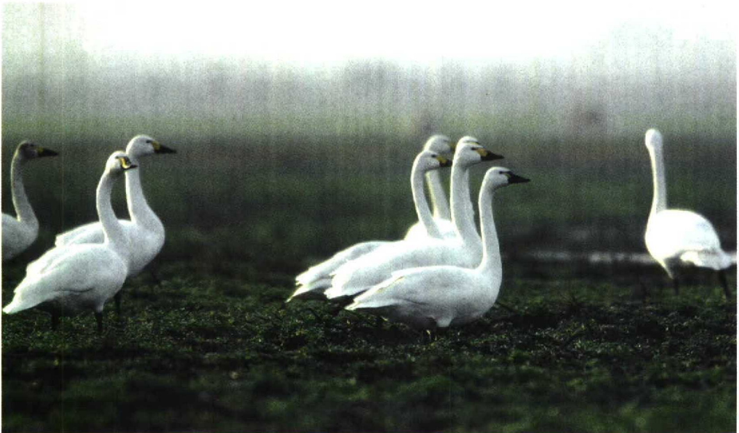
238 Fluitzwaan / Whistling Swan Cygnus columbianus met Kleine Zwanen / Bewick's Swans C bewickii , Anloo, Drenthe, december 1997 (Jan van Holten)

Vanaf het begin was duidelijk dat bij de determinatie slechts twee soorten in aanmerking kwamen: Kleine Zwaan of Fluitzwaan. Trompetzwaan C buccinator (uit Noord-Amerika en nooit in Europa vastgesteld) is groter met een veel grotere snavel zonder geel; Wilde Zwaan is eveneens groter en heeft veel meer geel op de snavel (Königstedt & Barthel 1995). De hoeveelheid geel op de snavel is in feite het enige betrouwbare kenmerk om Fluitzwaan van Kleine Zwaan te onderscheiden (Evans & Sladen 1980, Patten & Heindel 1994). Het is echter een moeilijk ken-