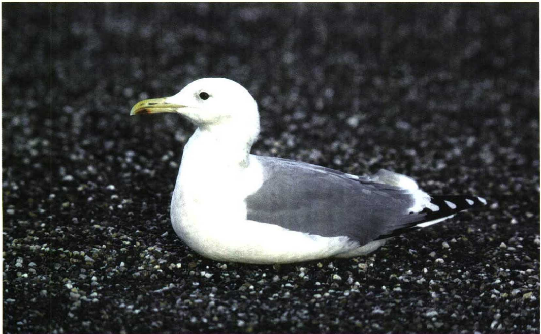
274 Pontische Meeuw / Pontic Gull Larus cachinnans cachinnans , adult, Brouwersdam, Zuid-Holland, 26 oktober 1998 (Norman van Swelm)