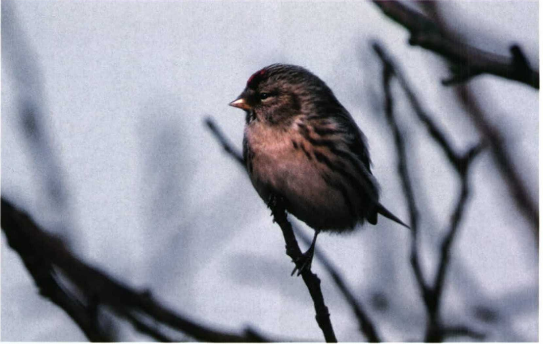
231 Grote Barmsijs / Mealy Redpoll Carduelis flammea flammea , Pampushaven, Almere, Flevoland, Netherlands, 23 January 1989 (Arnoud B van den Berg)