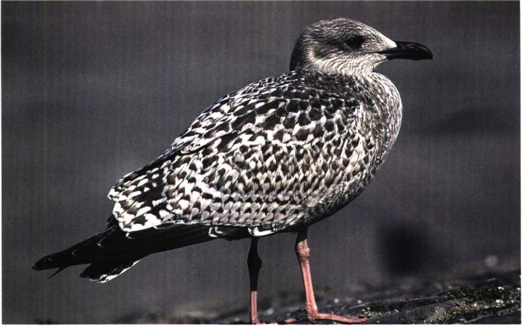
252 Herring Gull / Zilvermeeuw Larus argentatus , juvenile, Scheveningen, Zuid-Holland, Netherlands, 17 August 1997