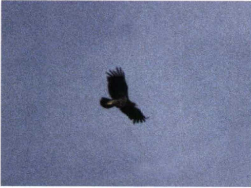
240 Bastaardarend / Spotted Eagle Aquila clanga , Lauwersmeer, Groningen, 29 augustus 1997 (Jaap van 't Hof)