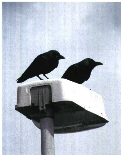
247 Huiskraai / House Crow Corvus splendens , eerstejaars, Hoek van Holland, Zuid-Holland, 6 september 1997 248 Huiskraaien / House Crows Corvus splendens , adult (rechts) en juveniel, Hoek van Holland, Zuid-Holland, 23 juli 1998

Ebels & Westerlaken 1996). De jonge vogels betekenden de vierde en vijfde Huiskraai voor Nederland en zijn als zodanig door de Commissie Dwaalgasten Nederlandse Avifauna (CDNA) aanvaard. Het dichtstbijzijnde broedgebied bevindt zich te Suez, Egypte (Madge & Burn 1993).