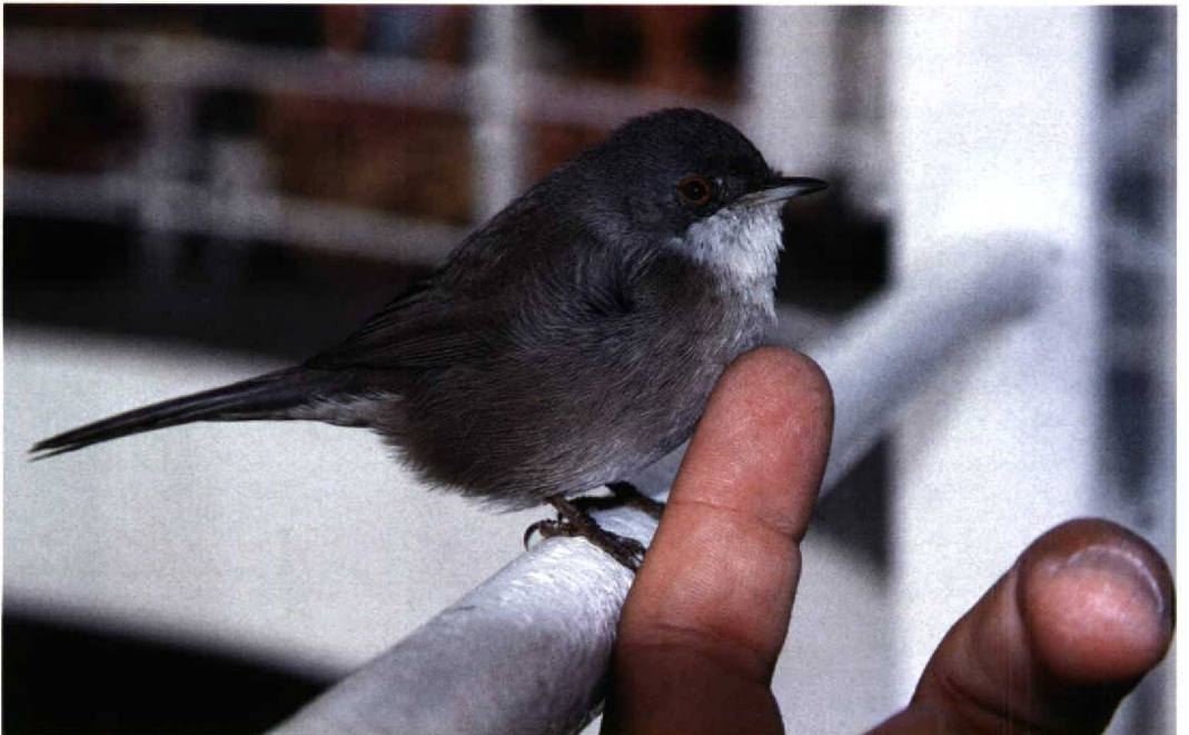
264 Sardinian Warbler / Kleine Zwartkop Sylvia melanocephala , Atlantic Ocean, off Morocco, 28 October 1998