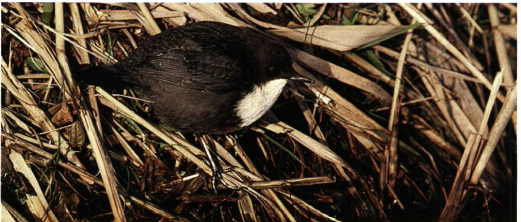
275 Waterspreeuw / Dipper Cinclus cinclus , Mariëndal, Den Helder, Noord-Holland, 21 november 1998

BIJENETERS TOT GORZEN Op 3 oktober werd een overvliegende Bijeneter Merops apiaster gemeld van de Maasvlakte. De Hop Upupa epops van Alkmaar, Noord-Holland, bleef daar tot 5 oktober. Op 6 oktober vloog er één langs het Westduinpark. Draaihalzen Jynx torquilla werden gezien op 10 oktober bij Den Oever en op 11 oktober op Vlieland, Friesland. Er was een melding van een Kortteenleeuwerik Calandrella brachydactyla op 13 oktober op de Slikken van de Heen, Noord-Brabant. 29 Grote Piepers Anthus richardi werden geteld tot 14 november maar voornamelijk in de eerste twee decaden van oktober. Hieronder bevonden zich zeven op 9 oktober ter plaatse bij Hoek van Holland, Zuid-Holland, en vijf tussen 31 oktober en 2