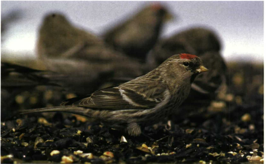
232 Grote Barmsijs / Mealy Redpoll Carduelis flammea flammea , Tomkins County, New York, USA, 14 March 1998