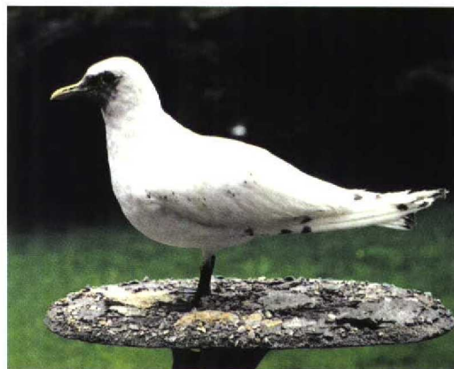
236 Ivoormeeuw / Ivory Gull Pagophila eburnea , eerste-zomer, Sankt Peter-Ording, Schleswig-Holstein, Duitsland, 24 mei 1997 (Detlef Gruber) 237 Ivoormeeuw / Ivory Gull Pagophila eburnea , eerste-zomer (dood gevonden te Langeneß, Schleswig-Holstein, Duitsland, 9 juni 1997), Ludwig Nissen-Haus, Husum, Schleswig-Holstein, Duitsland, 28 augustus 1998 (Marc Argeloo)

de zwarte poten en het formaat als een gedrongen zware Stormmeeuw met de brede, spits toelopende vleugels past uitsluitend op een onvolwassen Ivoormeeuw. De zwarte vlekjes in het verenkleed en de donkere vlek op de kop wijzen op een tweede-kalenderjaarvogel. Het vrijwel ontbreken van zwarte vlekjes op het lichaam duidt op een vogel in eerste zomerkleed (Grant 1982, Cramp & Simmons 1983). De kop was nog erg donker en mogelijk moest de kopruï van eerste winterkleed naar eerste zomerkleed nog worden voltooid (cf Grant 1982). Het ontbreken van één of twee staartpennen in het midden van de staart zou kunnen duiden op rui van eerste zomerkleed naar tweede winterkleed (Grant 1982, Cramp & Simmons 1983).