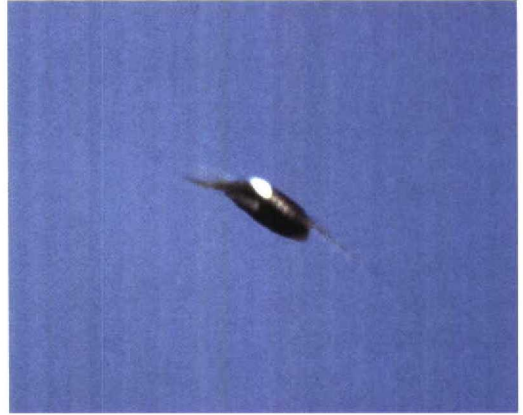
244 Nest occupied by White-rumped Swift / Kaffergierzwaluw Apus caffer nestlings, Mina de São Domingos, Alentejo, Portugal, 30 July 1995 (C C Moore). Nest presumed to be originally that of Red-rumped Swallow Hirundo daurica 245 White-rumped Swift / Kaffergierzwaluw Apus caffer , Mina de São Domingos, Alentejo, Portugal, 30 July 1995 (C C Moore)

to the nest immediately elicited 30 seconds of whinnying nestling sounds, not unlike nestlings of Lesser Kestrel Falco naumanni . Unfortunately, the area was not visited again until November, when no birds were seen. In 1996 and 1997, a pair nested again, once at the original site and once c 500 m away, again in similar circumstances and again apparently arriving late at the breeding site. On 4 October 1997, two birds in presumed juvenile plumage (faintly frosted tips of remiges, duller black plumage and a more conspicuously pale chin, compared with the blue-black plumage, fully black primaries and duller chin patch of adults) were seen nearby.