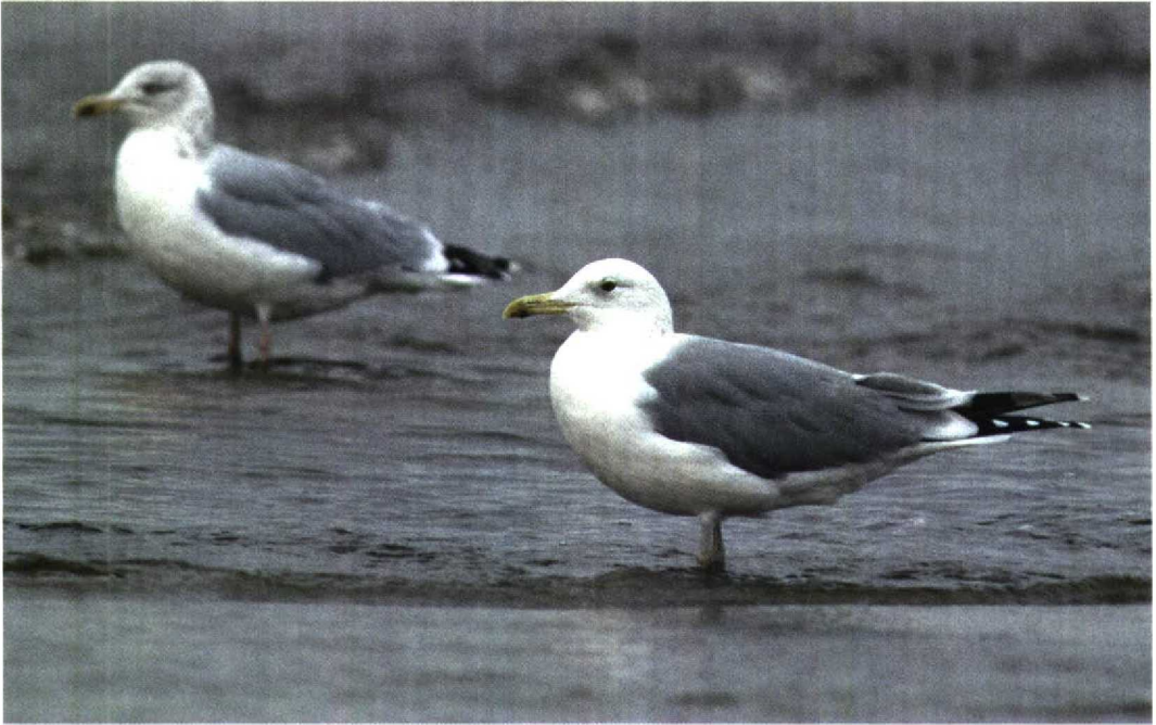
273 Pontische Meeuw / Pontic Gull Larus cachinnans cachinnans , adult (rechts) en Zilvermeeuw / Herring Gull L. argentatus , adult, Katwijk aan Zee, Zuid-Holland, 7 november 1998