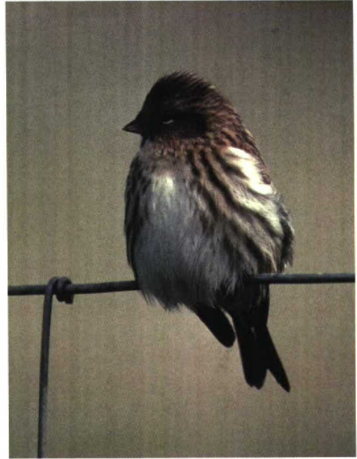
229 NW Redpoll / NW-Barmsijs Carduelis flammæ rostrata/islandica (left) and Lesser Redpoll / Kleine Barmsijs C. cabaret , Fair Isle, Shetland, Scotland, October 1997 (Roger Riddington) 230 NW Redpoll / NW-Barmsijs Carduelis flammæ rostrata/islandica , Fair Isle, Shetland, Scotland, September 1989 (Tim Loseby)

However, this feature is too variable to be an important identification character on its own.