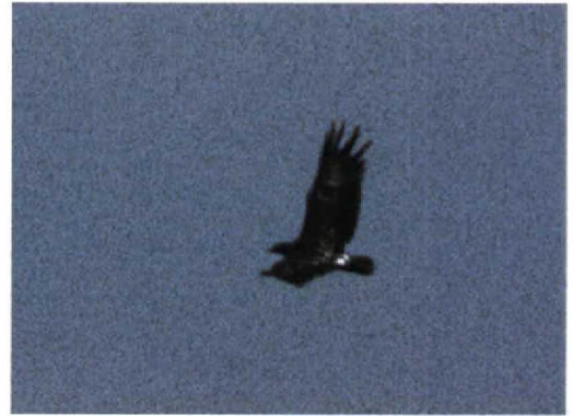
241 Bastaardarend / Spotted Eagle Aquila clanga , Lauwersmeer, Groningen, 29 augustus 1997 (Eric Koops)

van de vogel. Deze 'zwarte' kleur was met name te vinden op de kleine en middelste dekveren op zowel de boven- als de ondervleugel. Deze veerpartijen contrasteerden niet zichtbaar met de slagpennen en waren in geen geval lichter. Dit kenmerk is diagnostisch voor Bastaardarend (Forsman 1991, 1993, 1999, Harris et al 1996, Génsbøl 1997). Bij Schreeuwarend zijn de kleine en middelste dekveren altijd lichter dan de slagpennen, al is dat in het veld niet altijd goed te zien. Deze veren zijn bovendien duidelijk bruin van kleur en niet zwartachtig. Alleen een volwassen zwaar gesleten Bastaardarend heeft eventueel lichtere dekveren dan slagpennen.