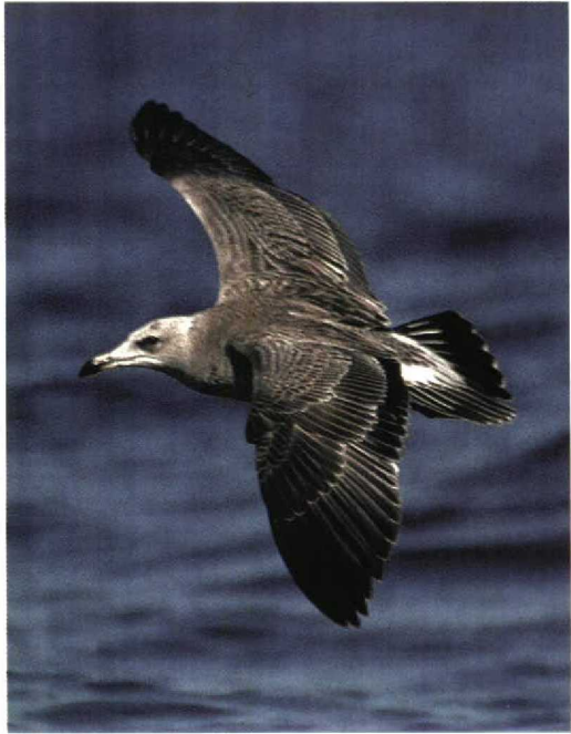
254 Red-flanked Bluetail / Blauwstaart Tarsiger cyanurus , adult female, Llobregat delta, Catalunya, Spain, 17 November 1998 ( Ricard Gutiérrez ) 255 Audouin's Gull / Audouins Meeuw Larus audouinii , first-winter, Lac Léman, Switzerland, 9 September 1998 ( Lionel Maumary ) 256 Rose-breasted Grosbeak / Roodborstkardinaal Pheucticus ludovicianus , first-winter male, Bryher, Scilly, England, October 1998 ( Nigel Bean ) 257 American Robin / Roodborstlijster Turdus migratorius , first-winter male, St Agnes, Scilly, England, October 1998 ( Nigel Bean )