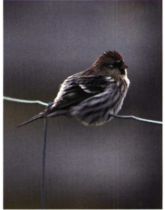
220 NW Redpoll / NW-Barmsijs Carduelis flammea rostrata/islandica , Fair Isle, Shetland, Scotland, September 1997 ( Tim Loseby ). This individual shows to perfection triple striping on flanks. Otherwise, fairly typical individual although with rather restricted buff wash to throat and face 221 NW Redpoll / NW-Barmsijs Carduelis flammea rostrata/islandica , Fair Isle, Shetland, Scotland, September 1997 ( Tim Loseby ). As plate 220 but this individual with stronger and more extensive buff on throat 222 NW Redpoll / NW-Barmsijs Carduelis flammea rostrata/islandica , Fair Isle, Shetland, Scotland, September 1996 ( Roger Riddington ). One of most obvious of NW Redpolls. Huge, with deep brown mantle, dark rich buff on head and strongly marked flanks