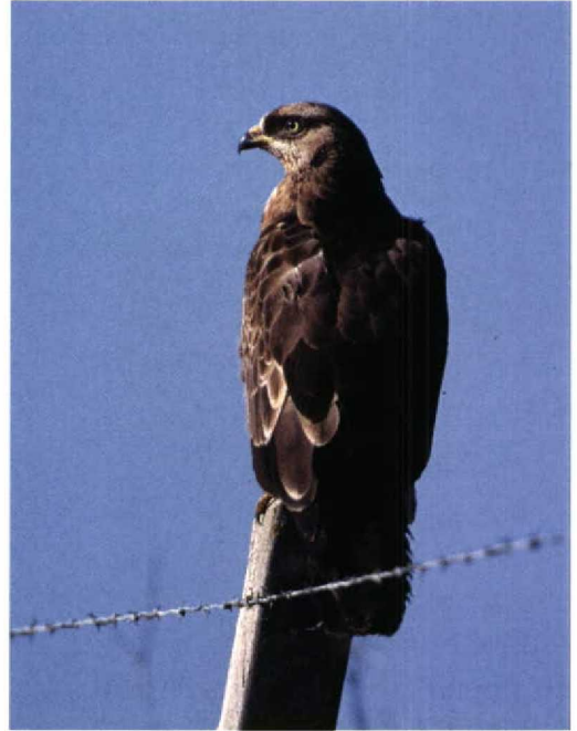
239 European Honey-buzzard / Wespendif Pernis apivorus , first winter (second calendar year), s'Ena Arrubia marsh, Sardinia, Italy, 21 January 1995. Note that iris is already pale yellowish as in adult while cere is still pure bright yellow as in juvenile

Marcello Grussu, Gruppo Ornitologico Sardo, Via Cilea 79, 09045 Quartu S Elena (CA), Sardinia, Italy Maurizio Azzolini, Gruppo Ornitologico Sardo, Via Cilea 79, 09045 Quartu S Elena (CA), Sardinia, Italy Andrea Corso, GSRO, via Camastra 10, 96100 Siracusa, Italy