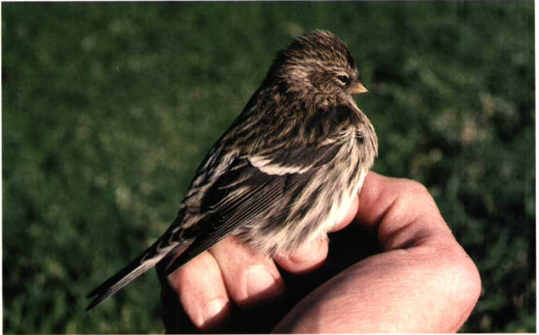
224 NW Redpoll / NW-Barmsijs Carduelis flammea rostrata/islandica , Fair Isle, Shetland, Scotland, September 1997. This individual shows typically plain face and dark tawny-brown upperparts lacking grey. Note also bill structure: culmen quite straight distally and tip of bill looking rather fine. This individual does not look heavy-billed because deep base of bill is difficult to see. Upper rump quite pale and greater-covert wing-bar strikingly white