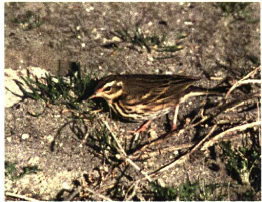
259 Surf Scoter / Brilzee-eend Melanitta perspicillata , first-winter female, Ouessant, Finistère, France, 26 October 1998 260 Pied-billed Grebe / Dikbekkuut Podilymbus podiceps , Bryher, Scilly, England, October 1998 261 Ruby-crowned Kinglet / Roodkroonhaan Regulus calendula , Vestmannaeyjar, Iceland, 11 October 1998 262 Olive-backed Pipit / Siberische Boompieper Anthus hodgsoni , Zeebrugge, West-Vlaanderen, Belgium, 6 November 1998

ber, a first-winter Bonaparte's Gull L. philadelphia on Pico on 11 November (fourth record), and Ring-billed Gulls L. delawarensis at Faja Grande, Flores, on 8 November (one first-winter), at Lajes do Pico, Pico, on 10 November (one first-winter), and on Terceira on 16-19 November (at least four first-winters and an adult). In France, a first-winter Laughing Gull was seen at Noirmoutier, Vendée, on 31 October and 18 November. In the north-eastern USA, an influx of Franklin's Gulls L. pipixcan followed a storm from the Plains in the second week of November; for instance, dozens were seen around Cape May, New Jersey, possibly the species' best showing ever in this part of the world. The third Audouin's Gull L. audouinii for Switzerland was a first-winter at Lac Léman on 9 September (the bird was also reported for 6 September on the French side of the lake). An alleged American Herring Gull L. smithsonianus at Scheveningen, Zuid-Holland, the Netherlands,