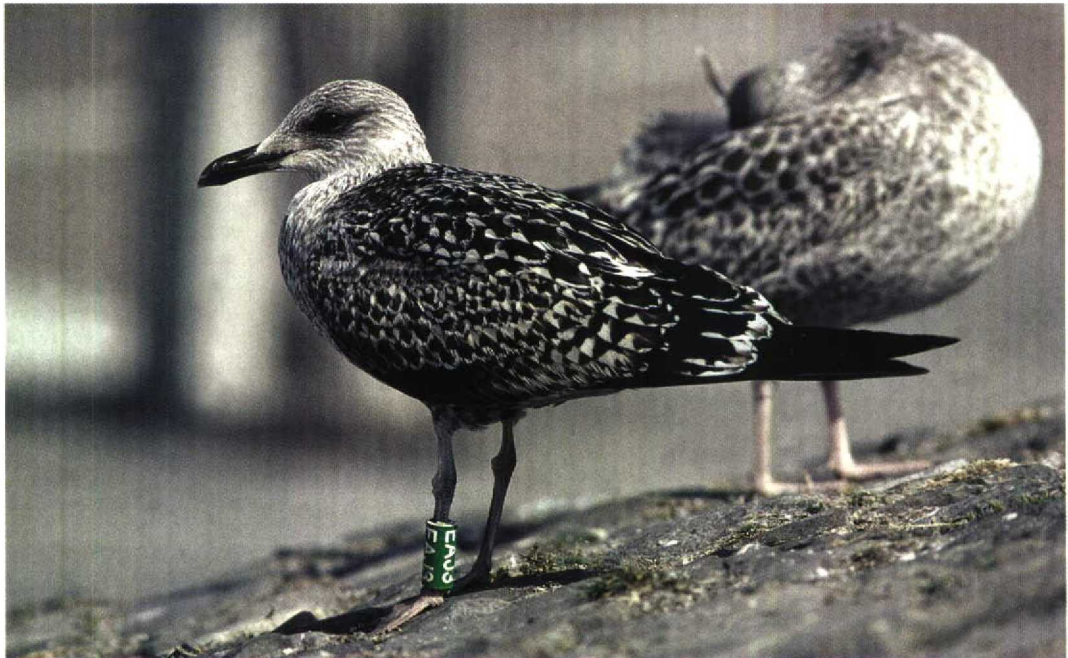
253 Lesser Black-backed Gull / Kleine Mantelmeeuw Larus graellsii , juvenile, Scheveningen, Zuid-Holland, Netherlands, 17 August 1997