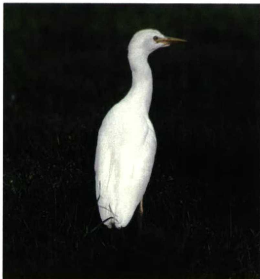
267 Koereiger / Cattle Egret Bubulcus ibis , De Putten, Camperduin, Noord-Holland, november 1998