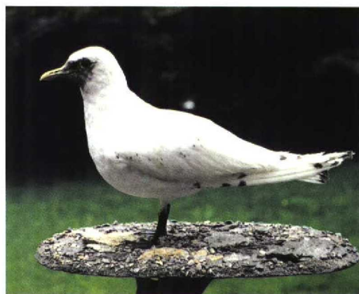
236 Ivoormeeuw / Ivory Gull Pagophila eburnea , eerste-zomer, Sankt Peter-Ording, Schleswig-Holstein, Duitsland, 24 mei 1997 (Detlef Gruber) 237 Ivoormeeuw / Ivory Gull Pagophila eburnea , eerste-zomer (dood gevonden te Langeneß, Schleswig-Holstein, Duitsland, 9 juni 1997), Ludwig Nissen-Haus, Husum, Schleswig-Holstein, Duitsland, 28 augustus 1998 (Marc Argeloo)

de zwarte poten en het formaat als een gedrongen zware Stormmeeuw met de brede, spits toelopende vleugels past uitsluitend op een onvolwassen Ivoormeeuw. De zwarte vlekjes in het verenkleed en de donkere vlek op de kop wijzen op een tweede-kalenderjaarvogel. Het vrijwel ontbreken van zwarte vlekjes op het lichaam duidt op een vogel in eerste zomerkleed (Grant 1982, Cramp & Simmons 1983). De kop was nog erg donker en mogelijk moest de kopruï van eerste winterkleed naar eerste zomerkleed nog worden voltooid (cf Grant 1982). Het ontbreken van één of twee staartpennen in het midden van de staart zou kunnen duiden op rui van eerste zomerkleed naar tweede winterkleed (Grant 1982, Cramp & Simmons 1983).