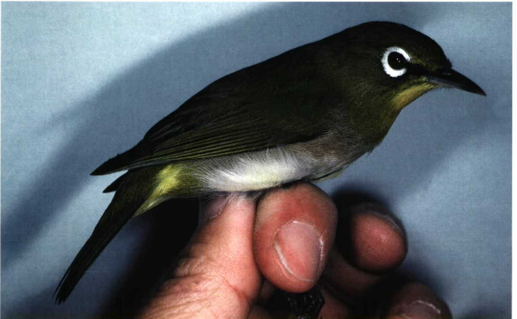
28 Japanese White-eye / Japanese Brillvogel Zosterops japonicus japonicus , first-winter male, Sekiya, Niigata City, Niigata, Japan, 28 October 1992 (Yoshimitsu Shigeta)