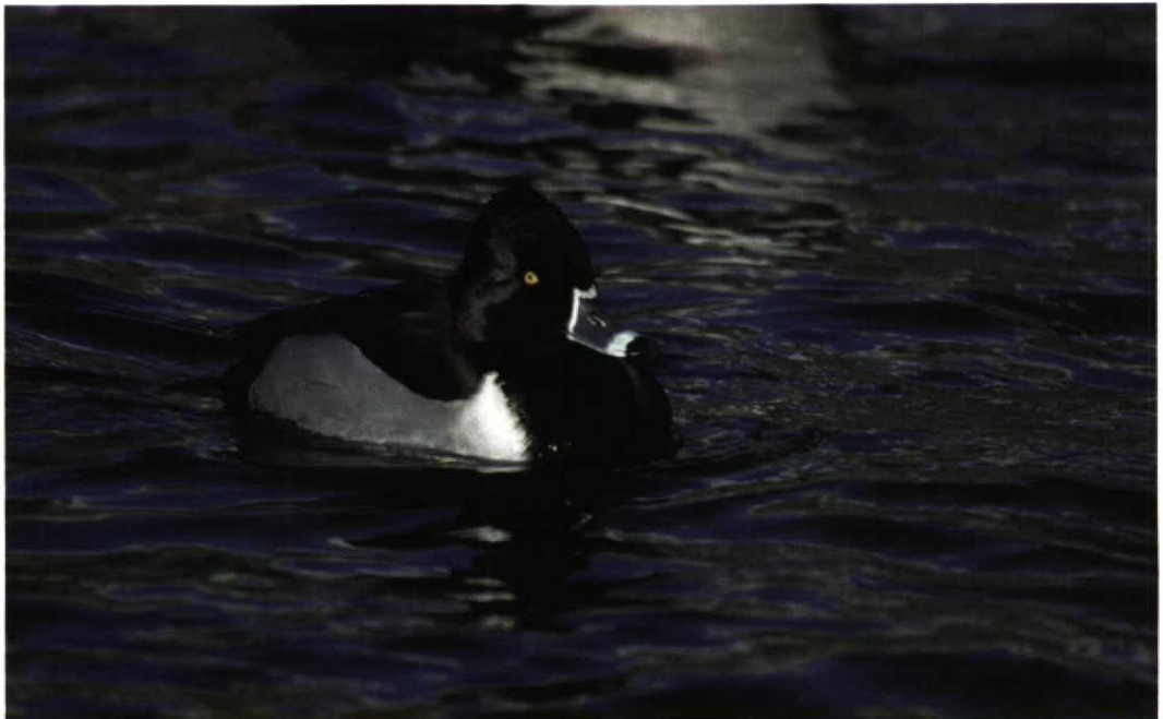
42 Ring-necked Duck / Ringsnaveleend Aythya collaris , Reykjavík, Iceland, 3 March 1998 (Gunnar Hallgrímsson)