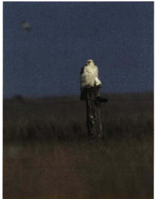
50-51 Giervalk / Gyr Falcon Falco rusticolus , onvolwassen, Schiermonnikoog, Friesland, 27 maart 1998 (Arnoud B van den Berg)

Holland, zag er als volgt uit: op 1 februari op de Ouderkerkerplas, op 2 februari op het Nieuwe Diep, op 3 en 8 februari weer op de Ouderkerkerplas, op 11 en 12 februari op het Kleine Nieuwe Diep en op 14 februari opnieuw op de Ouderkerkerplas. Het maximale aantal Ijseenden Clangula hyemalis langs de Brouwersdam, Zuid-Holland/Zeeland, bedroeg slechts zes op 6 februari. Amerikaanse Smienten Mareca americana verbleven van 26 tot 29 maart nabij Spaarndam, Noord-Holland, en op 27 maart in de Lauwersmeer, Groningen. Op 25 februari werden minimaal 200 Roodkeelduikers Gavia stellata geteld aan de buitenzijde van de Brouwersdam. Binnenlandwaarnemingen van Parelduikers G. arctica waren er van 29 januari tot 8 februari op de Nedereindse Plas bij IJsselstein, Utrecht, van 6 tot 11 februari ten oosten van Drachten, Friesland, van 15 tot 17 februari te Utrecht, Utrecht, en op 14 maart bij de Clauscentrale te Maasbracht, Limburg. Eén tot twee Ijsduikers G. immer verbleven in februari nog langs de Brouwersdam. Noordse Stormvogels Fulmarus glacialis waren spaarzaam; langsvliegende werden gezien op 8 maart bij Westkapelle, Zeeland, en op 18 maart bij Scheveningen, Zuid-Holland. Een onvolwassen Kuifaalscholver Stictocorbo aristotelis zwom van 16 tot 19 maart tussen de havenhoofden bij Scheveningen. Tot in maart werden Kleine Zilverreigers Egretta garzetta waargenomen in de Millingerwaard, Gelderland, en twee bij het Veerse