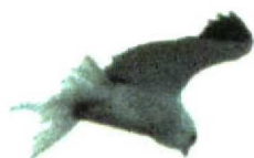
40 Black-shouldered Kite / Grijze Wouw Elanus caeruleus , adult, Grenen, Nordjylland, Denmark, 30 March 1998