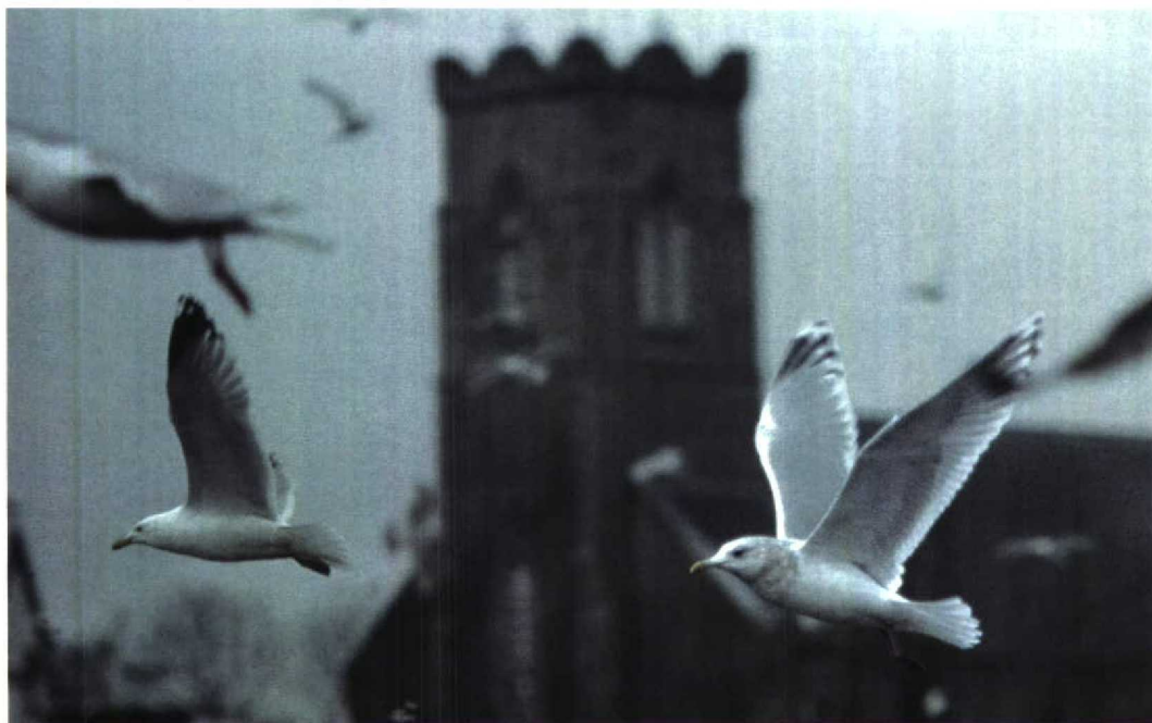
43 Thayer's Gull / Thayers Meeuw Larus glaucooides thayeri , adult, Killybegs, Donegal, Ireland, February 1998