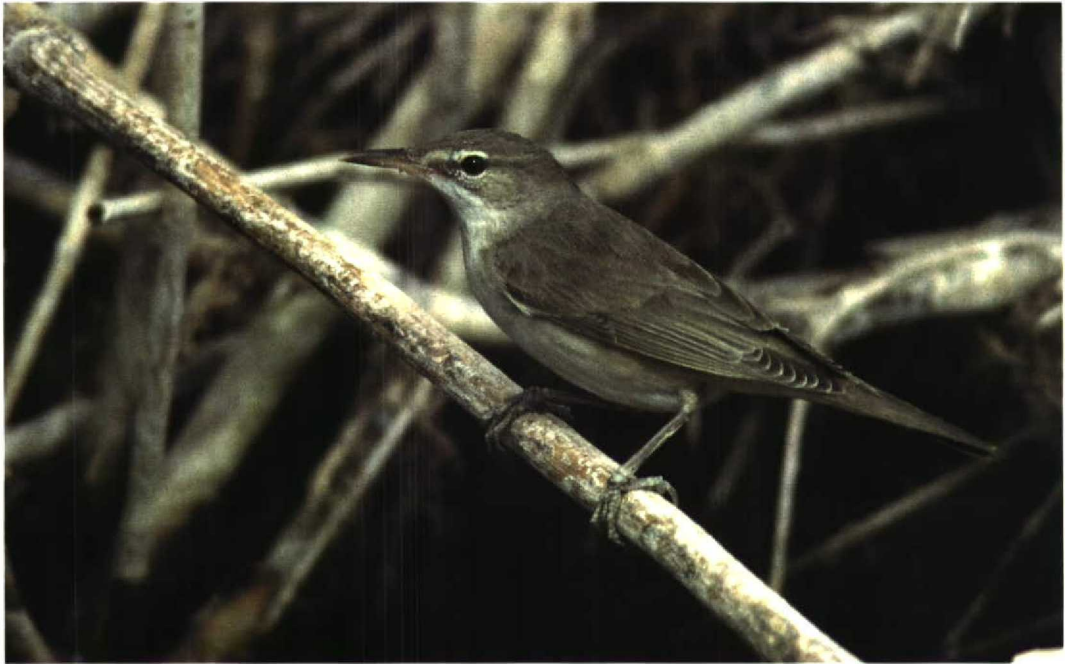
47 Basra Reed Warbler / Basrakarekiet Acrocephalus griseldis , Eilat, Israel, March 1998

mer Rynchops niger seen at Walvis Bay, Namibia, in February might be the first for Africa.