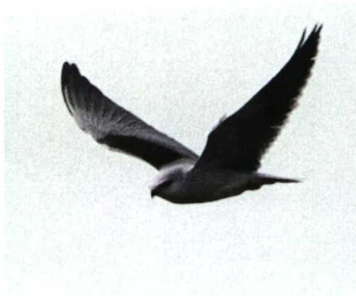
59 Grijze Wouw / Black-shouldered Kite Elanus caeruleus , adult, De Cocksdorp, Texel, Noord-Holland 30 maart 1998 (René van Rossum)

De laatste jaren is het aantal gevallen van Ross' Meeuw in Nederland sterk toegenomen; er zijn er nu