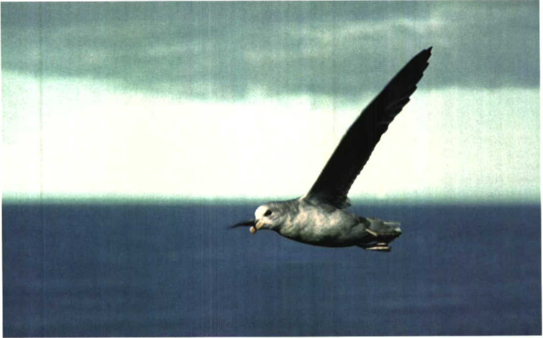
34 Fulmar / Noordse Stormvogel Fulmarus glacialis , 'double dark' morph, Sörhamna, Björnøya, Norway, 12 July 1980 (Jan Andries van Franeker)