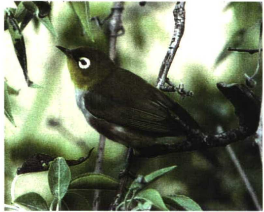
30 Chestnut-flanked White-eye / Roodflankbrilvogel Zosterops erythropleurus , Beidaihe, China, May 1996 (Göran Ekström). Note grey side of breast and clear demarcation between yellow throat and grey breast

14 April 1990 at Den Haan aan Zee, West-Vlaanderen (ring number JD4269, left, additional red ring on right leg). Both records were rejected by the Flemish rarities committee (BAHC) because of the large escape risk and the unlikelihood of genuine vagrancy (Philippe Schepens in litt).