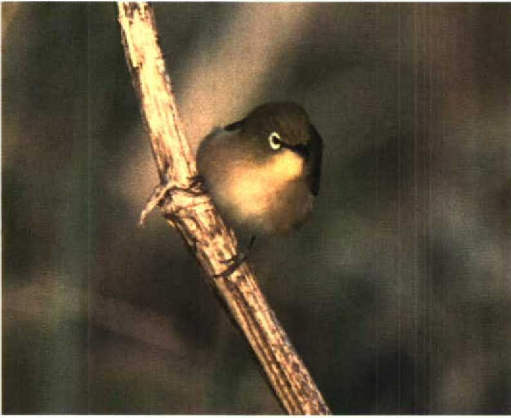
29 Japanese White-eye / Japanese Brilvogel Zosterops japonicus , Hegura-jima, Japan, October 1996. Note brown side of breast and ill-defined demarcation between yellow throat and green on side of neck and brown of breast