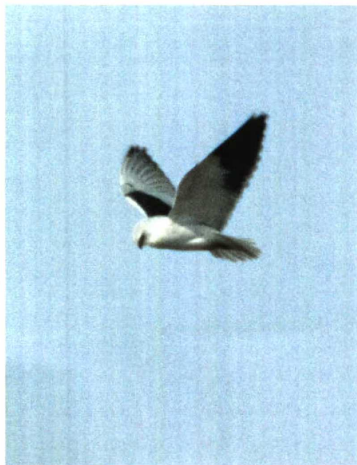
41 Black-shouldered Kite / Grijze Wouw Elanus caeruleus , adult, De Cocksdorp, Texel, Noord-Holland, Netherlands, 30 March 1998

to at least 30 March concerned (only) the sixth record for the Netherlands and the second of a white one. From 12 March onwards, a white morph was seen several times on North Uist, Western Isles, Scotland. On 5-8 April, the first twitchable white morph since 12 years for England stayed at Wembury, Devon; it also turned up at Rame Head, Cornwall. On 3-16 April, one was present at Balranald, Highland, Scotland. In Denmark, a dark morph juvenile stayed from 18 February to at least 9 April at Frederiksberg Have, København, Nordsjælland.