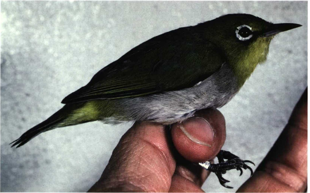
27 Japanese White-eye / Japanese Brillvogel Zosterops japonicus simplex , adult, Kadoorie, Hong Kong, China, 22 December 1990 (Yoshimitsu Shigeta)