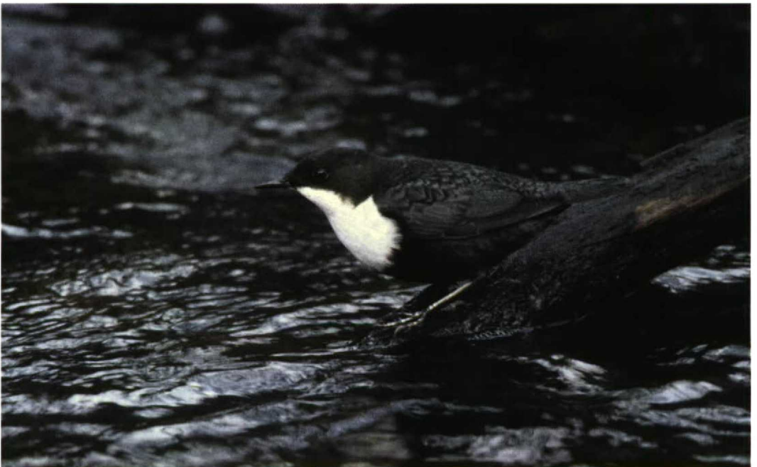
55 Waterspreeuw / Dipper Cinclus cinclus , Hierdense Beek, Gelderland, 21 januari 1998 (Wim Smeets)