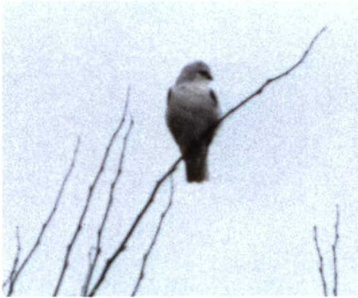
58 Grijs Wouw / Black-shouldered Kite Elanus caeruleus , adult, De Cocksdorp, Texel, Noord-Holland 30 maart 1998