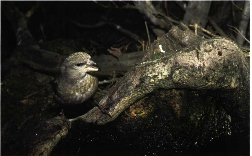
54 Grote Kruisbek / Parrot Crossbill Loxia pytyopsittacus , vrouwtje, Kennemerduinen, Noord-Holland, 13 februari 1998 (Arnoud B van den Berg)