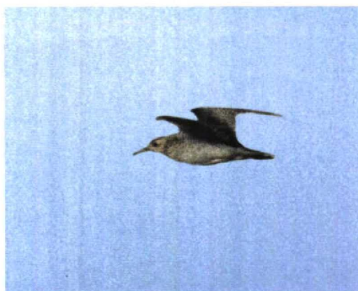
31-32 Bartrams Rooter / Upland Sandpiper Bartramia longicauda , Maasvlakte, Zuid-Holland, 28 oktober 1995

periode eind augustus tot november de broedgebieden verlaat en overwintert op de pampa's van centraal Zuid-Amerika, met name van Zuid-Brazilië tot Zuid-Argentinië. In het centrum van zijn verspreidingsgebied is het één van de meest algemene steltlopers, maar in het oostelijke deel is hij schaars en neemt hij bovendien in aantal af. Tijdens de trektijd wordt de soort vooral gezien op akkers, ruige graslanden en velden met kort gras, zoals vliegvelden en golfbanen (Hayman et al 1986).