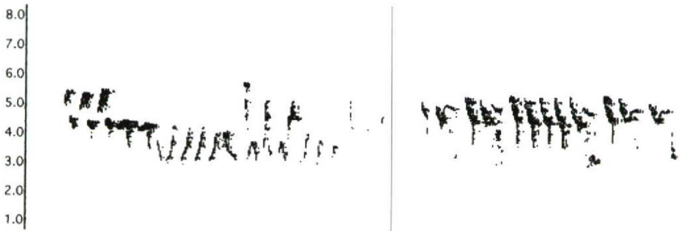
FIGUUR 1 Fitis / Willow Warbler Phylloscopus trochilus , normale zang (links) / normal song (left), mei 1957 (Sture Palmér), afwijkende zang (rechts) / aberrant song (right), Texel, Noord-Holland, 26 mei 1995 (Arnoud B van den Berg)

bleke, olijfgrijze of beige-grijze boszanger zijn geweest met onder meer een 'lange crème-witte oogstreep' (hier wordt wenkbrauwstreep bedoeld), 'een aanduiding van een licht vleugelstreepje' en 'hoornkleurige (bruine) poten'. Voous & van Dijk (1972) concludeerden dat de in 1966 opgenomen 'persistente' zang niet met grammofoon- en bandopnamen van Grauwe Fitis overeenkwamen en monotoner was met een 'aaneenrijging van weinig gevarieerde elementen op ongeveer gelijkblijvende toonhoogte'. Tevens kwamen zij tot de conclusie dat de zang ook niet kon worden toegeschreven aan andere Phylloscopus -soorten of zogenaamde Fitis-Tijftjafmengzangers (cf Schubert 1969; zie ook Haftorn 1993). Het is op basis van beschrijvingen aanneemelijk dat de Drentse vogels Fitissen waren. Een vergelijking tussen sonogrammen van de Texelse vogel en die van de Drentse raadselzanger in 1966 (Limosa 45: 39, 1972) toont overeenkomsten in lengte, monotonie en ritme terwijl de toonhoogte op c 4 kHz bleef. De Drentse sonogrammen laten echter onvoldoende detail zien voor een nauwkeurige vergelijking met die van Texel zodat niet duidelijk is in hoeverre de zang identiek genoemd kan worden.