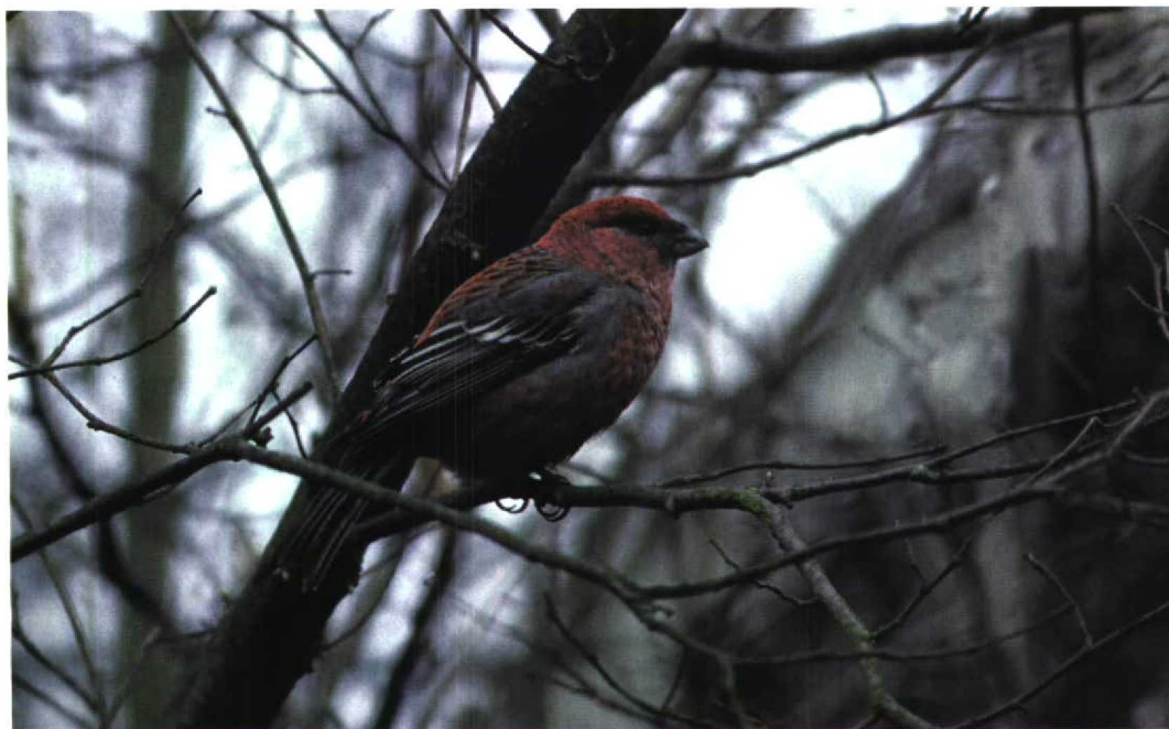
36 Haakbek / Pine Grosbeak Pinicola enucleator , Melissant, Zuid-Holland, 24 maart 1996 (Gertjan de Zoete)