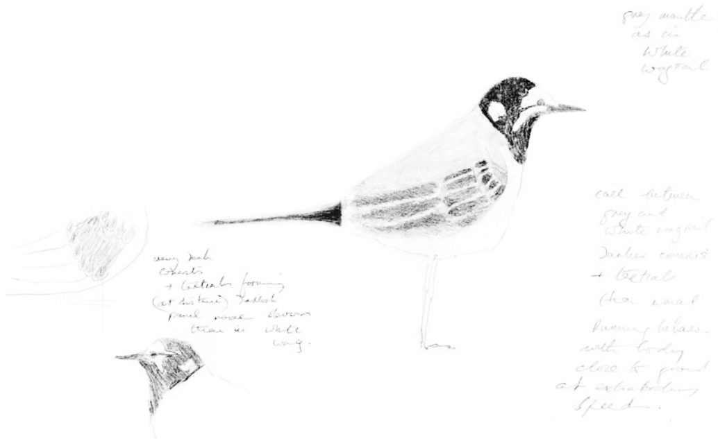
FIGURE 1 Moroccan Wagtail / Marokkaanse Kwikstaart Motacilla subpersonata , adult male, Mina de São Domingos, Mértola, Alentejo, Portugal, 13 July 1995 (C C Moore)

ed on 14 July and supplementary notes were taken. The extraordinary speed of the bird on the ground prevented photography but extensive notes were taken and a field sketch (figure 1) was made on 13 July while watching the bird; the notes are summarized here.