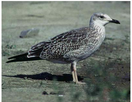
118 Baltic Gull / Baltische Mantelmeeuw Larus fuscus , juvenile, Hanko, Finland, 5 October 1996 (Harry J Lehto). Individual showing dark underwing but note largely unmarked white uppertail-coverts, unlike most graellsii 119 Baltic Gull / Baltische Mantelmeeuw Larus fuscus , juvenile, Turku, Finland, 3 September 1997 (Harry J Lehto) 120 Baltic Gull / Baltische Mantelmeeuw Larus fuscus , juvenile, Turku, Finland, 3 September 1997 (Harry J Lehto). Note extensively pale underparts, axillaries and underwing-coverts 121 Baltic Gull / Baltische Mantelmeeuw Larus fuscus , juvenile, Hanko, Finland, 5 October 1996 (Harry J Lehto). Note contrastingly white belly and long-winged flight silhouette 122 Baltic Gull / Baltische Mantelmeeuw Larus fuscus , juvenile, Turku, Finland, 27 July 1983 (Harry J Lehto) 123 Baltic Gull / Baltische Mantelmeeuw Larus fuscus , juvenile, Lahti, Finland, 3 September 1997 (Visa Rauste)