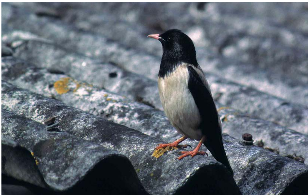
191 Roze Spreeuw / Rose-coloured Starling Sturnus roseus , mannetje, Weesp, Noord-Holland, 1 mei 1999 (Harm Niessen)