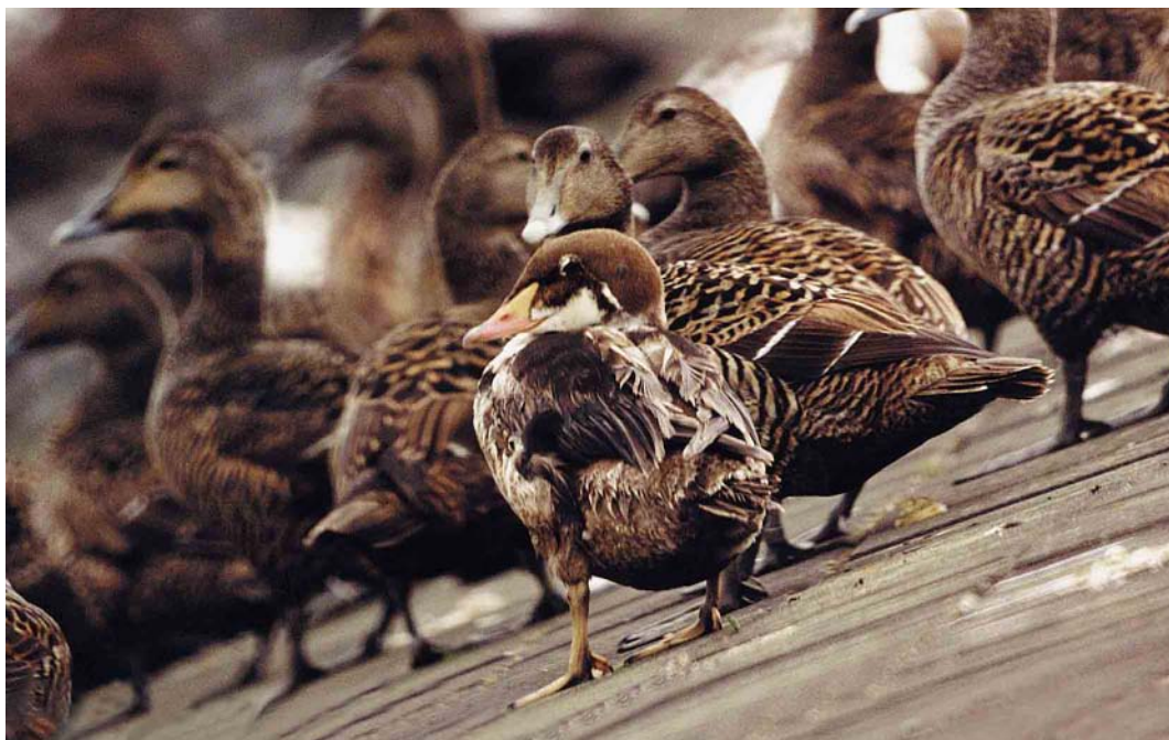
189 Koningseider / King Eider Somateria spectabilis , eerste-zomer mannetje, Vlieland, Friesland, 24 mei 1999