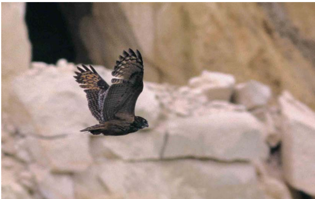
177 Eurasian Eagle Owl / Oehoe Bubo bubo , adult, Maastricht, Limburg, Netherlands, 5 June 1999 (Arnoud B van den Berg)

legs Tringa flavipes for the Cape Verde Islands was photographed on Boavista on 17 March. An adult summer Spotted Sandpiper Actitis macularia was seen at Loch Spynie, Moray, Scotland, on 25 May. A minor influx of Terek Sandpipers Xenus cinereus in north-western Europe involved, eg, three in April and three in May in Britain, two on 1-2 May in France, two on 12 and 27 May in Belgium, five in May in the Netherlands, three in Denmark from 25 May to 7 June, and three in Norway from 21 May to 9 June. In France, a Wilson's Phalarope Phalaropus tricolor turned up at Brem-sur-Mer, Vendée, on 3 May. The sixth and seventh for Denmark (and the firsts since 1987) were females in Vestjylland at Værnengene, Skjern, on 2-10 May and at Vest Stadil Fjord, Ringkøbing, on 10-11 May. The eighth for Sweden was a male at Hörningsholm, Alnön, Medelpad, on 9 May. In Portugal, an adult summer male was photographed at Pancas, Ribatejo, Tejo estuary, on 26 May. In Germany, one was seen at Katinger Watt, Schleswig-Holstein, on 8 June.