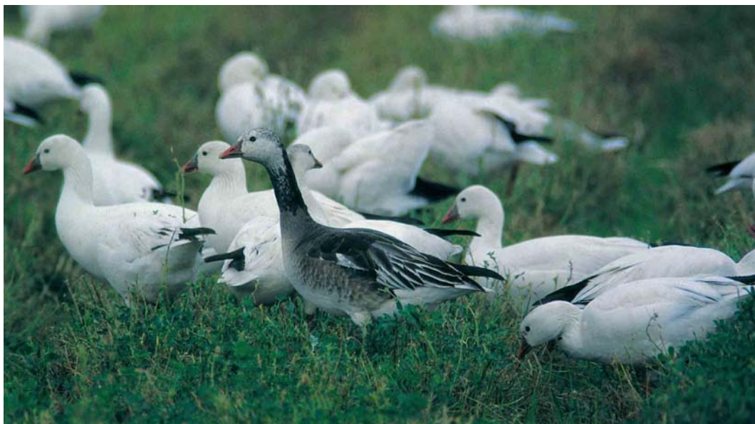
171 Ross's Geese / Ross' Ganzen Anser rossii , immature blue morph with adults white morph, Salton Sea, California, USA, January 1998

The blue morph of Ross's Goose is extremely rare and much more enigmatic than blue Snow Goose. The existence of this morph was confirmed as recently as 1971 (Cook & Ryder 1971). A few years later, Todd (1979) stated: 'Recent docu-