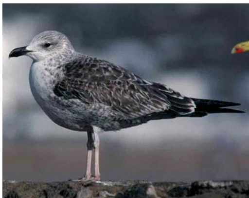
124 Lesser Black-backed Gull / Kleine Mantelmeeuw Larus graellsii , juvenile moulting to first-winter, Brouwersdam, Zuid-Holland, Netherlands, 1 November 1992 ( Arie de Knijff ). Note grey-brown markings on head and underparts 125 Lesser Black-backed Gull / Kleine Mantelmeeuw Larus graellsii , juvenile, Belfast, Northern Ireland, August 1997 ( Anthony McGeehan ). Uppertail-coverts not as well-marked as in typical graellsii 126 Lesser Black-backed Gull / Kleine Mantelmeeuw Larus graellsii , juvenile, Borkum, Niedersachsen, Germany, August 1998 ( Detlef Gruber ). Note uniform dark-brownish underwing-coverts and strongly barred uppertail- and undertail-coverts 127 Lesser Black-backed Gull / Kleine Mantelmeeuw Larus graellsii , juvenile, Borkum, Niedersachsen, Germany, August 1998 ( Detlef Gruber ). Note strongly barred uppertail-coverts, wide tail-band and slightly paler inner primaries compared with outer ones 128 Lesser Black-backed Gull / Kleine Mantelmeeuw Larus graellsii , first-winter, Essaouira, Morocco, 2 March 1999 ( Theo Bakker/Cursorius ). Note grey-brown markings to head, flank and belly typical for graellsii 129 Lesser Black-backed Gull / Kleine Mantelmeeuw Larus graellsii , first-winter, Essaouira, Morocco, 2 March 1999 ( Theo Bakker/Cursorius )