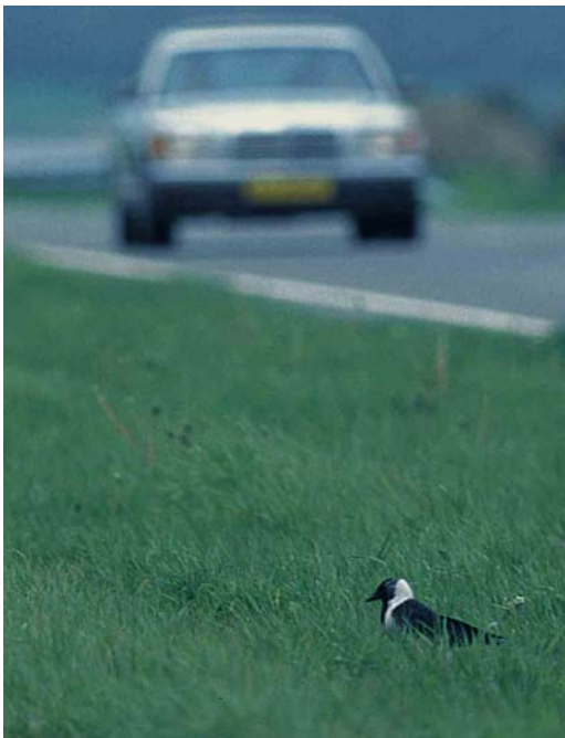
159 Daurische Kauw / Daurian Jackdaw Corvus dauuricus , adult, Amsteldiepdijk, Wieringen, Noord-Holland, 8 mei 1997 (Ruud E Brouwer)

GROOTTE & BOUW Zelfde lichaamsbouw als Kauw, vleugels iets langer lijkend. Vleugelpunt tot staartpunt reikend.