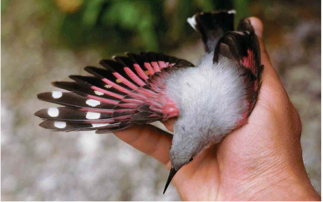
167 Wallcreeper / Rotskruiper Tichodroma muraria , female, Malá Fatra mountains, Slovakia, 2 July 1991 (Miroslav Saniga)

with spread wings and is blown upwards, almost without moving the wings. It especially shows its extraordinary agility and manoeuvrability when attacked by aerial predators like Eurasian Sparrowhawk Accipiter nisus , Common Kestrel Falco tinnunculus , Eurasian Hobby F subbuteo or Peregrine Falcon F peregrinus . It flutters about wildly in all directions close to the rock face, thus evading attack (figure 3). The species also shows extraordinary manoeuvrability in aerial tussles of rivals or when male and female flutter about each other when they happen to meet in the vicinity of the nest.