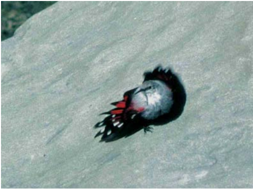
168 Wallcreeper / Rotskruiper Tichodroma muraria , Cirque de Gavarnie, Hautes-Pyrénées, France, 4 September 1995 (Arnoud B van den Berg)