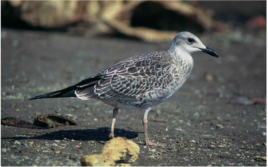
130 Baltic Gull / Baltische Mantelmeeuw Larus fuscus , juvenile, Lahti, Finland, 27 August 1997 (Visa Rauste). Note whitish fringes of scapulars, wing-coverts and tertials, and whitish head and underparts 131 Baltic Gull / Baltische Mantelmeeuw Larus fuscus , juvenile, Lahti, Finland, 24 September 1997 (Visa Rauste). Note largely blackish tail, largely unmarked whitish rump and uppertail-coverts, and lack of 'pale window' in wing