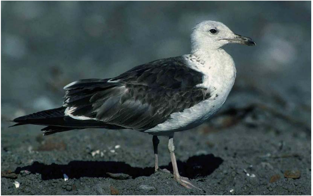
143 Baltic Gull / Baltische Mantelmeeuw Larus fuscus , first-summer, Topinoja, Finland, 8 July 1998