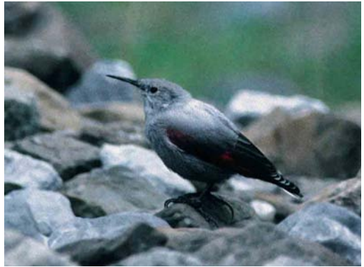
169 Wallcreeper / Rotskruiper Tichodroma muraria , Cirque de Gavarnie, Hautes-Pyrénées, France, 7 September 1995 (Arnoud B van den Berg)

inconspicuous bird, merging perfectly with the blue-grey background, into a very conspicuous bird. Wing-flicking is a slow movement performed constantly, not only when climbing but also when feeding or resting briefly. Juveniles do this as soon as they have fledged.