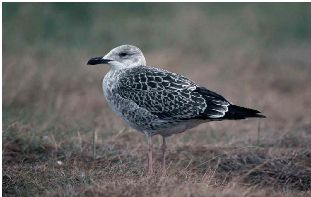
116 Lesser Black-backed Gull / Kleine Mantelmeeuw Larus graellsii , juvenile, Maasvlakte, Zuid-Holland, Netherlands, August 1990. Rather pale-headed individual 117 Baltic Gull / Baltische Mantelmeeuw Larus fuscus , juvenile, Turku, Finland, 3 September 1997. Note pattern of fresh first-winter scapulars, whitish fringes of wing-coverts and tertials, and pale ground colour of head and underparts