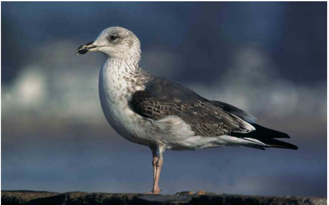
144 Lesser Black-backed Gull / Kleine Mantelmeeuw Larus graellsii , second-winter, Essaouira, Morocco, 2 March 1999