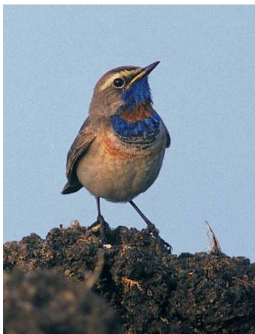
184 Rufous-tailed Rock Thrush / Rode Rotslijster Monticola saxatilis , male, Lauwersmeer, Groningen, Netherlands, 4 May 1999 ( Arie Ouwerkerk ) 185 Red-spotted Bluethroat / Roodsterblauwborst Luscinia svecica svecica , male, Veendam, Groningen, Netherlands, 27 June 1999 ( Arnoud B van den Berg ) 186 White-throated Robin / Perzische Roodborst Irania gutturalis , male, Yotvata, Israel, 19 April 1999 ( Barak Granit ) 187 Thick-billed Lark / Diksnavelleeuwerik Ramphocoris clotbey , southern Negev, Israel, 29 May 1999 ( Barak Granit )