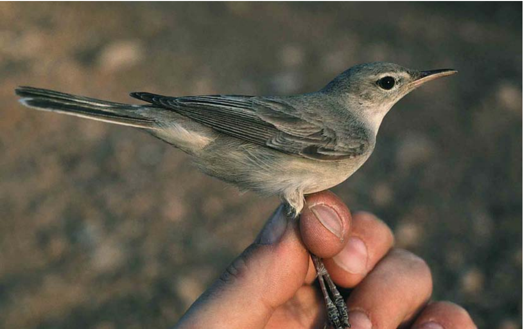
175 Upcher's Warbler / Grote Vale Spotvogel Hippolais languida , Birecik, Turkey, 25 May 1994