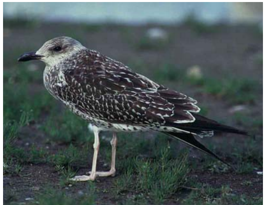
104 Baltic Gull / Baltische Mantelmeeuw Larus fuscus , juvenile, Lahti, Finland, 24 September 1997 ( Henry Lehto ). Note slender and long-winged appearance 105 Baltic Gull / Baltische Mantelmeeuw Larus fuscus , juvenile, Turku, Finland, 7 September 1997 ( Henry Lehto ) 106 Baltic Gull / Baltische Mantelmeeuw Larus fuscus , juvenile, Turku, Finland, 20 August 1997 ( Henry Lehto ) 107 Baltic Gull / Baltische Mantelmeeuw Larus fuscus , juvenile, Lahti, Finland, 27 August 1997 ( Visa Rauste ). Note slender bill, Mew Gull L. canus -like rounded head, long wings, whitish fringes of wing-coverts and tertials, and contrastingly pale underparts 108 Baltic Gull / Baltische Mantelmeeuw Larus fuscus , juvenile, Altwarmbüchener See, Niedersachsen, Germany, October 1997 ( Detlef Gruber ). Dark individual; colour-ringed as pullus (C9C7) at Sahalahti (61:31N, 24:21E), Finland, on 15 July 1997 109 Baltic Gull / Baltische Mantelmeeuw Larus fuscus , juvenile, Lahti, Finland, 22 September 1997 ( Visa Rauste )