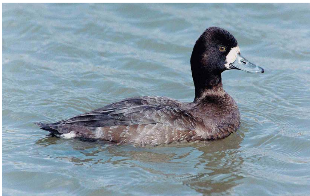
176 Lesser Scaup / Kleine Topper Aythya affinis , Cleethorpes, Lincolnshire, England, April 1999

and at least four in Belgium (where also four pulli were ringed at Brecht, Antwerpen). The second singing in Britain this century was at Grove Ferry, Kent, from 6 June onwards. The first sound-recorded in Portugal was at Lagoa dos Patos, Ferreira do Alentejo, on 5 June. At the Kizilirmak delta, confirmation of the presence (and breeding) of Grey-headed Swamp-hen Porphyrio poliocephalus on the Turkish Black Sea coast was provided by the observation of an adult with two fledged young on 27 June. The second American Coot Fulica americana for Britain was photographed at South Walney, Cumbria, on 17 April.