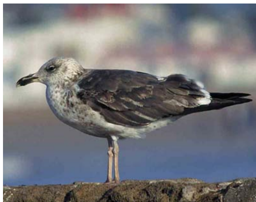
139 Yellow-legged Gull / Geelpootmeeuw Larus michahellis , juvenile moulting to first-winter, Scheveningen, Zuid-Holland, Netherlands, 21 November 1998. Combination of heavy body and rather large bill, pale head and belly, paler inner primaries and already heavily worn plumage distinguishes this bird from fuscus and graellsii 140 Lesser Black-backed Gull / Kleine Mantelmeeuw Larus graellsii , first-summer moulting to second-winter, Scheveningen, Zuid-Holland, Netherlands, 19 August 1997 141 Lesser Black-backed Gull / Kleine Mantelmeeuw Larus graellsii , first-summer moulting to second-winter, Brouwersdam, Zuid-Holland, Netherlands, 1 November 1992 142 Lesser Black-backed Gull / Kleine Mantelmeeuw Larus graellsii , second-winter, Essaouira, Morocco, 2 March 1999

ing the autumn migration. This explains why third-calendar-year and older graellsii do not show any sign of moult in February-May but, instead, some individuals show abraded primaries in spring. Most second-calendar-year graellsii do not moult primaries before May but the same also applies for some fuscus of similar age.