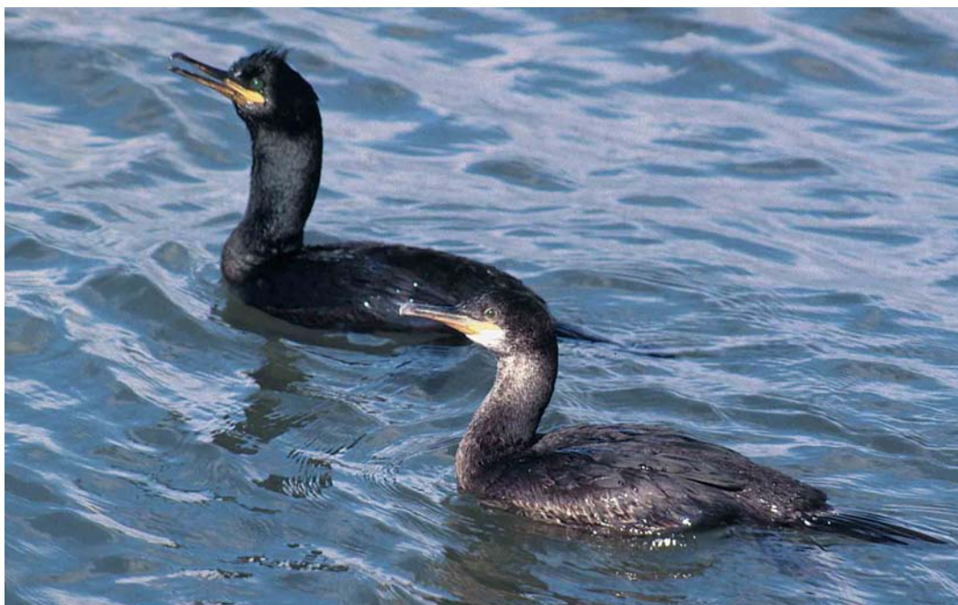
190 Kuifaalscholwers / European Shags Stictocarbo aristotelis , adult en onvolwassen, IJmuiden, Noord-Holland, 15 april 1999 (Harm Niessen)