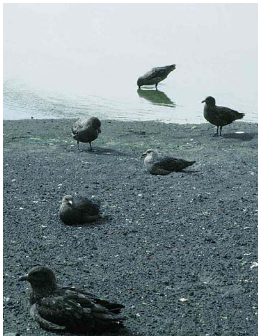
170 Brown Skua Stercorarius arcticus lonnbergi (in front) with South Polar Skuas S maccormicki , Deception Island, December 1995 (Magnus Ullman). Note smaller overall size, smaller head and smaller bill of South Polar Skuas

I have witnessed the same on Petermann Island, further south along the Antarctic Peninsula, where the climate is colder. South Polar Skuas perching on ice and snow did display smaller and more slender bills than the accompanying Brown Skuas.