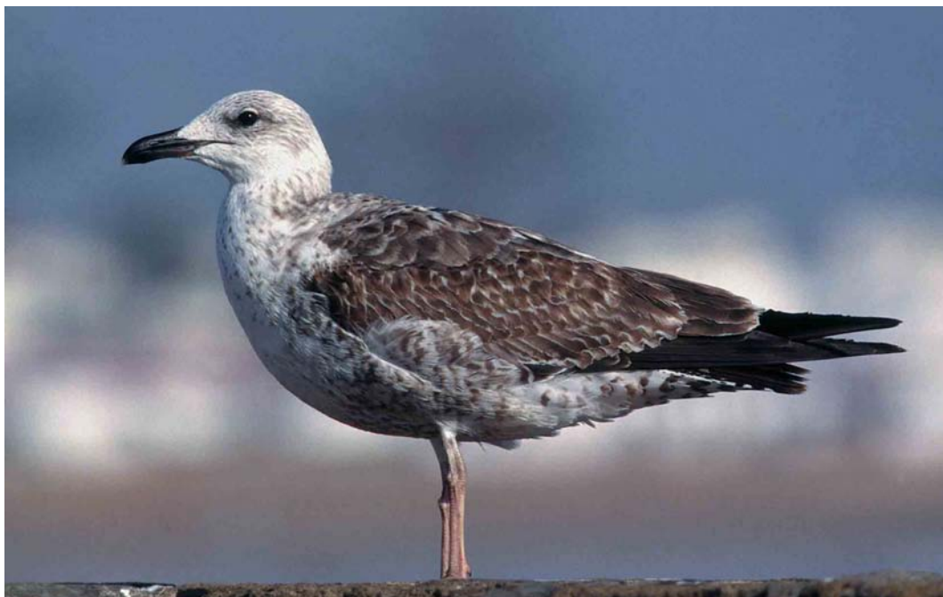
132 Lesser Black-backed Gull / Kleine Mantelmeeuw Larus graellsii , first-winter, Essaouira, Morocco, 2 March 1999

diagnostic, one should always pay attention to a suite of characters. Individual variation makes things even more difficult.