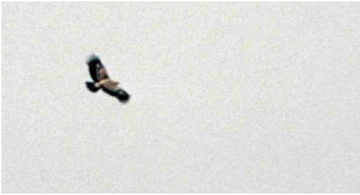
158 Imperial Eagle / Keizerarend Aquila heliaca , Valli del Mezzano, Ferrara, Italy, 17 December 1997