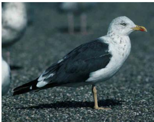
151 Lesser Black-backed Gull / Kleine Mantelmeeuw Larus graellsii , second-summer, Maasvlakte, Zuid-Holland, Netherlands, 18 May 1990 ( Arie de Knijff ). Note brownish wing-coverts and tertials contrasting with largely blue-grey mantle and scapulars 152 Lesser Black-backed Gull / Kleine Mantelmeeuw Larus graellsii , probably second-summer, Maasvlakte, Zuid-Holland, Netherlands, June 1993 ( Peter de Knijff ) 153 Lesser Black-backed Gull / Kleine Mantelmeeuw Larus graellsii , third-winter, Essaouira, Morocco, 2 March 1999 ( Theo Bakker/Cursorius ). Profile of head and bill rather atypical 154 Lesser Black-backed Gull / Kleine Mantelmeeuw Larus graellsii , probably third-winter, IJmuiden, Noord-Holland, Netherlands, 30 January 1994 ( Arie de Knijff ) 155 Lesser Black-backed Gull / Kleine Mantelmeeuw Larus graellsii , third-winter, Essaouira, Morocco, 2 March 1999 ( Theo Bakker/Cursorius ) 156 Lesser Black-backed Gull / Kleine Mantelmeeuw Larus graellsii , adult, Brouwersdam, Zuid-Holland, Netherlands, 27 September 1992 ( Arie de Knijff ). Note stage of moult typical for graellsii ; inner primaries to p6 fresh, outer primaries old, absent or re-growing