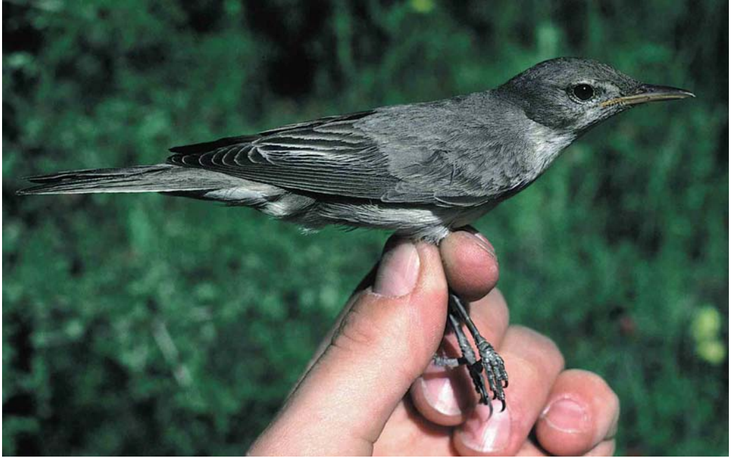
172 Olive-tree Warbler / Griekse Spotvogel Hippolais olivetorum , Birecik, Turkey, 18 May 1994