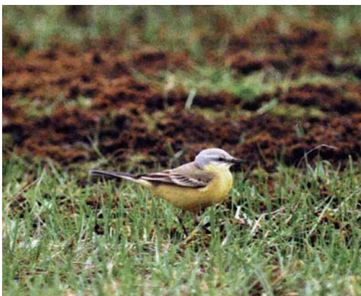
182 Possible Sykes's Blue-headed Wagtail / mogelijke Russische Gele Kwikstaart Motacilla flava beema , Maasvlakte, Zuid-Holland, Netherlands, 24 April 1999 (Bas van den Boogaard)