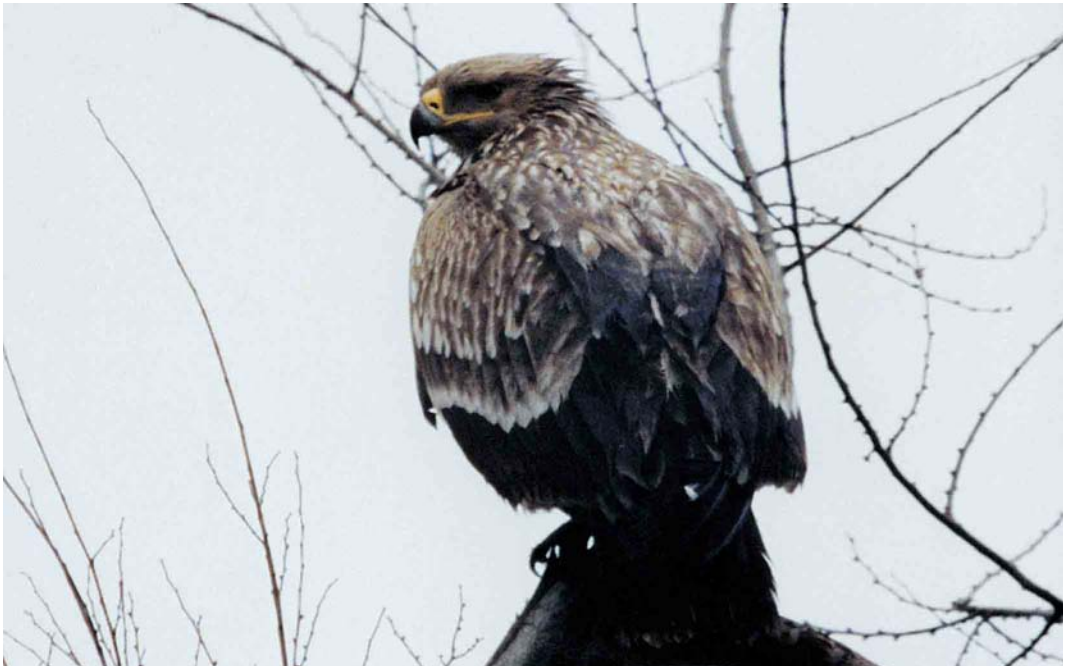
157 Imperial Eagle / Keizerarend Aquila heliaca , Valli del Mezzano, Ferrara, Italy, 1 January 1998 (Aldo Tonelli)

Generally, in heliaca , the bill is larger and heavier than in clanga . It should, however, be pointed out that, in juvenile heliaca , the bill (including nail and cere) can still be growing during the winter season and, thus, can appear smaller and lighter than in full-grown birds (this is even more evident in males). The bill of the heliaca wintering at Valli del Mezzano looked small and not heavy and was probably still growing. Typically, the nail of the bill is oblong in heliaca and oval in clanga . It should, however, be noted that, in some juvenile heliaca , the nail assumes the oblong shape only later in the winter season. This was presumably the case in the heliaca wintering at Valli del Mezzano. The nail appeared still more oval-shaped (as in clanga ) than oblong-shaped (as in heliaca ). The gape is long and thin in heliaca , reaching halfway to two-thirds of the eye, and short and thick in clanga , reaching, at most, to one-third of the eye. In heliaca , the tarsus is short and thick, looking robust and strong; in clanga , it is longer and more slender, appearing less robust and less strong. The oval shape of the nostril eliminates clanga , which has a roundish nostril.