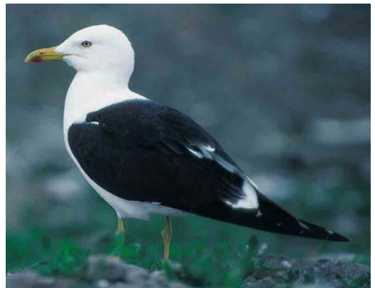
145 Baltic Gull / Baltische Mantelmeeuw Larus fuscus , first-summer, Kuopio, Finland, 9 July 1998 ( Harry J Lehto ) 146 Baltic Gull / Baltische Mantelmeeuw Larus fuscus , second-summer, Kuopio, Finland, 9 July 1998 ( Harry J Lehto ) 147 Baltic Gull / Baltische Mantelmeeuw Larus fuscus , second-summer, Oulu, Finland, 2 June 1998 ( Harry J Lehto ). Few dark tail-markings still visible; combination of adult-looking plumage with dark tail-markings typical for second-summer fuscus 148 Baltic Gull / Baltische Mantelmeeuw Larus fuscus , second-summer, Oulu, Finland, 2 June 1997 ( Henry Lehto ) 149 Baltic Gull / Baltische Mantelmeeuw Larus fuscus , second-summer, Topinoja, Finland, 12 May 1998 ( Henry Lehto ) 150 Baltic Gull / Baltische Mantelmeeuw Larus fuscus , adult, Topinoja, Finland, 6 June 1998 ( Henry Lehto )