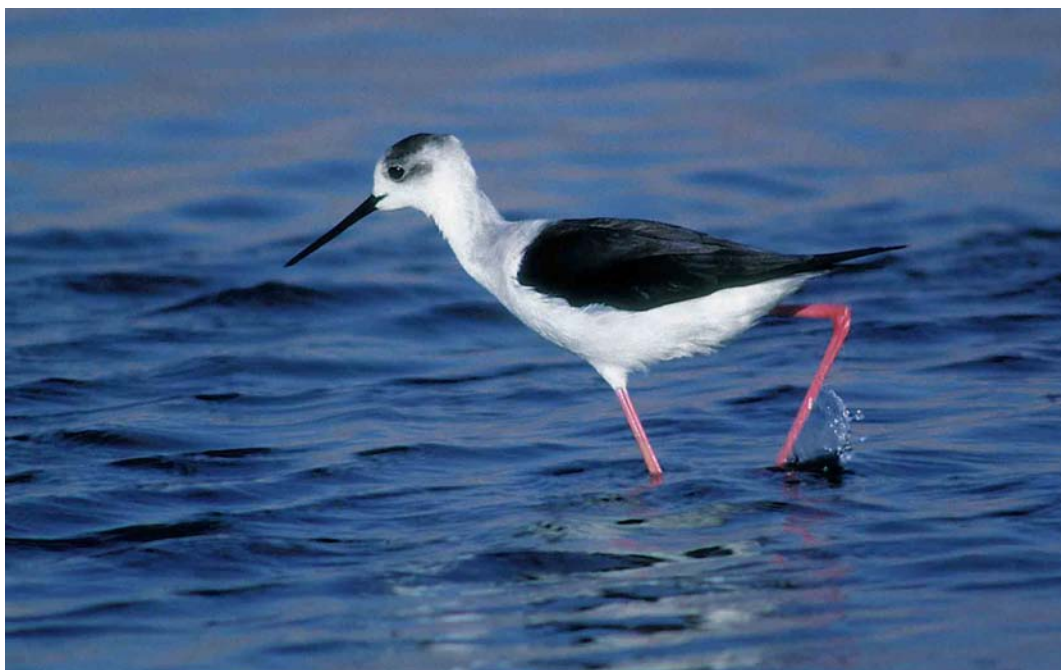
192 Steltkluut / Black-winged Stilt Himantopus himantopus , Noordvaarder, Terschelling, Friesland, 19 mei 1999