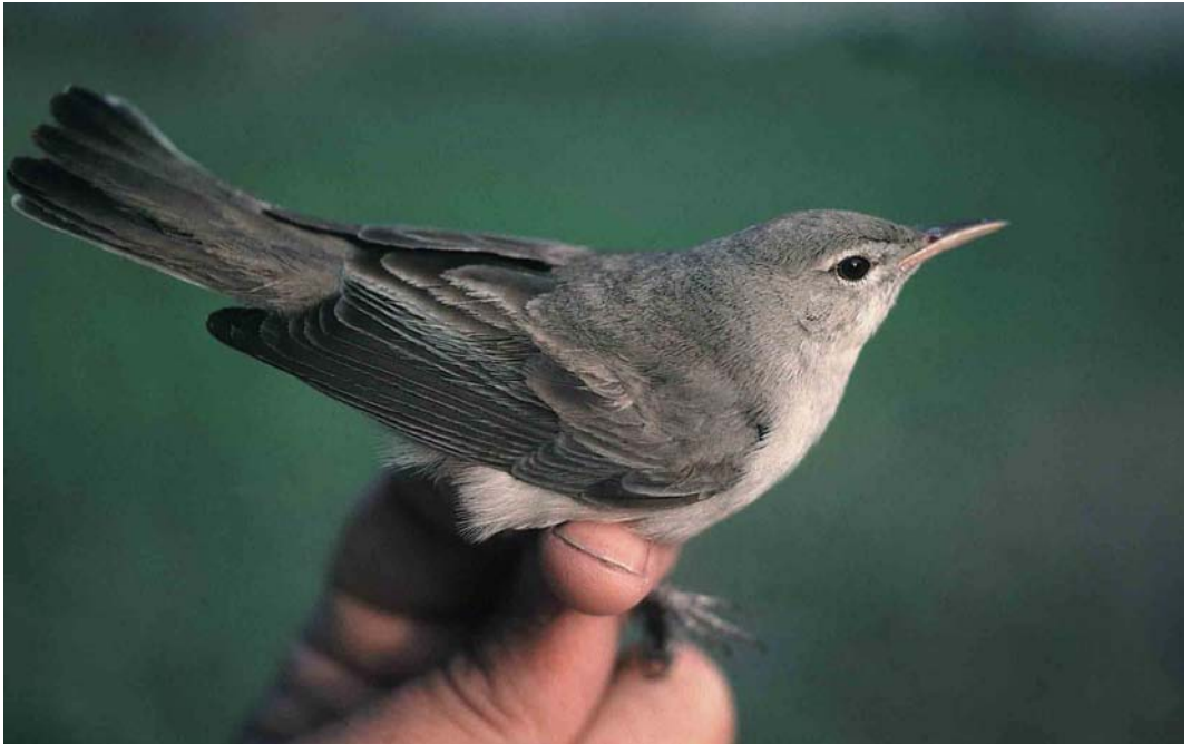
173 Upcher's Warbler / Grote Vale Spotvogel Hippolais languida , Jubail, Gulf, Saudi Arabia, 30 April 1991 (Arnoud B van den Berg)