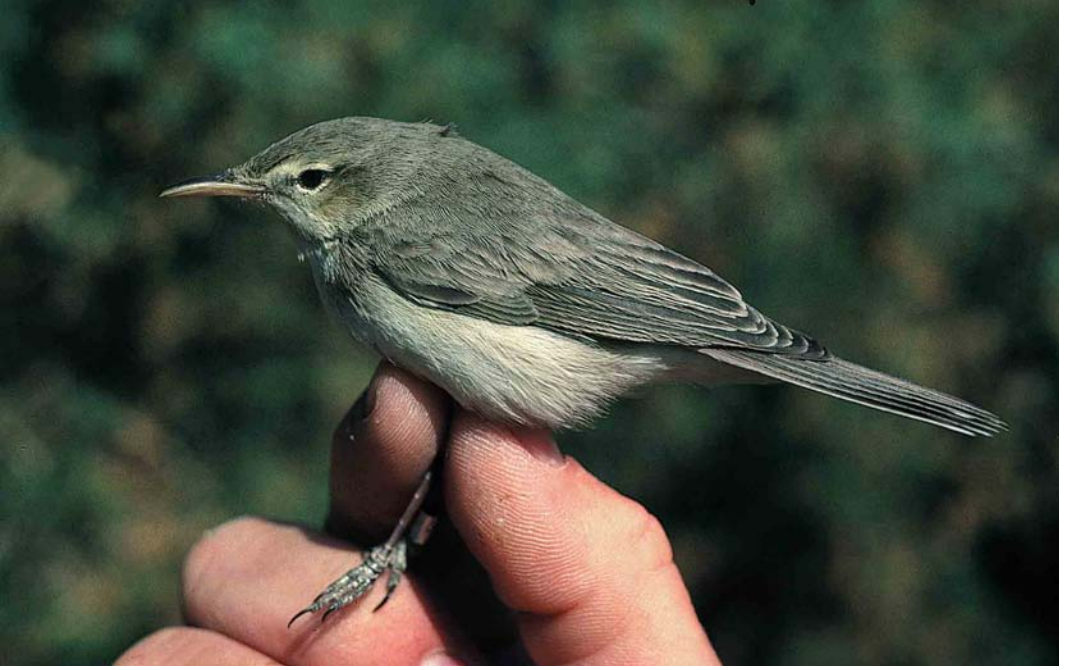
174 Eastern Olivaceous Warbler / Oostelijke Vale Spotvogel Acrocephalus pallidus elaeicus , Eilat, Israel, 11 March 1993