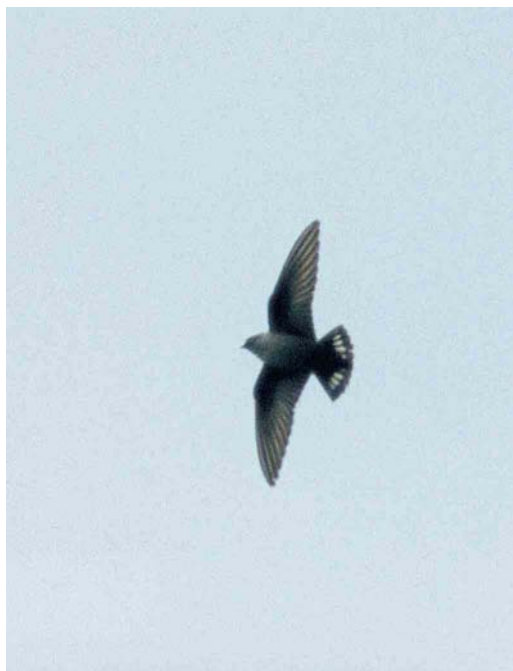
178 Shikra / Shikra Accipter badius , Eilat, Israel, 2 May 1999 179 Eurasian Crag Martin / Rotszwaluw Ptyonoprogne rupestris , Swithland Reservoir, Leicestershire, England, 17 April 1999 180 Lesser Yellowlegs / Kleine Geelpootruiter Tringa flavipes , Boavista, Cape Verde Islands, 17 March 1999 181 Greater Sand Plover / Woestijnplevier Charadrius leschenaultii , male, John Muir Country Park, Lothian, Scotland, 6 June 1999