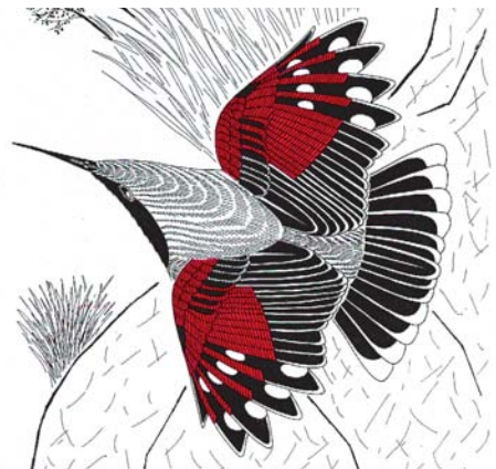
FIGURE 1 Wallcreeper / Rotskruiper Tichodroma muraria during 'investigative flight' (Miroslav Saniga) FIGURE 2 Wallcreeper / Rotskruiper Tichodroma muraria during characteristic downward 'gliding flight' (Miroslav Saniga) FIGURE 3 Wallcreeper / Rotskruiper Tichodroma muraria during attack by aerial predator. Bird makes erratic flight with abrupt turns (side-slipping) (Miroslav Saniga) FIGURE 4 Wallcreeper / Rotskruiper Tichodroma muraria during traverse climbing with characteristic wing- and tail-flicking (Miroslav Saniga) FIGURE 5 Wallcreeper / Rotskruiper Tichodroma muraria during vertical hopping (Miroslav Saniga) FIGURE 6 Wallcreeper / Rotskruiper Tichodroma muraria . While climbing, expressing excitement or alertness by extent and angle of wing-flicking (Miroslav Saniga)