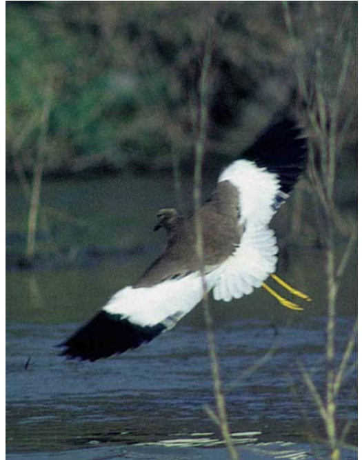
17 Witstaartkievit / White-tailed Lapwing Vanellus leucurus , Assendelft, Noord-Holland, 23 februari 1998 (René Pop) 18 Witstaartkievit / White-tailed Lapwing Vanellus leucurus , Assendelft, Noord-Holland, 23 februari 1998 (Arnoud B van den Berg) 19 Witstaartkievit / White-tailed Lapwing Vanellus leucurus , Assendelft, Noord-Holland, 23 februari 1998 (René Pop)