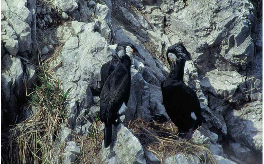
4 Temminck's Cormorants / Japanese Aalscholvers Phalacrocorax capillatus , adults, summer plumage, Honshu, Japan, June 1998 (Mike Danzenbaker). These birds showing broad yellow facial skin behind eye, all-black bill, extensive pale cheek-patch and greenish sheen on wing-coverts 5 Temminck's Cormorants / Japanese Aalscholvers Phalacrocorax capillatus , adults, starting moult from summer to winter plumage, Honshu, Japan, June 1998 (Mike Danzenbaker). Note extension of white feathering along base of bill