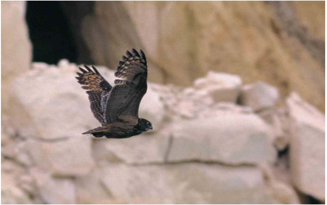
177 Eurasian Eagle Owl / Oehoe Bubo bubo , adult, Maastricht, Limburg, Netherlands, 5 June 1999

legs Tringa flavipes for the Cape Verde Islands was photographed on Boavista on 17 March. An adult summer Spotted Sandpiper Actitis macularia was seen at Loch Spynie, Moray, Scotland, on 25 May. A minor influx of Terek Sandpipers Xenus cinereus in north-western Europe involved, eg, three in April and three in May in Britain, two on 1-2 May in France, two on 12 and 27 May in Belgium, five in May in the Netherlands, three in Denmark from 25 May to 7 June, and three in Norway from 21 May to 9 June. In France, a Wilson's Phalarope Phalaropus tricolor turned up at Brem-sur-Mer, Vendée, on 3 May. The sixth and seventh for Denmark (and the firsts since 1987) were females in Vestjylland at Værnengene, Skjern, on 2-10 May and at Vest Stadil Fjord, Ringkøbing, on 10-11 May. The eighth for Sweden was a male at Hörningsholm, Alnön, Medelpad, on 9 May. In Portugal, an adult summer male was photographed at Pancas, Ribatejo, Tejo estuary, on 26 May. In Germany, one was seen at Katinger Watt, Schleswig-Holstein, on 8 June.