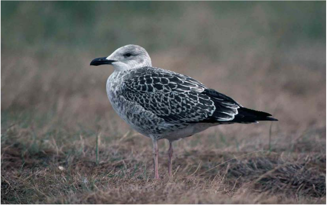
116 Lesser Black-backed Gull / Kleine Mantelmeeuw Larus graellsii , juvenile, Maasvlakte, Zuid-Holland, Netherlands, August 1990. Rather pale-headed individual 117 Baltic Gull / Baltische Mantelmeeuw Larus fuscus , juvenile, Turku, Finland, 3 September 1997. Note pattern of fresh first-winter scapulars, whitish fringes of wing-coverts and tertials, and pale ground colour of head and underparts