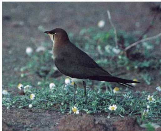
183 Black-winged Pratincole / Steppenvorkstaartplevier Glaucopis tricolor , Mandria, Paphos, Cyprus, 15 April 1999 (Adrian Jordi)

Øystre, Finnmark, Norway, a second-year Ivory Gull Pagophila eburnea was found among Black-legged Kittiwakes Rissa tridactyla on 6 June. On Sylt, Schleswig-Holstein, Germany, three Lesser Crested Terns Sterna bengalensis were seen flying past on 19 May. Three adult Roseate Terns S. dougallii were seen at Oued Souss, Agadir, Morocco, on 27 April. In England, a first-summer Forster's Tern S. forsteri remained from 29 May to at least early July at Tollesbury Fleet, Kent. The first Bridled Tern S. anaethetus for Germany flew about along the southern bank of the Elbe, between Hamburg and Niedersachsen, on 1-2 June and perhaps the same was on Helgoland, Schleswig-Holstein, on 3-4 June. On 30 June, the first for Sweden was discovered at Sörskär, Bohuslän. In the Netherlands, a flock of 14 Whiskered Terns Chlidonias hybridus turned up south of Maastricht, Limburg, on 1 May. The species' continued presence during May-June in other parts resulted in the country's 42nd breeding record, at Soerendonks Goor, Noord-Brabant, where at least one young fledged in the third week of June; previous breeding records were in 1938 (nine), 1945 (nine), 1958 (15), 1965 (seven) and 1997 (one).