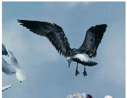
133 Baltic Gull / Baltische Mantelmeeuw Larus fuscus , juvenile, Lahti, Finland, 27 August 1997 ( Visa Rauste ). Note greater wing-coverts with dark base and large pale tip 134 Baltic Gull / Baltische Mantelmeeuw Larus fuscus , juvenile, Lahti, Finland, 24 September 1997 ( Visa Rauste ). Fairly pale individual 135 Baltic Gull / Baltische Mantelmeeuw Larus fuscus , first-summer, Turku, Finland, 10 August 1993 ( Henry Lehto ). Fresh primaries, plain blackish-brown mantle feathers and scapulars in combination with pale dark-speckled underparts characteristic for this plumage; bicoloured bill also typical (normally, uniformly dark in grællsii ) 136 Baltic Gull / Baltische Mantelmeeuw Larus fuscus , first-summer, Topinoja, Finland, 17 July 1998 ( Harry J Lehto ). Inner primaries to p7 fresh, in contrast with older and browner p10 (p8-9 missing or not visible) 137 Baltic Gull / Baltische Mantelmeeuw Larus fuscus , first-summer, Topinoja, Finland, 19 May 1998 ( Harry J Lehto ) 138 Baltic Gull / Baltische Mantelmeeuw Larus fuscus , first-summer, Kuopio, Finland, 9 July 1998 ( Harry J Lehto ). Note variability in tail pattern compared with bird in plate 137