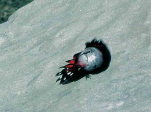
168 Wallcreeper / Rotskruiper Tichodroma muraria , Cirque de Gavarnie, Hautes-Pyrénées, France, 4 September 1995