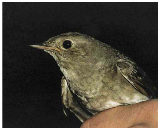
193 Citroenkwikstaart / Citrine Wagtail Motacilla citreola , vrouwtje, Katwijk aan Zee, Zuid-Holland, 7 mei 1999 194 Bergfluitier / Western Bonelli's Warbler Phylloscopus bonelli , Kennemerduinen, Noord-Holland, 1 mei 1999 195 Poelruiter / Marsh Sandpiper Tringa stagnatilis , Hoernerbos, Terschelling, Friesland, 16 april 1999 196 Amerikaanse Goudplevier / American Golden Plover Pluvialis dominicus , Groote Keeten, Noord-Holland, 22 april 1999 197 Vale Gier / Eurasian Griffon Vulture Gyps fulvus , onvolwassen, Wissenkerke, Zeeland, 3 juni 1999 198 Noordse Nachtegaal / Thrush Nightingale Luscinia luscinia , Ooypolder, Gelderland, 27 mei 1999