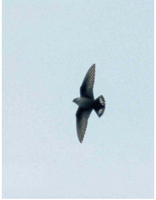
178 Shikra / Shikra Accipter badius , Eilat, Israel, 2 May 1999 ( Henk Smit ) 179 Eurasian Crag Martin / Rotszwaluw Ptyonoprogne rupestris , Swithland Reservoir, Leicestershire, England, 17 April 1999 ( Iain H Leach ) 180 Lesser Yellowlegs / Kleine Geelpootruiter Tringa flavipes , Boavista, Cape Verde Islands, 17 March 1999 ( Manfred Koch ) 181 Greater Sand Plover / Woestijnplevier Charadrius leschenaultii , male, John Muir Country Park, Lothian, Scotland, 6 June 1999 ( Mark Darling )