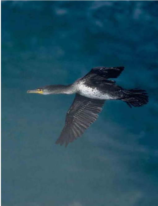
2 Temminck's Cormorant / Japanese Aalscholver Phalacrocorax capillatus , first-summer, Honshu, Japan, June 1998. Aged as first-summer because of extensively white underparts, except for dark flanks and small dark patch on upper breast 3 Temminck's Cormorant / Japanese Aalscholver Phalacrocorax capillatus , adult acquiring full summer plumage, Kyushu, Japan, February 1998. Note heavily mottled cheek-patch and obvious yellow skin extending up behind eye. Although not as dark as later in breeding season, bill already darkened significantly on both upper and lower mandibles

ing to much of the upper mandible but with a darker culmen. In second-year birds, the dark on the culmen becomes more extensive and the yellow is much reduced. However, it is still apparent on the distal half of the lower mandible. Winter-plumaged adults show a pinkish-yellow cast to the lower mandible, especially the distal half, with much white scaling on the bill-sides and an extensive dark culmen. In breeding plumage, adults show completely dark bills. The nail appears to be usually dark, although there is possibly some variation in immatures. In contrast, Great Cormorants of both subspecies P c sinensis and P c hanedae show pale grey or horn-coloured bills, especially on the lower mandible and cutting edges of the upper mandible. They apparently never show obvious yellow on the bill. The culmen is typically dark, especially in breeding-plumaged adults. The nail is often pale although breeding adults can show a dark nail. In breeding-plumaged adults, the whole outer half of the bill can appear dark. At least some immature Great appear to acquire a slightly darker nail in