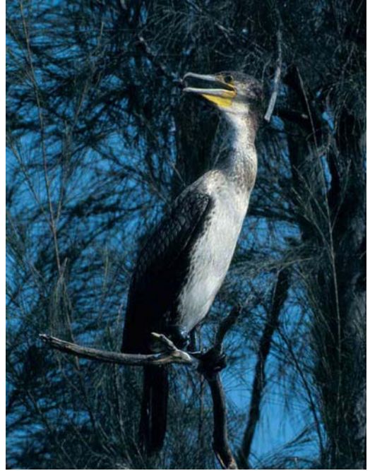
6 Great Cormorant / Aalscholver Phalacrocorax carbo of subspecies hanedae , adult, summer plumage, Honshu, Japan, February 1997 (Nick Lethaby). This bird showing bronze tones on wing-coverts characteristic of Great Cormorant. In addition, white filoplumes covering whole crown and almost reaching bottom edge of cheek-patch. Note yellow facial skin not extending up behind eye or tapering to sharp point at gape and pale base to lower 7 Great Cormorant / Aalscholver Phalacrocorax carbo of subspecies sinensis , immature, Hong Kong, China, October 1996 (Geoff J Carey). Immature sinensis showing much more extensive white on underparts than P c hanedae , matching that of immature Temminck's Cormorant P capillatus . Note yellow orbital ring of this bird. Great Cormorant commonly showing this but never matching broad extension of yellow skin up behind eye shown by Temminck's Cormorant

showing fewer and shorter filoplumes. Some individuals have already lost the white thigh-patch by this date too and may even begin to show the paler throat and breast-mottling characteristic of winter plumage. In breeding plumage, Temminck's Cormorants have a general resemblance to Great Cormorants, showing an all-black body and wings with a conspicuous white thigh-patch and pale cheeks. The cheek-patch is probably even more mottled in breeding plumage. Especially early in the breeding season, they also have conspicuous white filoplumes on the sides of the head and upper neck. Both species show considerable variation in the extent and thickness of the white filoplumes although Temminck's may have a greater tendency to show very thick filoplumes, enhancing its big-headed appearance. In addition, in Temminck's, there is typically a broad black divide between the pale cheek-patch and the start of the filo-