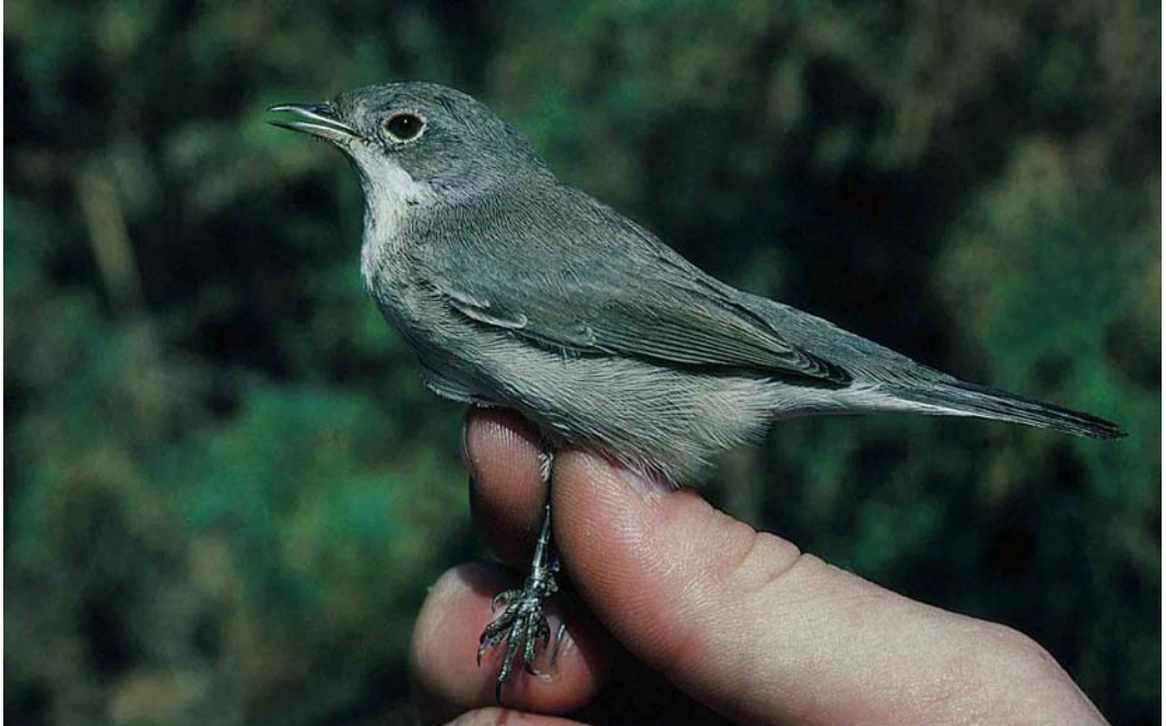
39 Sardinian Warbler / Kleine Zwartkop Sylvia melanocephala , first-winter female, Eilat, Israel, 10 November 1992