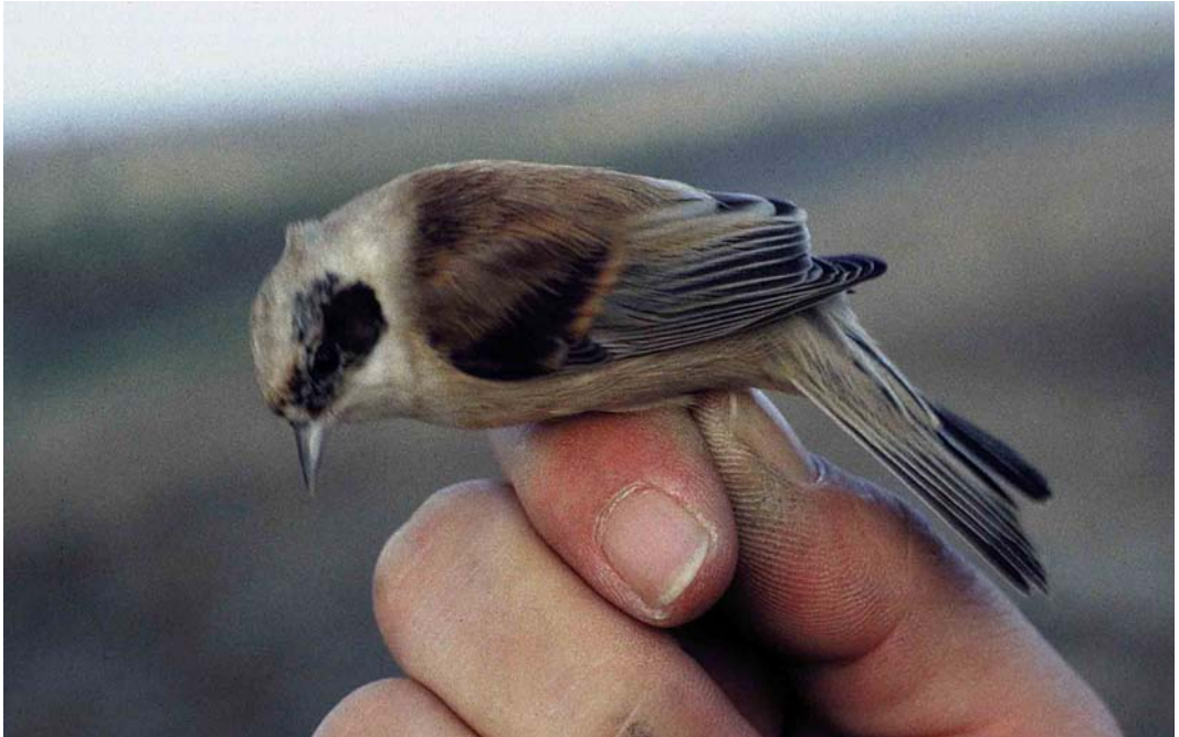
33 Buidelmees / Eurasian Penduline Tit Remiz pendulinus , eerste-kalenderjaar mannetje / first calendar-year male, Verdronken Land van Saeftinge, Hulst, Zeeland, 24 december 1997 ( Alex Wieland ) 34 Buidelmees / Eurasian Penduline Tit Remiz pendulinus , tweede-kalenderjaar mannetje / second calendar-year male, Verdronken Land van Saeftinge, Hulst, Zeeland, 21 november 1998 ( Alex Wieland ). Zelfde individu als in plaat 33 / same individual as in plate 33