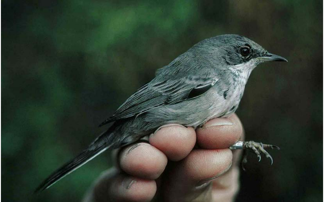
38 Cyprus Warbler / Cyprusgrasmus Sylvia melanothorax , first-winter male, Eilat, Israel, 24 November 1992

proach either. The underparts of female Italian regularly show the diffuse dark streaks and dots typical of female Spanish. The upperparts can resemble those of Spanish but are often rather similar to those of House, being rather rufous-toned with warm buff 'tramlines', and thus differ in this respect from the mystery bird.