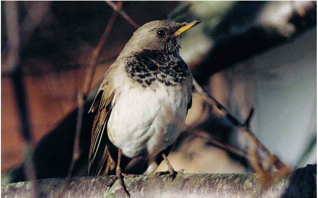
47 Black-throated Thrush / Zwartkeellijster Turdus ruficollis atrogularis , Woodlands Park, Maidenhead, Berkshire, England, January 1999