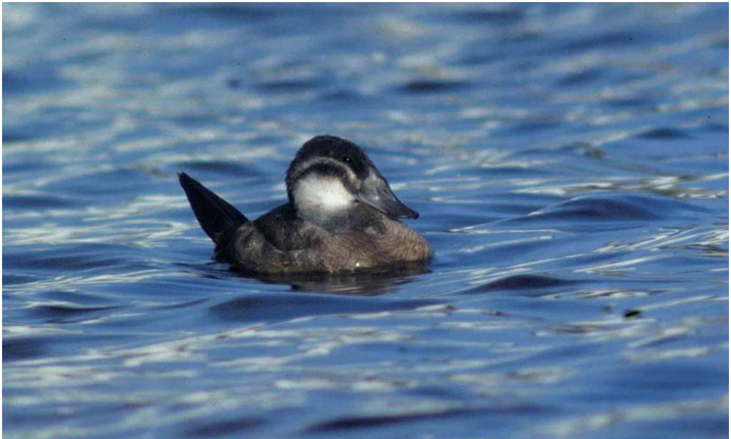
24 Witkopeend / White-headed Duck Oxyura leucocephala , eerste-winter, Kleine Nieuwe Diep, Amsterdam, Noord-Holland, 21 januari 1998

De vogel schuwde ruw water niet, maar bevond zich ook geregeld meer in de luwte waar hij meestal lag te slapen. Anderen zagen de vogel vaak langere tijd achtereen duikend voedselzoeken. GvD zag op 21 januari dat hij belangstellend op een Meerkoet Fulica atra afzwom die zojuist een grote zoetwatermossel opgedoken had.