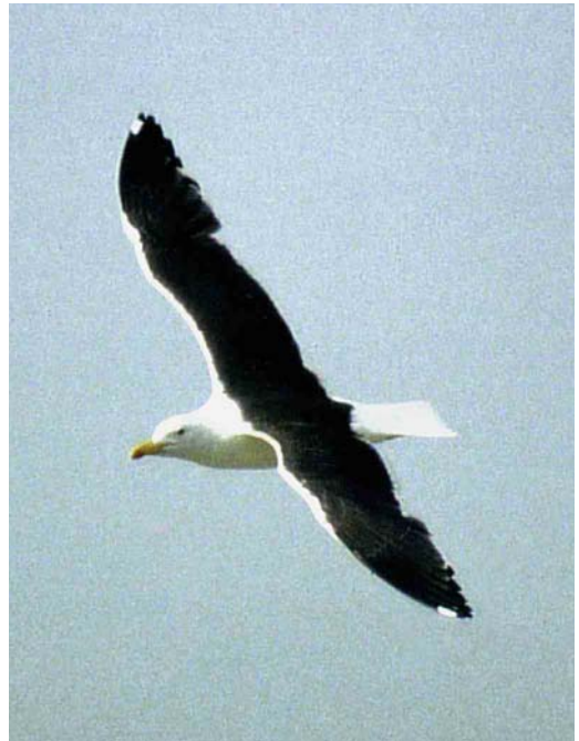
23 Baltische Mantelmeeuw / Baltic Gull Larus fuscus , adult, Schiermonnikoog, Friesland, 19 oktober 1992

Hierdoor wordt de keuze beperkt tot Baltische Mantelmeeuw en Kleine Mantelmeeuw (waarvan de noordelijke vogels zeer donkere bovendelen kunnen laten zien). Het onderscheid tussen deze taxa wordt op veel plaatsen in de literatuur behandeld. De nadruk ligt hierin op biometrische verschillen en de kleur van de bovendelen. Het uiterlijk van de vogel van Schiermonnikoog past beter op Baltische Mantelmeeuw dan op een donkere Kleine Mantelmeeuw. De bijna zwarte kleur van vleugel en bovendelen klopt goed voor Baltische Mantelmeeuw die in vergelijking met Kleine Mantelmeeuw een (nog) donkerdere bovenzijde laat zien (zonder het bij Kleine Mantelmeeuw vaak voorkomende blauwgrijze was). Ook de aanwezigheid van een enkele 'mirror' in p10 en het ontbreken van een duidelijk contrast in de vleugelpunt past beter op Baltische Mantelmeeuw maar sluit Kleine Mantelmeeuw niet uit. Het ontbreken van witte toppen aan de buitenste handpennen past goed op Baltische Mantelmeeuw; Kleine Mantelmeeuw heeft doorgaans zelfs in gesleten kleed duidelijke witte handpentoppen (Jonsson 1998). Andere kenmerken, zoals de bij Baltische Mantelmeeuw rondere kop, kortere snavel, kortere poten en langere, smallere vleugels (en daardoor in zit langere handpenprojectie; cf Cramp &