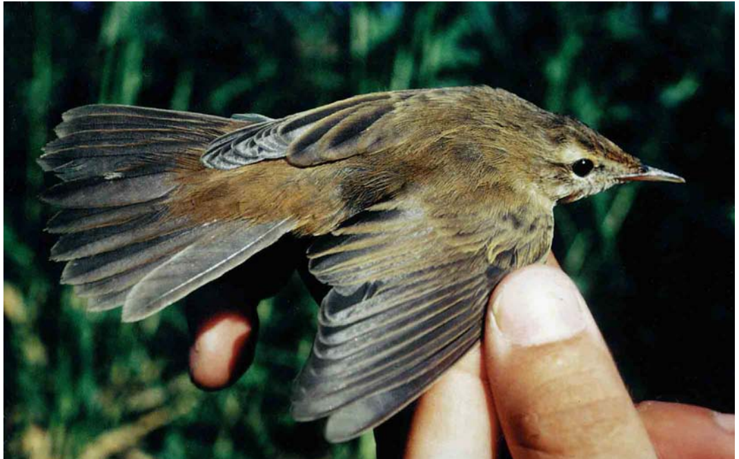
32 Waarschijnlijke hybride Rietzanger x Kleine Karekiet / probable hybrid Sedge Warbler x European Reed Warbler Acrocephalus schoenobaenus x scirpaceus , Laajalahti, Finland, 10 augustus 1980 (Antero Topp)

Gelet op de tongvlekken en de vrij gave handen armpennen betrof het een eerstejaars vogel (cf Svensson 1992). De herkomst is uiteraard onbekend, maar verondersteld wordt, gezien de vroege vangdatum en de terugvangst een week later, dat het een plaatselijke vogel betrof. Dit lijkt op zich opmerkelijk, omdat de twee soorten