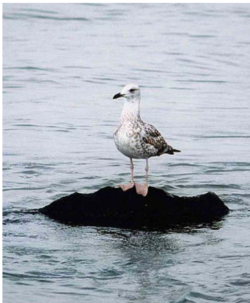
35-36 Presumed Yellow-legged Gull / vermoedelijke Geelpootmeeuw Larus michahellis , Nieuwe Waterweg, Rozenburg, Zuid-Holland, Netherlands, 1 September 1997

The lesser and median coverts look a little messy with apparently some broader pale indentations. This is typical of michahellis , cachinnans more commonly showing a simple pattern of