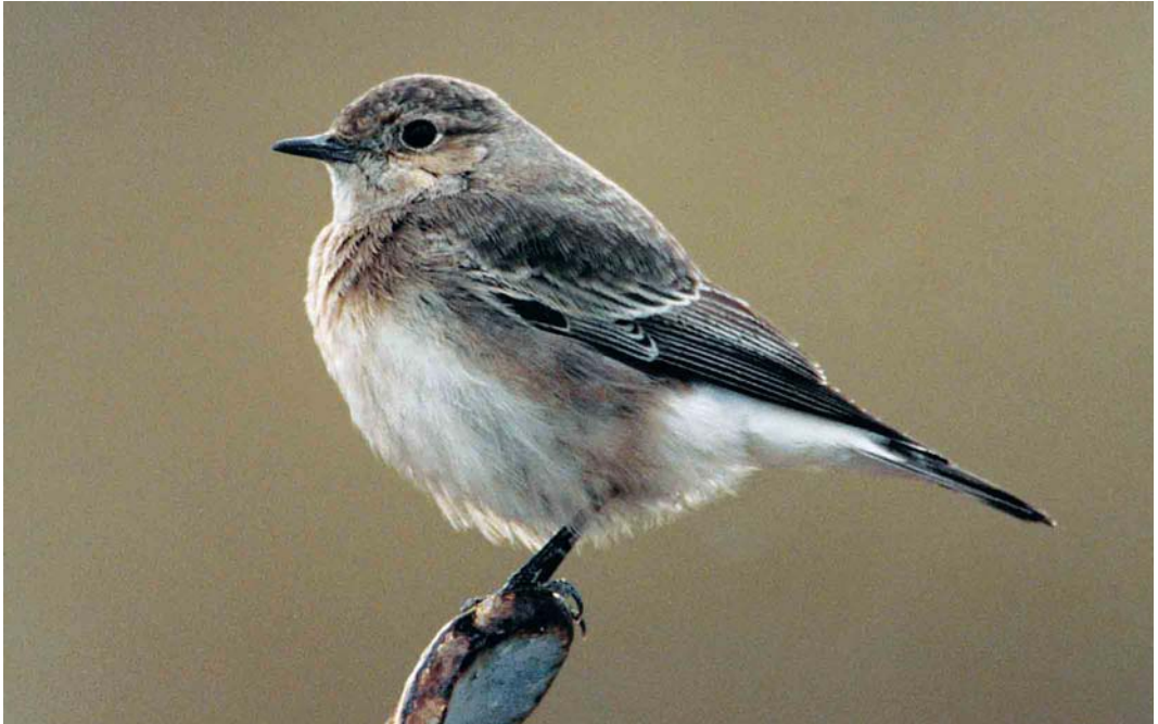
46 Pied Wheatear / Bonte Tapuit Oenanthe pleschanka , Tynemouth, Tyneside, England, December 1998