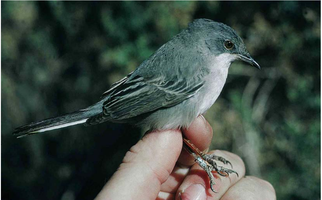
40 Rüppell's Warbler / Rüppells Grasmus Sylvia rueppelli , female, Eilat, Israel, 9 April 1993