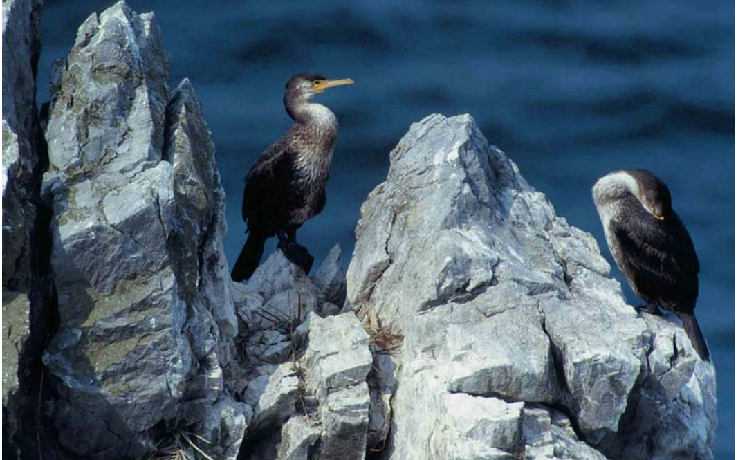
1 Temminck's Cormorants / Japanese Aalscholvers Phalacrocorax capillatus , immatures, Honshu, Japan, June 1998. Bird on left probably second-summer, bird on right first-summer. On second-summer, note yellow tones on bill, yellow facial skin tapering to sharp point behind gape and extending up behind eye. This individual showing especially yellow lores. Second-summer showing narrow white line down centre of otherwise dark belly, pale lower breast and dark upper breast and pale throat