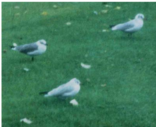
20-21 Lachmeeuw / Laughing Gull Larus atricilla , adult, Harderwijk, Gelderland, 25 september 1993

Enkele weken later kreeg WvH de dia's terug en stuurde de beste (de meeste waren door het sombere weer lang belicht en daardoor zeer onscherp) als 'raadselmeeuw' naar Marc Plomp met een begeleidende brief waarin aanvullende kenmerken vermeld werden. Met het oog op een