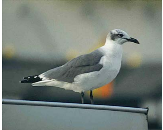
22 Lachmeeuw / Laughing Gull Larus atricilla , adult, Groningen, Groningen, 18 oktober 1997

3 Het laatste punt van twijfel betreft de snavellengte. Op geen van de dia's is de snavellengte goed en profiel te zien. De snavel was ten minste zo lang als bij een Kokmeeuw en zowel volgens de beschrijving als op enkele dia's zichtbaar iets naar beneden gebogen zoals gebruikelijk bij Lachmeeuw. Wellicht had de vogel van Harderwijk een korte snavel, vallend binnen de normale variatie (snavellengte bij Lachmeeuw 32.8-41 mm, bij Kokmeeuw 28.2-36.9, Cramp & Simmons 1983). Een snavel die nauwelijks langer lijkt dan die van Kokmeeuwen hoeft dus niet uitzonderlijk te zijn. Daarnaast is het mogelijk dat geen van de enigszins scherpe dia's de vogel in een zodanige houding toont dat de snavellengte objectief te bepalen is.