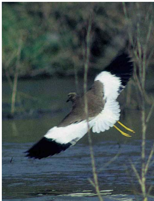
17 Witstaartkievit / White-tailed Lapwing Vanellus leucurus , Assendelft, Noord-Holland, 23 februari 1998 (René Pop) 18 Witstaartkievit / White-tailed Lapwing Vanellus leucurus , Assendelft, Noord-Holland, 23 februari 1998 (Arnoud B van den Berg) 19 Witstaartkievit / White-tailed Lapwing Vanellus leucurus , Assendelft, Noord-Holland, 23 februari 1998 (René Pop)